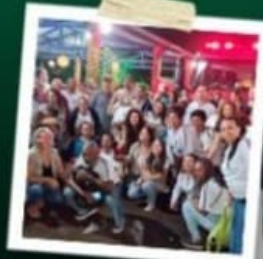
PALESTRAS NO VIVEIRO DE PLANTAS SEM LEO