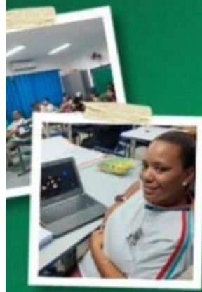
CURSOS DO SEBRAE, SENAC E NA ÁREA DA TECNOLOGIA