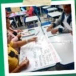
PROFESSORES COMPROMETIDOS E ACOLHEDORES