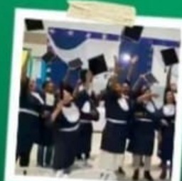
FORMATURA CUSTO ZERO PARA OS ALUNOS