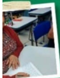
ELIBERT COM PREMIAÇÃO