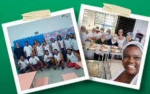
KIT DE MATERIAL ESCOLAR, UNIFORME & JANTAR BALANCEADO PARA OS ALUNOS