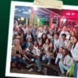
PALESTRAS NO VIVEIRO DE PLANTAS SEM LEO