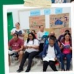
PROJETO DE LEITURA EM PARCERIA COM O SES & BIBLIOTECA DE RODINH