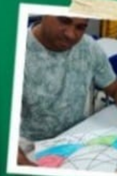
CARTAZ E REDAÇÃO PAZ COM PREMIAÇÃO