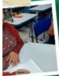
LIBERT COM PREMIAÇÃO