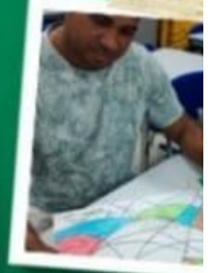
CARTAZ E REDAÇÃO PAZ COM PREMIAÇÃO