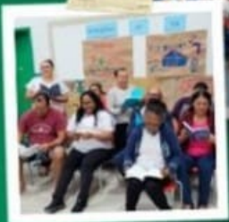
PROJETO DE LEITURA EM PARCERIA COM O SES & BIBLIOTECA DE RODINH