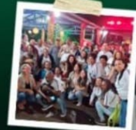
PALESTRAS NO VIVEIRO DE PLANTAS SEM LEO