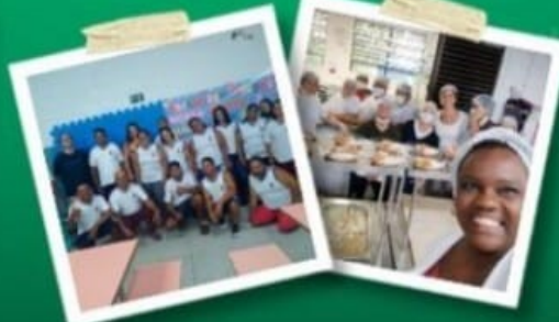
KIT DE MATERIAL ESCOLAR, UNIFORME & JANTAR BALANCEADO PARA OS ALUNOS