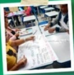
PROFESSORES COMPROMETIDOS E ACOLHEDORES