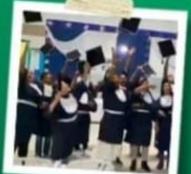
FORMATURA CUSTO ZERO PARA OS ALUNOS