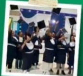
FORMATURA CUSTO ZERO PARA OS ALUNOS