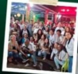
PALESTRAS NO VIVEIRO DE PLANTAS SEM LED