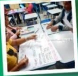
PROFESSORES COMPROMETIDOS E ACOLHEDORES