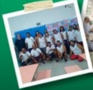
KIT DE MATERIAL ESCOLAR, UNIFORME & JANTAR BALANCEADO PARA OS ALUNOS