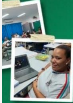
CURSOS DO SEBRAE, SENAC E NA ÁREA DA TECNOLOGIA