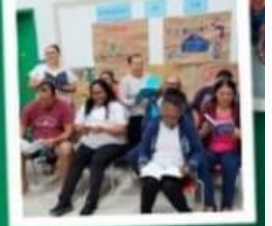
PROJETO DE LEITURA EM PARCERIA COM O SES & BIBLIOTECA DE RODINH