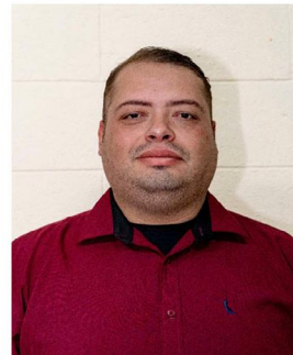
MESTRE TNT N. 88