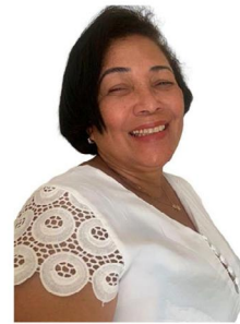
PROF. MARIA PASSOS N. 17