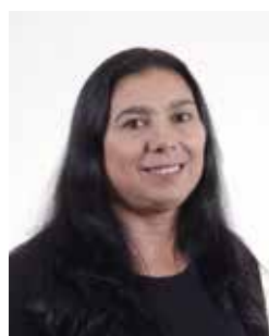
17 PROFª LAU