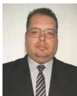
14 MESTRE TNT