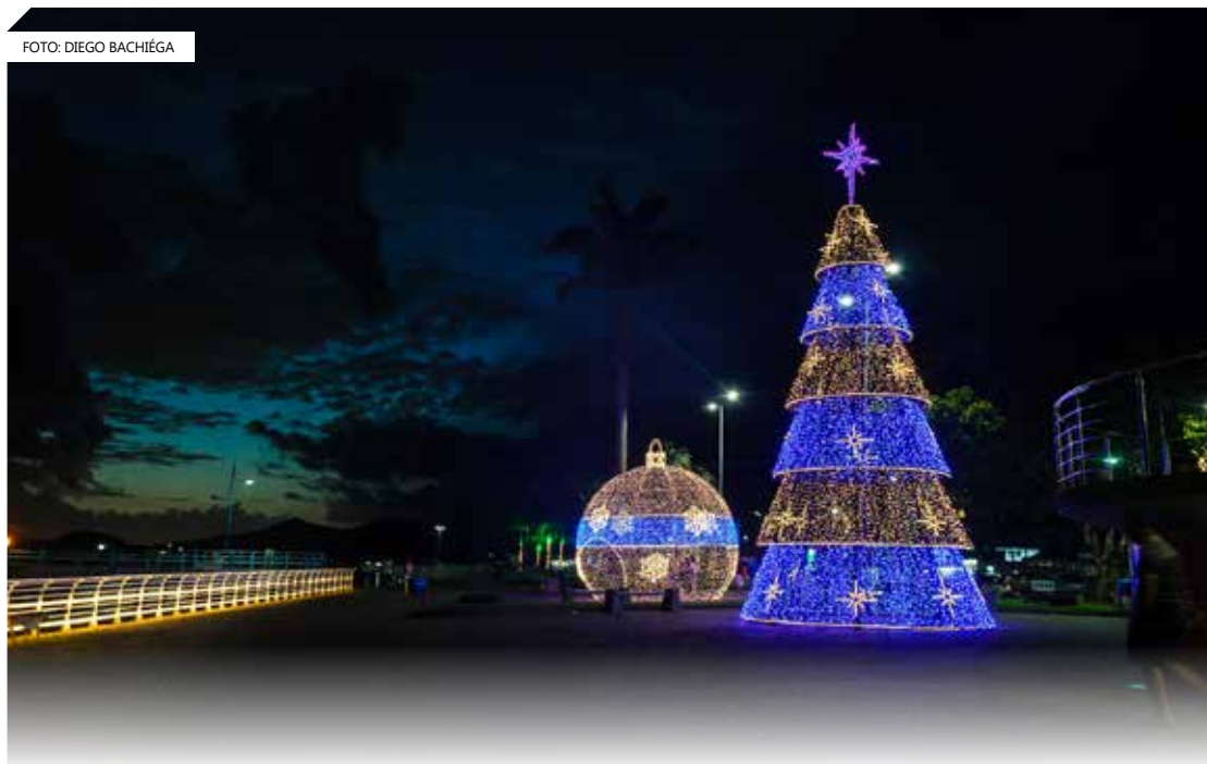
Orla da Praia, no final da Av. 19 de maio