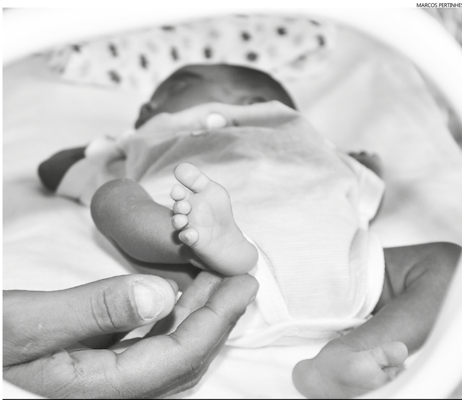
Pré-natal é um dos fatores fundamentais para a redução da taxa de mortalidade infantil em Bertioga

Taxa é menor que a média estadual, com 8,2 óbitos de crianças menores de um ano a cada mil nascidos vivos. Índice representa o aprimoramento da assistência ao parto e à gestante, o incentivo ao aleitamento materno e o acesso ao pré-natal