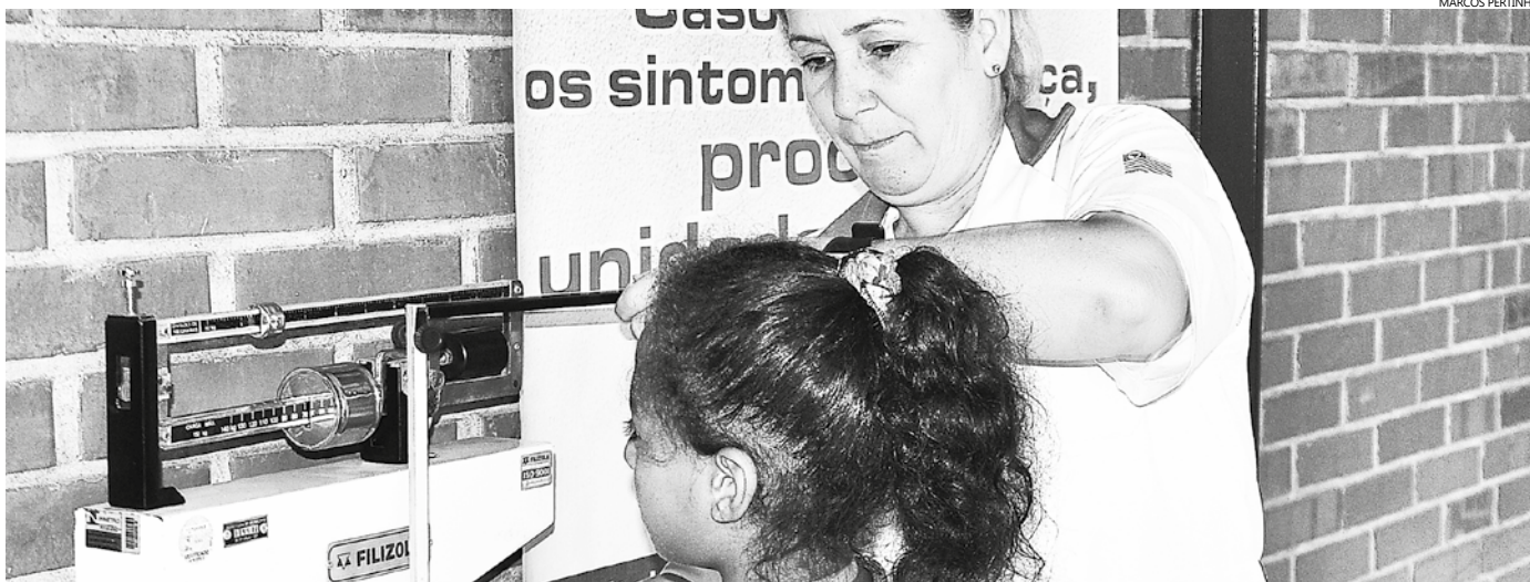
Pais devem levar seus filhos, com idade inferior a 07 anos, às Unidades Básicas de Saúde do Município para medição e pesagem

Pesagem é realizada em crianças de zero a 07 anos e mulheres em idade fértil, de 14 a 44 anos. Quem não fizer o procedimento pode ter o benefício bloqueado