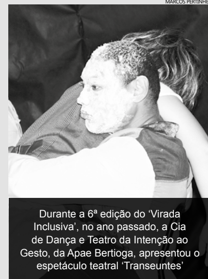
Durante a 6ª edição do 'Virada Inclusiva', no ano passado, a Cia de Dança e Teatro da Intenção ao Gesto, da Apae Bertioga, apresentou o espetáculo teatral 'Transeuntes'

Interessados em fazer os cursos de libras e braile, que serão disponibilizados durante o evento, têm até o próximo dia 23 para fazer a inscrição