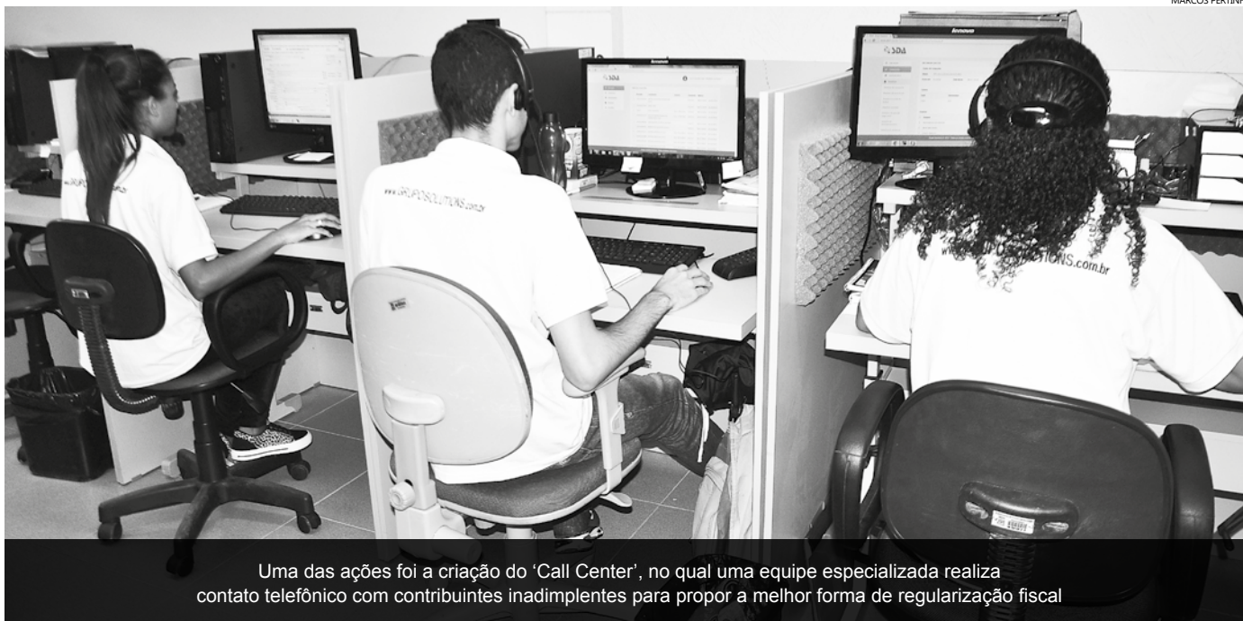
Uma das ações foi a criação do 'Call Center', no qual uma equipe especializada realiza contato telefônico com contribuintes inadimplentes para propor a melhor forma de regularização fiscal

Entre elas está a criação do 'Call Center', reestruturação da Sala do Contribuinte e implantação do Processo Judicial Eletrônico