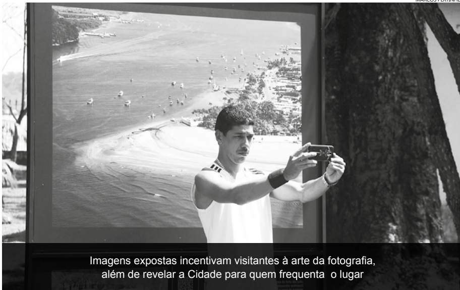
Imagens expostas incentivam visitantes à arte da fotografia, além de revelar a Cidade para quem frequenta o lugar

Curadoria vai selecionar 100 fotografias que serão impressas em painéis de PVC, com dimensão de 90 cm x 60 cm, expostas em um varal, no Parque dos Tupiniquins