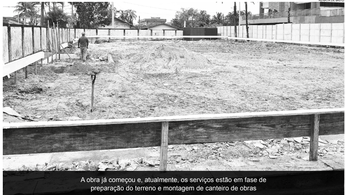
A obra já começou e, atualmente, os serviços estão em fase de preparação do terreno e montagem de canteiro de obras

O atendimento ao público é de segunda a sexta-feira, das 8h às 17 horas. Os encaminhamentos para consultas são feitos pelas Unidades Básicas de Saúde, onde o paciente é atendido. Já o retorno à unidade é agendado pelo próprio paciente pelo número 0800 7718118.