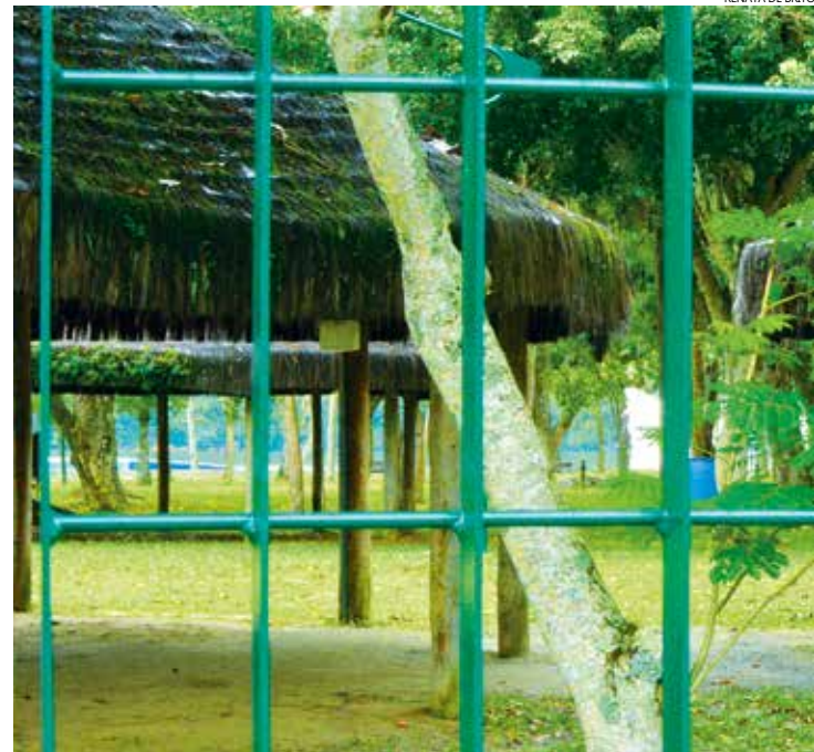
Além do Parque dos Tupiniquins gradil também protege o Forte São João, às margens do Canal de Bertioga e Praia da Enseada

O Parque dos Tupiniquins fica aberto todos os dias, das 9h às 17 horas e dá acesso ao Forte São João, também aberto à visitação. A entrada para os dois equipamentos turísticos é gratuita.