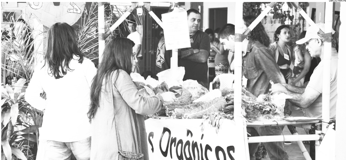
A construção desta rede teve início na VI Tarde no Viveiro e I Encontro de Orgânicos de Bertioga, realizados em 13 de agosto, no Viveiro de Plantas

Feira será montada no Parque dos Tupiniquins, no período da 15h às 19 horas