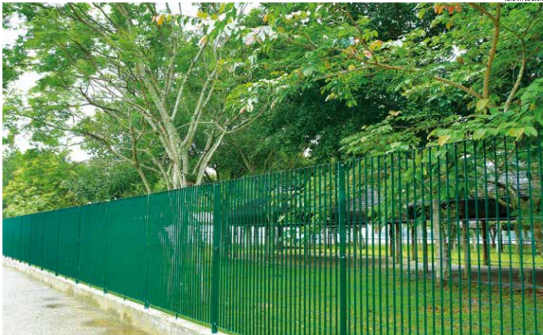
Gradil eletrosoldado, de aço galvanizado a fogo e pintura eletrostática é resistente a ambiente de agressividade marítima

Além da substituição do gradil, a Prefeitura vai recompor a mureta de apoio e recuperar a base de entrada do parque e da fortaleza, com a execução de calçamento