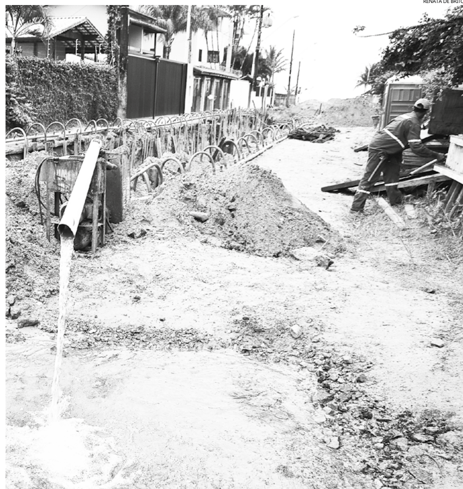
RENATA DE BRITO

Galeria de três metros de profundidade vai permitir o escoamento da água da chuva de uma bacia que inclui diversas ruas na região, evitando alagamentos