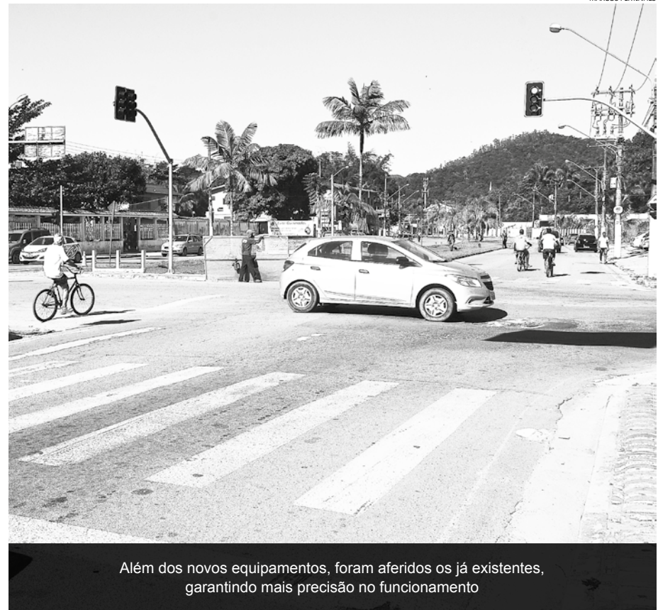
Além dos novos equipamentos, foram aferidos os já existentes, garantindo mais precisão no funcionamento

Os demais radares, que já estavam instalados e foram aferidos e colocados em funcionamento ficam na Avenida Anchieta, 9.456, próximo ao Condomínio Hanga Roa, no Vista Linda (50 Km/h); Avenida Anchieta,