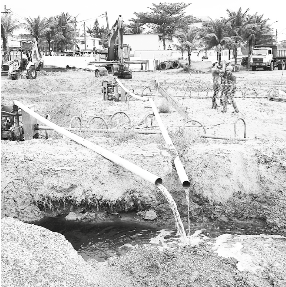
Serviço vai permitir o escoamento da água da chuva e evitar alagamentos na região