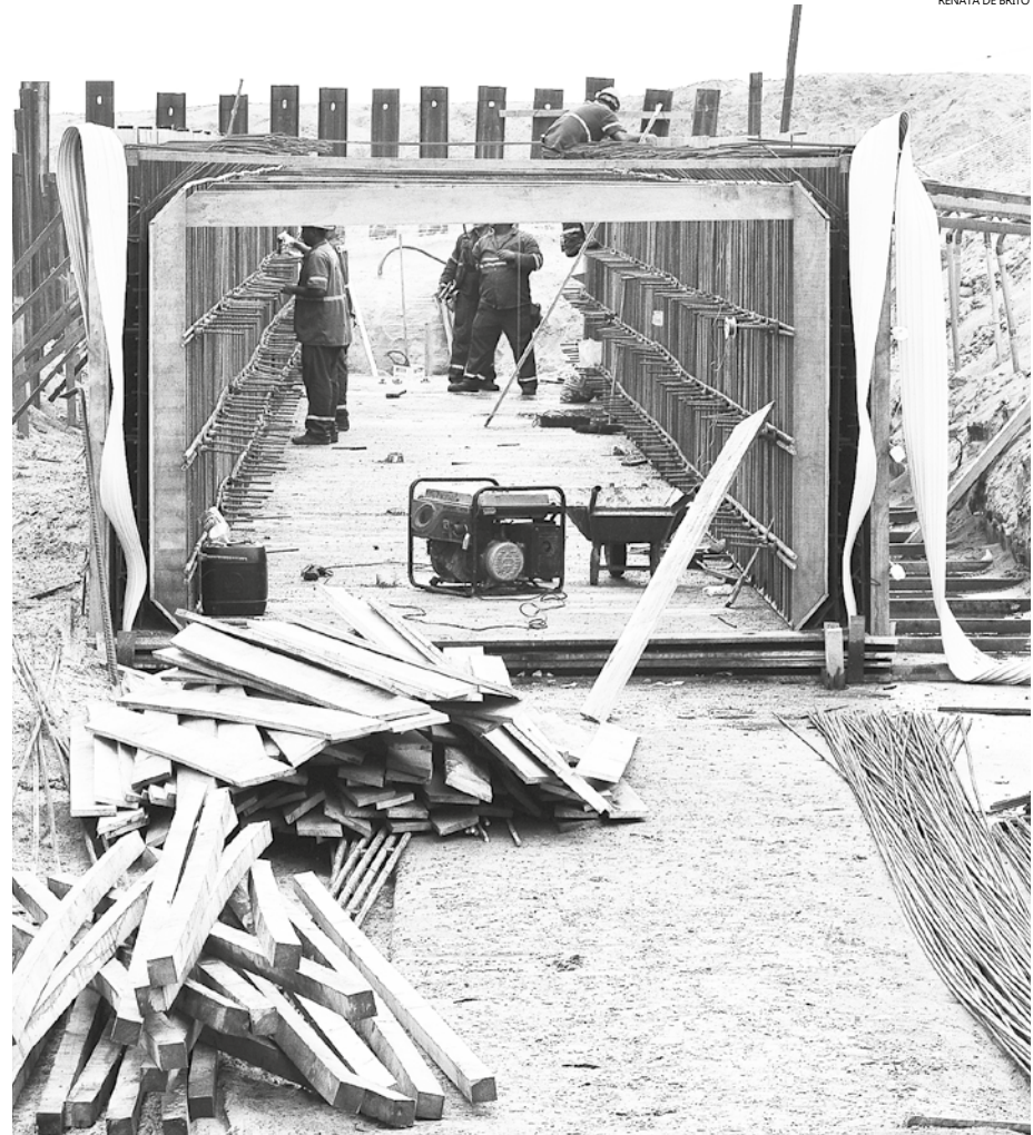
Toda a via, desde a Avenida Thomé de Souza, na praia, até a SP-55 (Rodovia Rio-Santos), totalizando 1.464 metros, receberá intervenções

Uma grande obra de infraestrutura urbana está sendo executada na Avenida Engenheiro Eduardo Correa da Costa Júnior, no bairro Vista Linda. Os serviços contemplam execução de galeria de macrodrenagem, guia, sarjeta, calçadas, recapeamento e pavimentação.