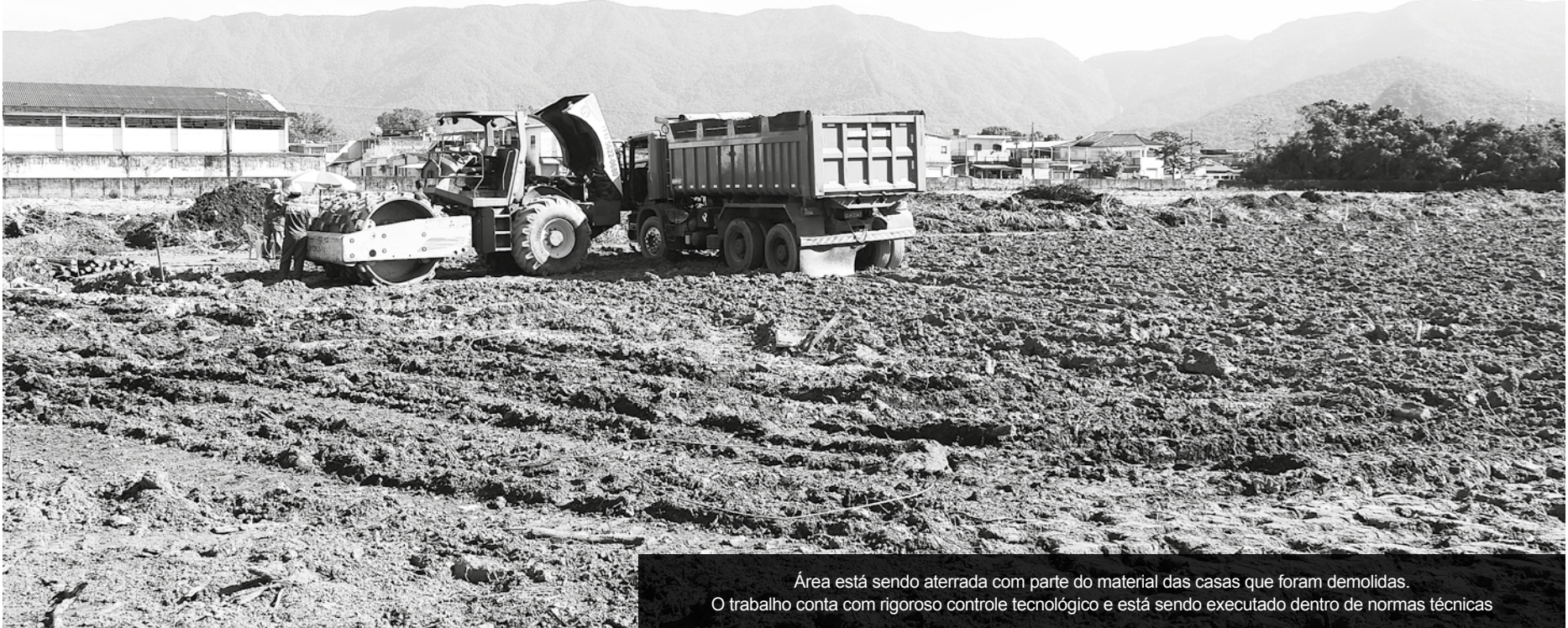
Área está sendo aterrada com parte do material das casas que foram demolidas. O trabalho conta com rigoroso controle tecnológico e está sendo executado dentro de normas técnicas

As obras de construção do Centro Comunitário de Esportes e Lazer no Bairro Chácaras estão em pleno andamento e a área onde se encontrava o Conjunto Habitacional Vila Militar, já está totalmente transformada. Os serviços são de responsabilidade da Sobloco Construtora, como parte de acordo judicial, celebrado entre a construtora, a Prefeitura de Bertioga e o Ministério Público.