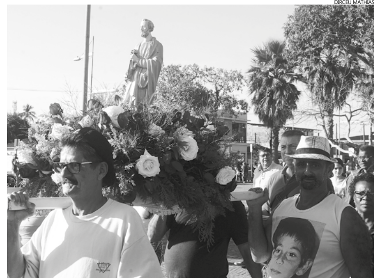
Procissão marítima sairá do flutuante municipal, recém-inaugurado no espaço onde funcionavam as balsas que fazem a travessia Bertioga-Guarujá

Festividades têm início às 15 horas e incluem bênção dos anzóis, procissão marítima e missa