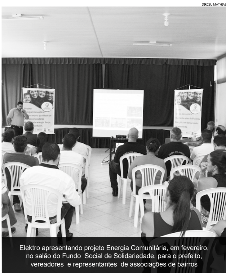
Elektro apresentando projeto Energia Comunitária, em fevereiro, no salão do Fundo Social de Solidariedade, para o prefeito, vereadores e representantes de associações de bairros

Evento acontece sábado (25), nos bairros Jardim Vicente de Carvalho e Chácaras, quando 180 moradores receberão o eletrodoméstico, visando a redução do consumo de energia elétrica