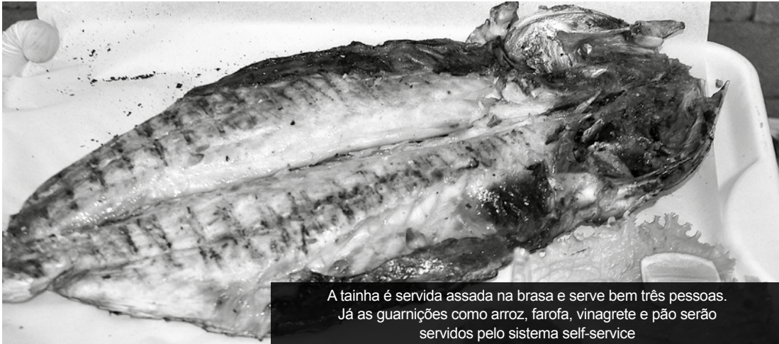
A tainha é servida assada na brasa e serve bem três pessoas. Já as guarnições como arroz, farofa, vinagrete e pão serão servidos pelo sistema self-service

Convite manterá o mesmo valor do ano passado, R$ 85,00. Às sextas-feiras será realizada a 'Noite Caiçara', com preço promocional, a R$ 75,00