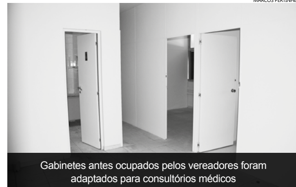
Gabinetes antes ocupados pelos vereadores foram adaptados para consultórios médicos

Unidade, que funcionava em imóvel alugado na Rua João Ramalho, 49, passará a atender no prédio que abrigava a Câmara de Vereadores, na Praça Vicente Molinari, ao lado do Hospital Municipal