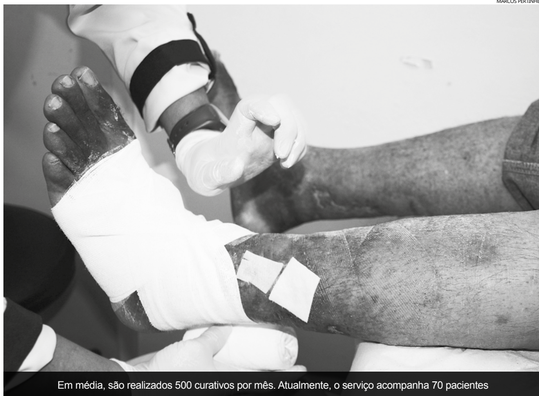
Em média, são realizados 500 curativos por mês. Atualmente, o serviço acompanha 70 pacientes

Ainda segundo Silsan, são realizados em média 500 curativos por mês. “Atualmente estamos acompanhando 70 pacientes. A troca dos curativos acontece a cada dois ou três dias na semana, variando conforme a complexidade de cada caso”, explica, informando que o paciente é orientado a retornar ao Ambulatório diante de qualquer