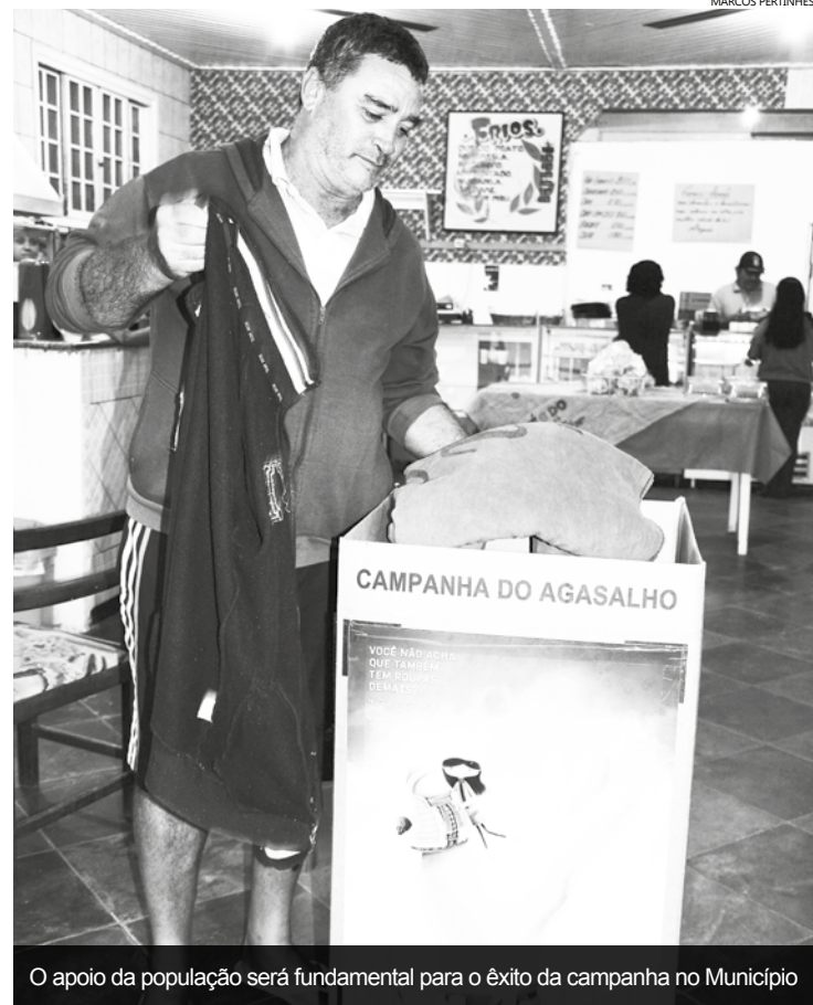
O apoio da população será fundamental para o êxito da campanha no Município