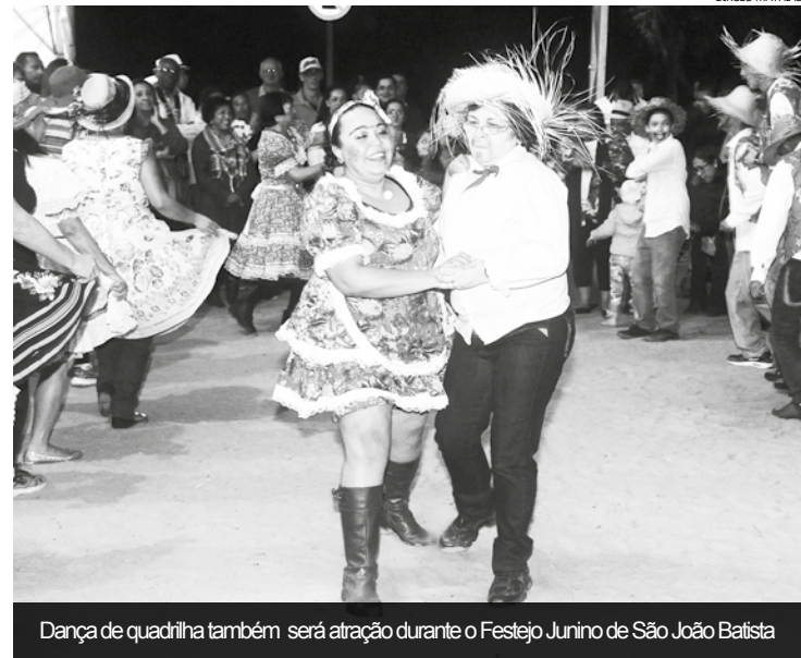
Dança de quadrilha também será atração durante o Festejo Junino de São João Batista

A festa, realizada pela Rádio Praia FM em parceria com a Paróquia São João Batista, e com o apoio da Prefeitura de Bertioga, acontece na Praça de Eventos, ao lado do Forte São João