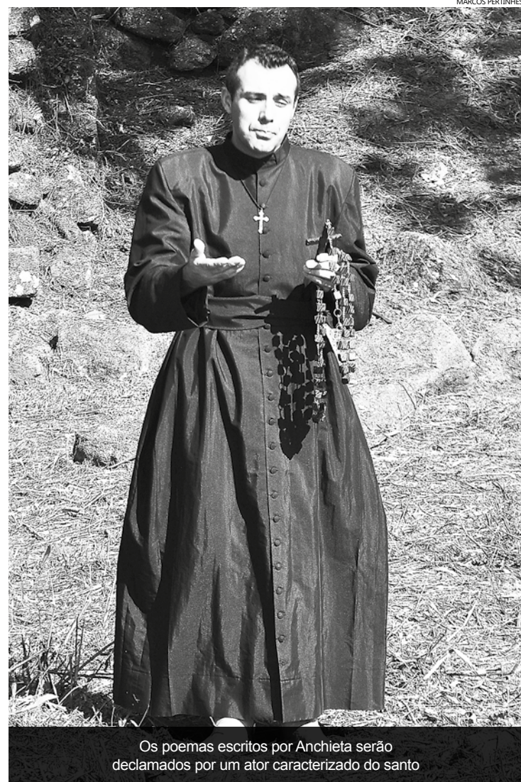
Os poemas escritos por Anchieta serão declamados por um ator caracterizado do santo

No sábado (04), das 14 às 16 horas, o Barco Escola Arca do Saber vai realizar a travessia do Canal de Bertioga, saindo do Pier Licurgo Mazzoni, até a Ermida, onde um ator irá interpretar São José de Anchieta, declamando as poesias do santo. A programação continua no domingo (05), quando o Barco Escola realizará saídas para a Ermida às 9h, 11h, 14h e 16 horas, para o público assistir a performance do ator.