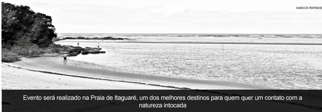
Evento será realizado na Praia de Itaguapé, um dos melhores destinos para quem quer um contato com a natureza intocada

Evento, voltado a pessoas com deficiência, será realizado em parceria com o Parque Estadual Restinga de Bertioga (Perb)