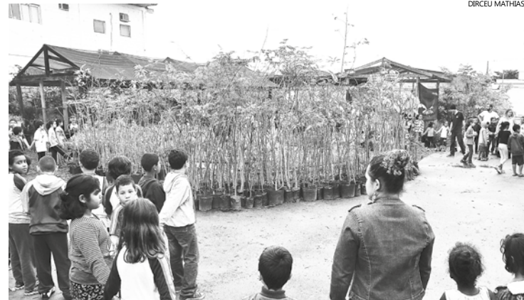
Ao término da programação serão servidos bolo e água aromatizada aos participantes, que finalizarão o evento cantando parabéns para o Viveiro de Plantas, em clima de muita festa

Festejos serão realizados na quarta-feira (1º), com a inauguração do 'Minimuseu de Animais Taxidermizados' e a realização de oficinas de plantas, compostagem e cultivo de abelhas