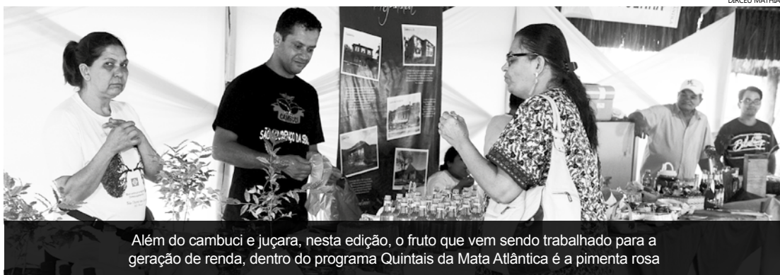
Além do cambuci e juçara, nesta edição, o fruto que vem sendo trabalhado para a geração de renda, dentro do programa Quintais da Mata Atlântica é a pimenta rosa

Durante o festival, que integrará cultura, arte e conservação da Mata Atlântica, visitantes também poderão saborear delícias do bioma de floresta tropical