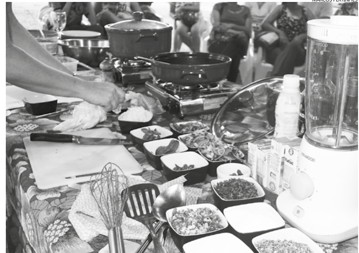
Além do cambuci e do juçara, um novo ingrediente foi escolhido pela Secretaria de Meio Ambiente para ser trabalhado durante o festival – a aroeira pimenteira

No Festival da Mata Atlântica visitantes poderão degustar e adquirir produtos à base de frutos nativos de produtores locais e regionais. Já está confirmada a presença de produtores de Salesópolis, Mogi das Cruzes, Ribeirão Preto, Paranapiacaba, Paraibuna e São Lourenço da Serra - municípios integrantes da Rota Gastronômica do Cambuci, criada pelo Instituto Auá de Empreendedorismo Social.