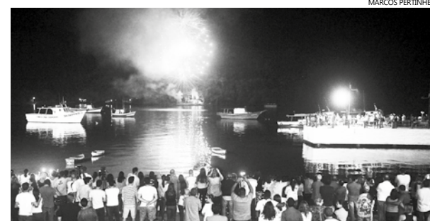
Milagre das Luzes: um dos momentos mais marcantes e emocionantes das homenagens a São José de Anchieta

Programação inclui, também, saídas do Barco Escola Arca do Saber para a Ermida de Santo Antônio do Guaibê