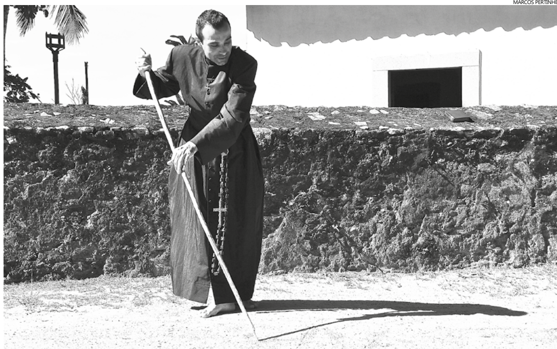
Na Ermida, um ator estará interpretando Anchieta, declamando as poesias do santo

Serão dois dias de comemorações, que vão envolver toda a comunidade em atividades que representam a passagem do Padre Anchieta pela região, em especial Bertioga e Guarujá. A relíquia será trazida até o Forte São João de barco, da Ermida de Santo do Guaibê, no município