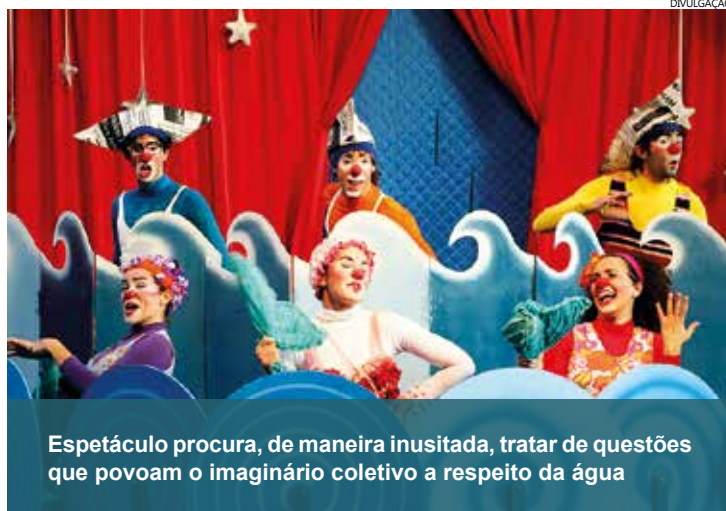
Espectáculo procura, de maneira inusitada, tratar de questões que povoam o imaginário coletivo a respeito da água

Próxima Companhia, em parceria com o Clã-Estudios das Artes Cômicas e direção de Cida Almeida.