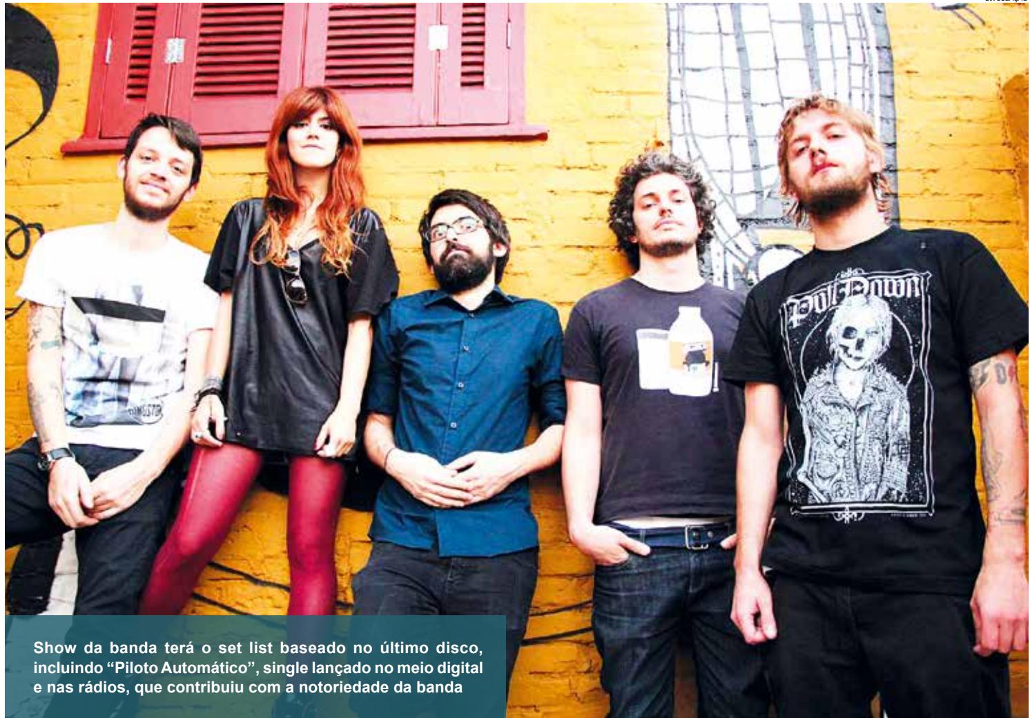
Show da banda terá o set list baseado no último disco, incluindo “Piloto Automático”, single lançado no meio digital e nas rádios, que contribuiu com a notoriedade da banda

Como parte das atividades de aniversário, neste domingo (22) tem atração teatral, com o espetáculo ‘Água, D’A