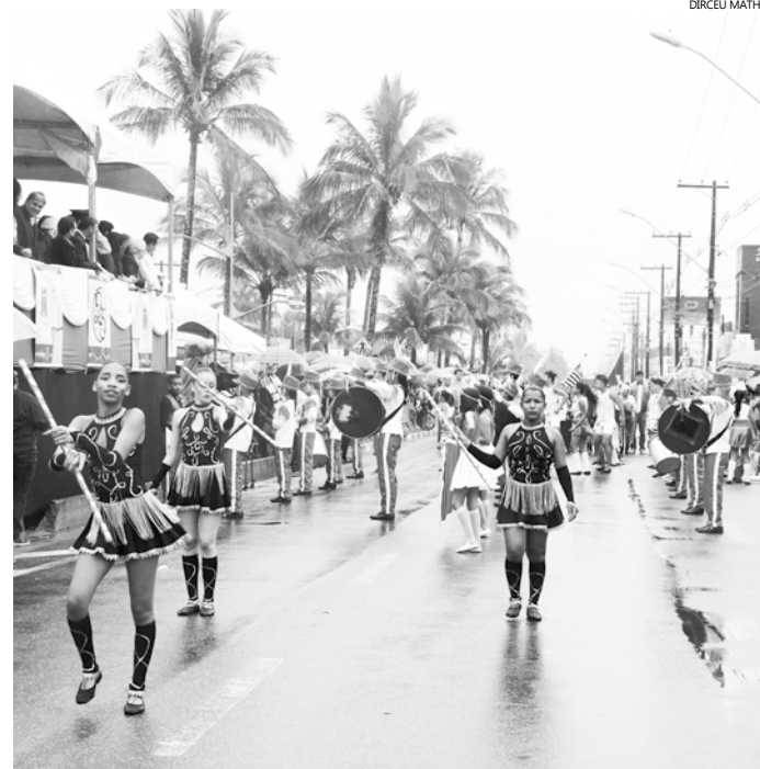
Destacando o tema '25 anos de Emancipação', desfile mostrou a trajetória de Bertioga, desde que foi emancipada do município de Santos

A GCM de Bertioga é referência no trabalho de segurança com respeito ao cidadão, atuando fortemente no apoio às polícias Militar e Civil. A instituição é formada por homens e mulheres que têm a busca pela proteção do cidadão como vocação. Com esse processo, Bertioga será a segunda cidade da Região Metropolitana da Baixada Santista a contar com guardas civis armados. A primeira é Praia Grande.