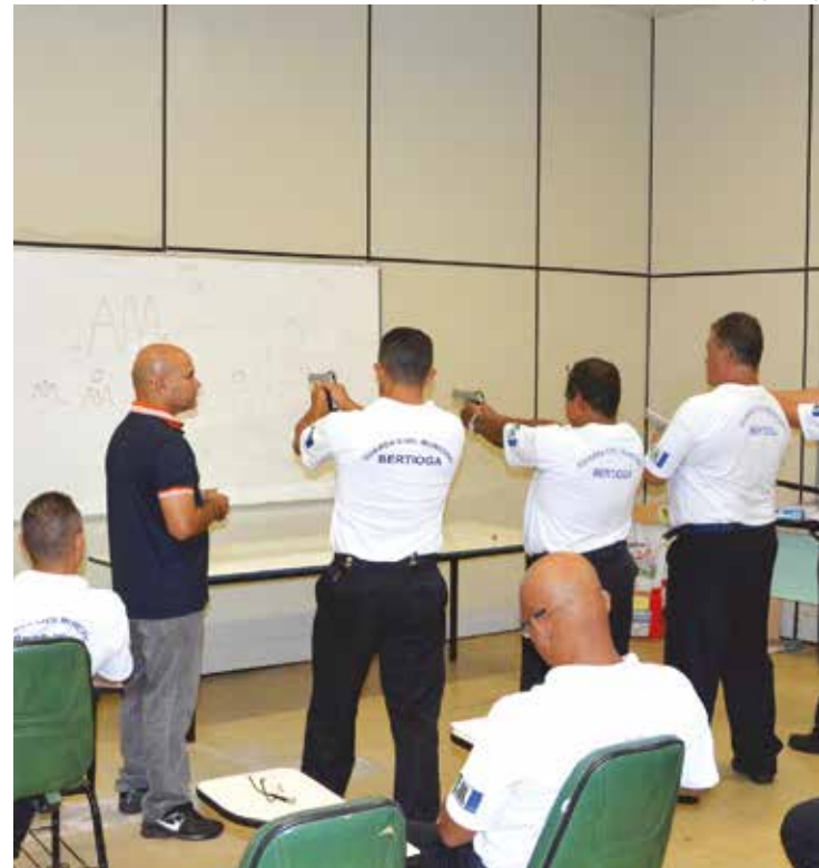
Recentemente, agentes passaram por treinamento visando o armamento da corporação