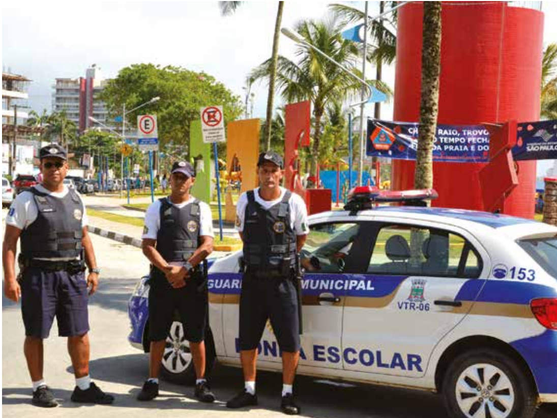
Frota da GCM conta com seis viaturas, sendo duas delas utilizadas na Ronda Escolar; e um ônibus, usado para o transporte dos guardas a treinamentos e cursos, e trabalhos sociais

Pensando em dar melhores condições de trabalho para os agentes da Guarda Civil Municipal (GCM) e do setor de Veículos de Fiscalização de Fretamento (SEVEF), a Secretaria de Segurança de Bertioga está viabilizando a aquisição de cinco novos veículos. A compra depende da aprovação do Conselho Municipal de Segurança Pública (Comsegur), que vai deliberar, no próximo dia 17, a utilização da verba do Fundo Municipal de Segurança Pública (Funseg).