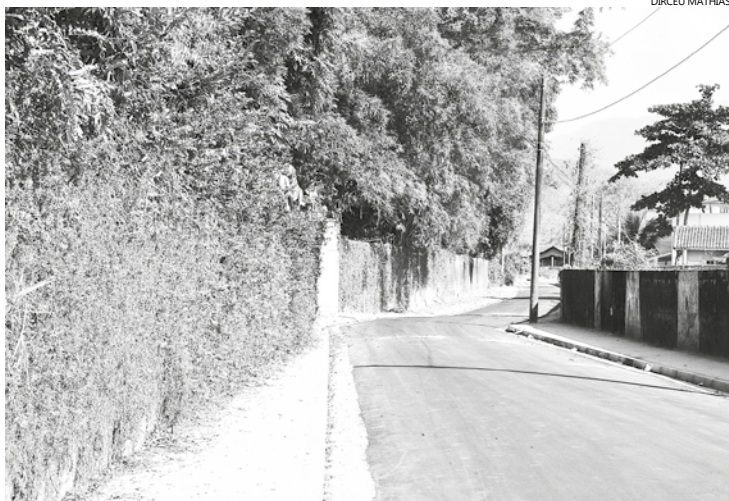
Uma das ruas asfaltadas na última semana foi a Caminho São Lino, no Centro - via tradicional de Bertioga, que dá acesso ao Morro da Senhorinha

Enquanto algumas vias aguardam a remessa de asfalto, outras já recebem drenagem, guia e sarjeta. São cinco frentes no Centro e uma no Maitinga