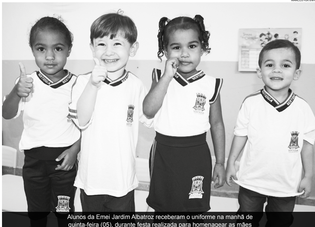
Alunos da Emei Jardim Albatroz receberam o uniforme na manhã de quinta-feira (05), durante festa realizada para homenagear as mães

Entre as 17 unidades, que já receberam os uniformes, está a Emei Jardim Albatroz, que atualmente conta com 202 alunos. A unidade distribuiu os kits na manhã de quinta-feira (05), durante a festa em homenagem as mães. Cada kit contém duas camisas e duas bermudas, sendo uma delas bermuda-saia.