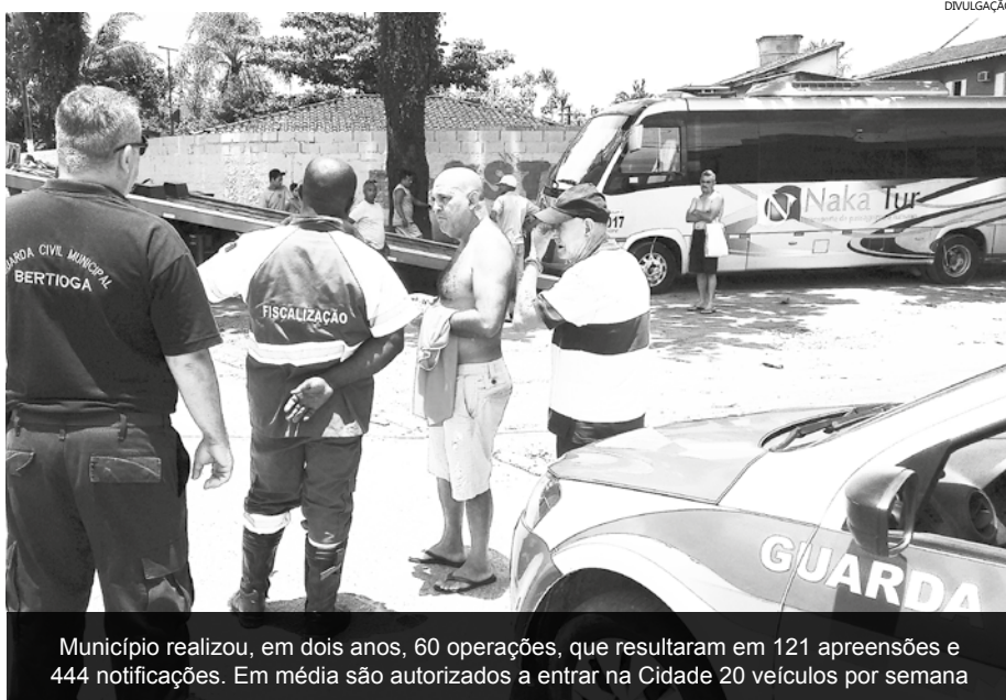
Município realizou, em dois anos, 60 operações, que resultaram em 121 apreensões e 444 notificações. Em média são autorizados a entrar na Cidade 20 veículos por semana

Em dois anos, a municipalidade liberou a entrada de mais de 3.600 veículos, com base na Lei nº 117/2015, que visa garantir a segurança da população e dos turistas