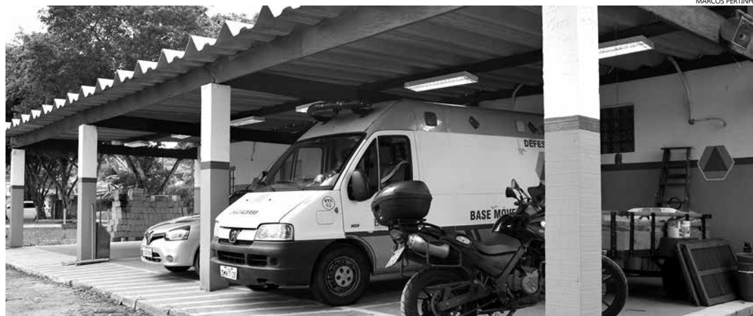
Unidade tem cerca de 240 m 2 de área construída em um terreno de, aproximadamente 1.500m 2 , que dispõe de grande área de lazer, onde será possível desenvolver os projetos sociais da corporação

A Defesa Civil de Bertioga atende no número 199.