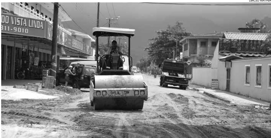
Como a rua já conta com rede de água e esgoto, com a conclusão da drenagem, a via poderá receber guia, sarjeta e pavimentação

A Rua Nicolau Miguel Obeid, na Vista Linda, recebeu serviços de drenagem e colocação de bica corrida. O serviço, realizado pela Secretaria de Serviços Urbanos, foi concluído esta semana e representa uma antiga reivindicação de moradores e comerciantes, uma vez que a via ficava alagada em períodos chuvosos.