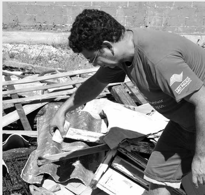
Em Bertioga, só este ano (de janeiro até o momento) já foram registrados 37 casos positivos de dengue

O bairro de Vista Linda recebe neste sábado (02) e domingo (03), das 9 às 13 horas, o mutirão de combate ao Aedes aegypti - mosquito transmissor da dengue, febre chikungunya e o zika vírus. A ação, realizada pela Prefeitura de Bertioga, por meio da Secretaria de Saúde, vai contar com a participação dos agentes de controle de endemias da Coordenadoria de Vetores e Dengue de Bertioga e dos profissionais do Programa Saúde