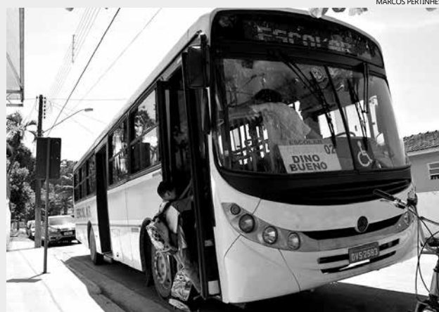
As novas medidas começaram a ser adotadas a partir de fevereiro, com a implantação de seis linhas em quatro escolas

O novo sistema de transporte escolar de Bertioga já está atendendo quase a metade das unidades escolares do Município. São ônibus adaptados, com cinto de segurança em todas as poltronas, assento reservado para os monitores, apenas uma porta, faixa reflexiva e identificação, garantindo mais segurança e conforto para as crianças.