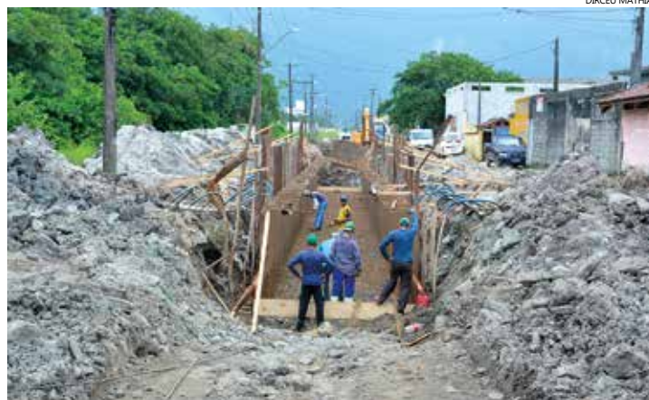
Rua Manoel Gajo está recebendo uma galeria de macrodrenagem com 377 metros no trecho entre a Rodovia Rio-Santos e a Rua Ayrton

de Bertioga, a Rua Manoel Gajo, no Centro, já passa por intervenções. A via está recebendo uma galeria de macrodrenagem com 377 metros no trecho entre a Rodovia Rio-Santos e a Rua Ayrton Senna, executada em concreto pré-moldado, com 2,90 metros de largura e 2 metros de profundidade. Os primeiros 40 metros foram concretados esta