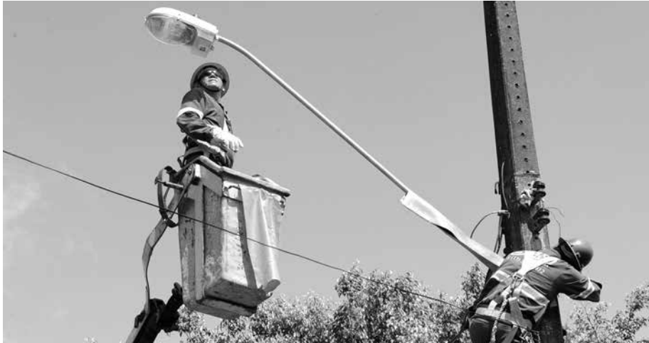
Serviços já foram licitados e o próximo passo será a celebração de contrato entre a Administração Municipal e a empresa Brasiluz Eletrificação e Eletrônica, vencedora da licitação

Através da Contribuição de Iluminação Pública (CIP), criada em Bertioga, em junho 2013, a Prefeitura, por meio da Diretoria de Gestão e Energia – vinculada à Secretaria de Serviços Urbanos, vem avançando significativamente, com a instalação de pontos de energia e, agora, chega a mais duas novas etapas, que contemplam a instalação de 181 luminárias e 133 postes