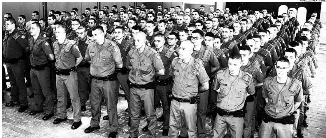
Aumento do efetivo policial para atuar na Operação Verão – mais de 280 homens, foi um dos fatores responsáveis pela redução significativa de ocorrências na Cidade

Durante a Operação Verão, no mês de janeiro, Bertioga teve queda significativa nos índices de criminalidade, em relação ao mesmo período do ano passado. Apesar dos números ainda preocuparem a população, houve uma redução nos casos de roubo, roubo de veículos