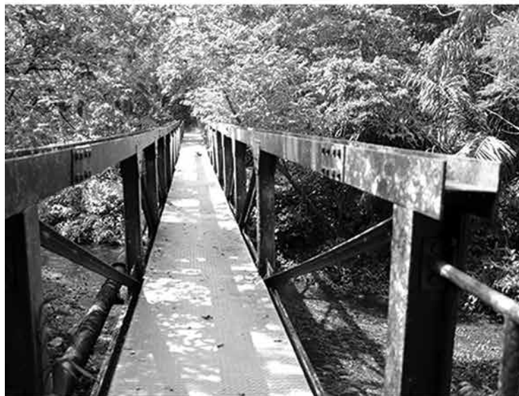
Restinga da Praia

A relação das agências está no site: bertioga.sp.gov.br/ecoturismo .