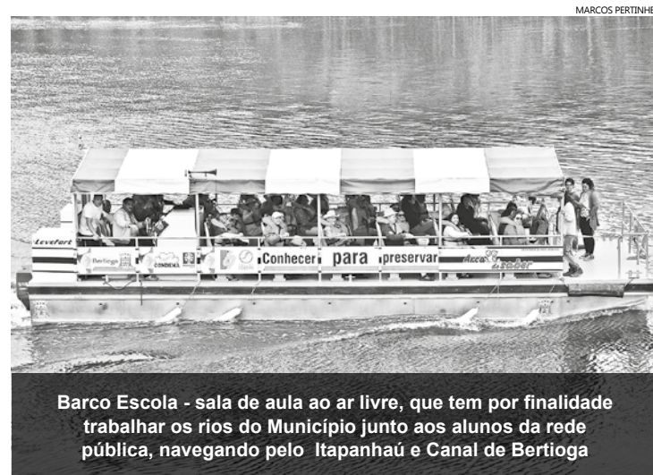
Barco Escola - sala de aula ao ar livre, que tem por finalidade trabalhar os rios do Município junto aos alunos da rede pública, navegando pelo Itapanhaú e Canal de Bertioga