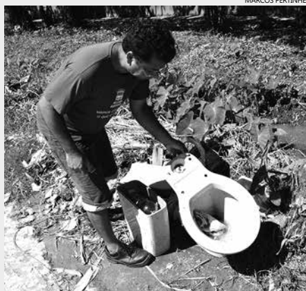
Um total de 525 candidatos se inscreveu para o processo seletivo