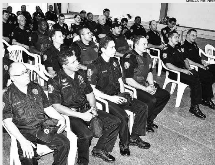
GCM de Bertioga conta com 87 agentes efetivos. Desse total, 66% estão aptos para uso e porte de arma de fogo

O processo para o armamento da Guarda Civil Municipal (GCM) está em fase final. Entre os próximos dias 08 e 10 e dia 14, a última turma de GCMs estará participando das aulas teóricas e práticas do curso de Capacitação e Armamento de Tiro, que será realizada na sala anexa à Secretaria de Educação, no Paço Municipal (Rua Luiz Pereira de Campos, 901 – Centro), das 8h às 17 horas. Bertioga será a segunda cidade da região Metropolitana da Baixada Santista a contar com guardas civis armados. A primeira é Praia Grande.