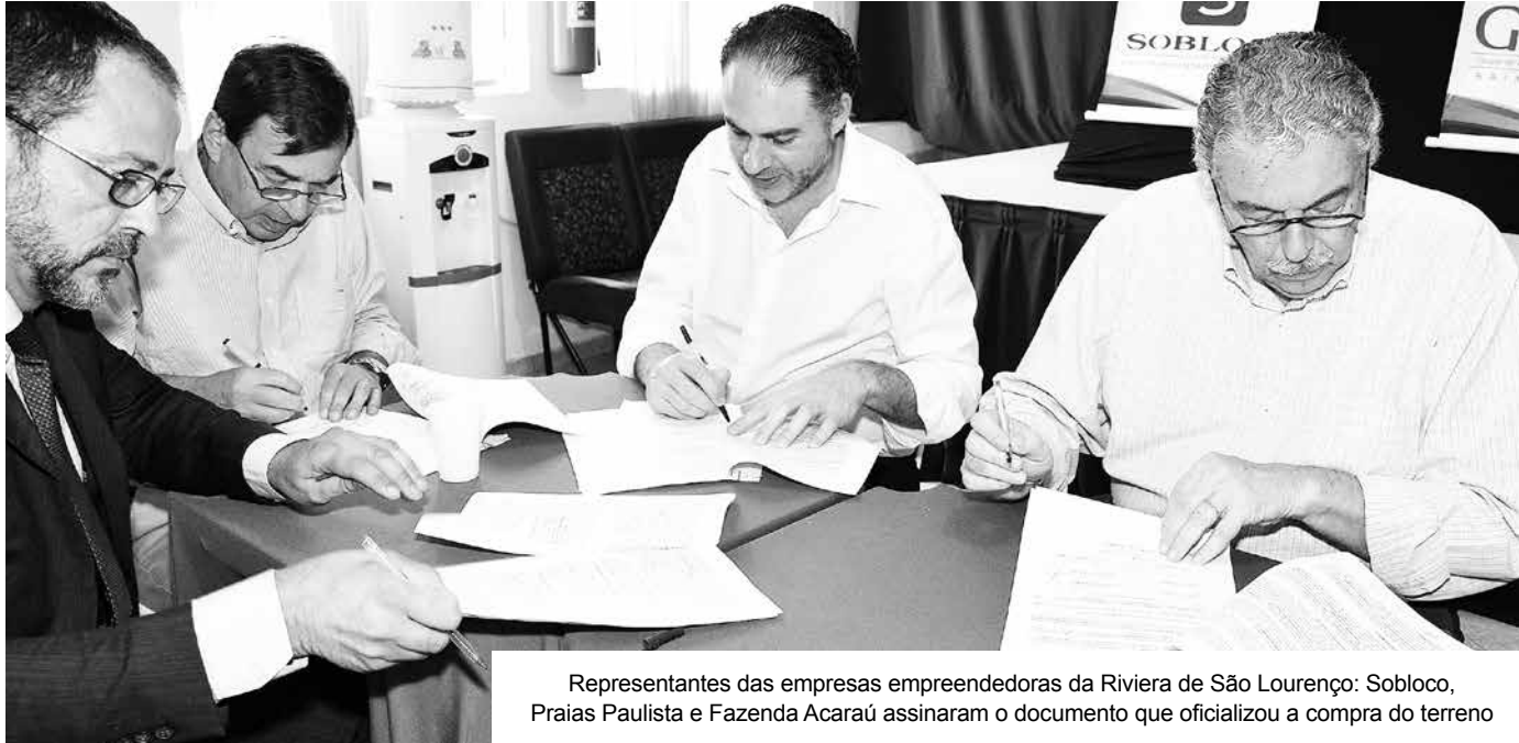
Representantes das empresas empreendedoras da Riviera de São Lourenço: Sobloco, Praias Paulista e Fazenda Acaraú assinaram o documento que oficializou a compra do terreno

As tratativas para a construção de um Centro Comunitário de Esportes e Lazer no Bairro Chácaras, onde atualmente encontra-se a Vila Militar avançam. Na segunda-feira (29), foi formalizada a aquisição do terreno de 27.500 m 2 , localizado no quilômetro 216 da SP-55 (Rodovia Rio-Santos).