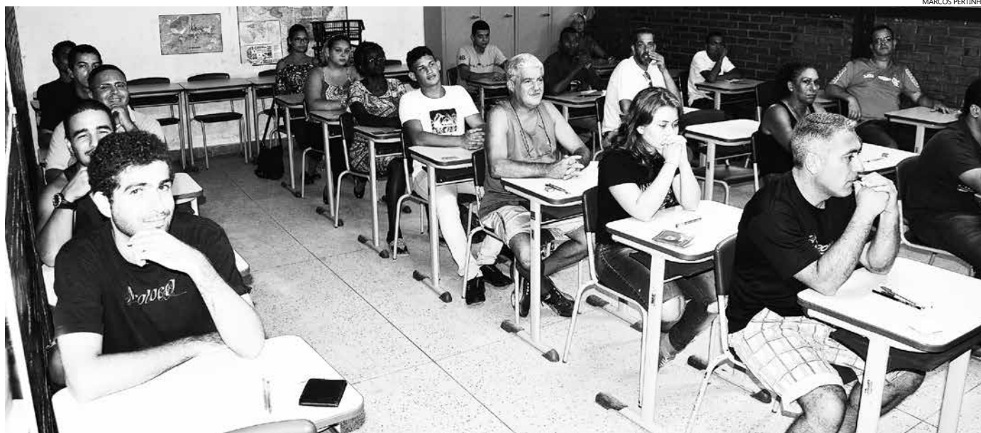
Um total de 525 candidatos se inscreveu para o processo seletivo. Selecionados vão atuar junto com as equipes, em ações de combate ao mosquito Aedes aegypti

A Prefeitura de Bertioga divulga nesta segunda-feira (07), o resultado do processo seletivo para contratação de Agente de Endemias. Para consultar, basta acessar o site www.bertioga.sp.gov.br/processo-seletivo-simplificado-012016 . O gabarito das provas também já está disponível no site desde terça-feira (01).