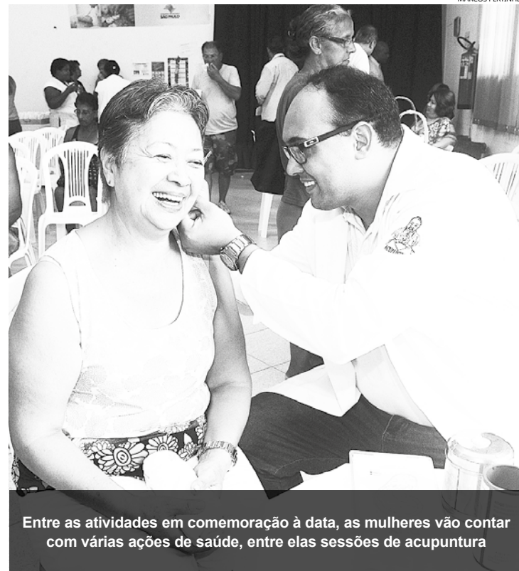
Entre as atividades em comemoração à data, as mulheres vão contar com várias ações de saúde, entre elas sessões de acupuntura

O Fundo Social de Solidariedade está localizado na Rua Walter Pereira Prado, 77 - Centro.