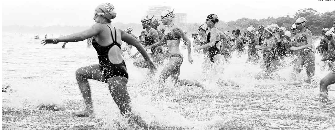
Mais de 250 atletas são esperados para a segunda etapa da competição, que vai acontecer no Cantão do Indaiá

Amantes da natação e de esportes em mar aberto têm até o dia 14 de março para se inscreverem na 2ª etapa do Circuito TH5 de Travessias Aquáticas 2016. Mais de 250 atletas são esperados para a competição, que acontece no próximo dia 20, a partir das 9 horas, no Cantão do Indaiá. As inscrições, com valor da taxa de acordo com cada categoria, podem ser feitas pelo site www.th5eventos.com.br .