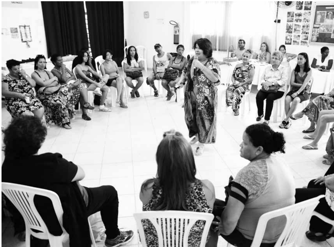
A toda edição do evento acontece o tradicional 'Fala Mulher' – momento de reflexão e integração com a plateia

Para comemorar o Dia Internacional da Mulher, celebrado em 08 de março, o Conselho Municipal dos Direitos da Mulher (CMDM) está preparando uma extensa programação destinada ao público feminino do Município. O evento será realizado das 14h às 17h30, no salão do Fundo Social de Solidariedade, com palestras, cortes de cabelo, ações de saúde, 'Dia da Beleza' e com o tradicional 'Fala Mulher' - momento de reflexão e integração com a plateia.