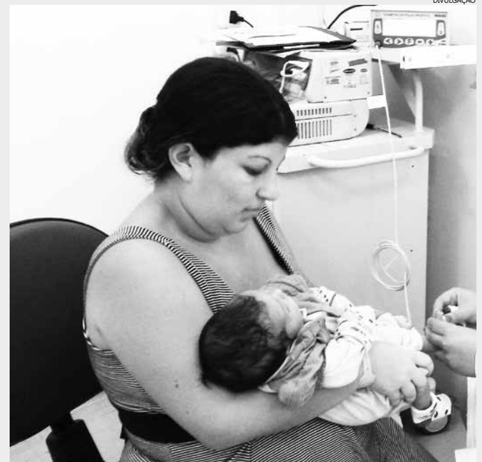
Procedimento é simples, rápido e indolor, e consiste em medir a oxigenação do sangue e os batimentos cardíacos do recém-nascido com o auxílio de um oxímetro