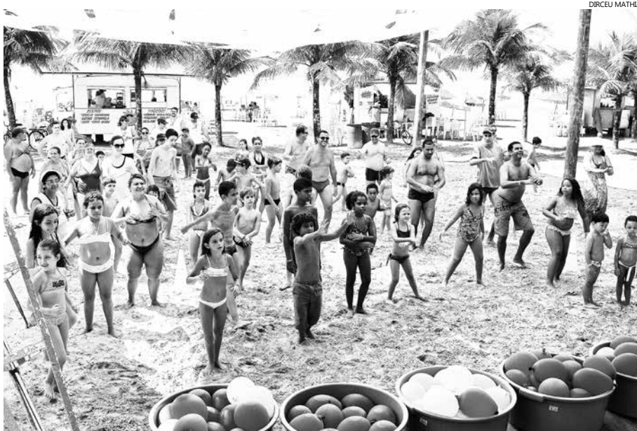
A proposta é sensibilizar as pessoas para a importância da inclusão do esporte e da atividade física no dia a dia

Norteadas pelo tema “Qual o Esporte que te Move?”, a programação do Sesc Verão 2016 será encerrada neste domingo (28). A iniciativa vem sendo realizada desde janeiro pela rede de unidades do Sesc