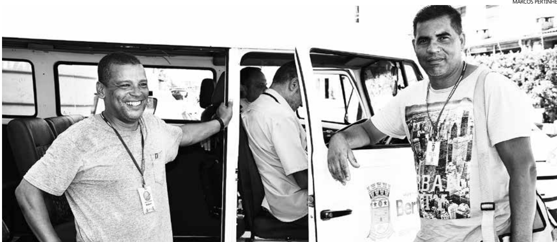
Selecionados vão atuar junto aos agentes da Coordenadoria de Vetores e Dengue, nas ações de combate ao Aedes aegypti , no Município

Com 525 candidatos inscritos para 17 vagas, as provas do processo seletivo destinado à contratação de Agente de Combate a Endemias, em Bertioga, acontece neste domingo (28), a partir das 9 horas. As provas serão aplicadas em três escolas municipais: Emeif Professor José Inácio Hora (Rua Rodrigues Alves, 759/Centro), Emeif Giusfredo Santini (Rua Epiphânio Batista, 66/Jardim Vicente de Carvalho) e Emeif Professor Delphino Stockler de Lima (Avenida Manoel da Nóbrega, s/nº/Centro).