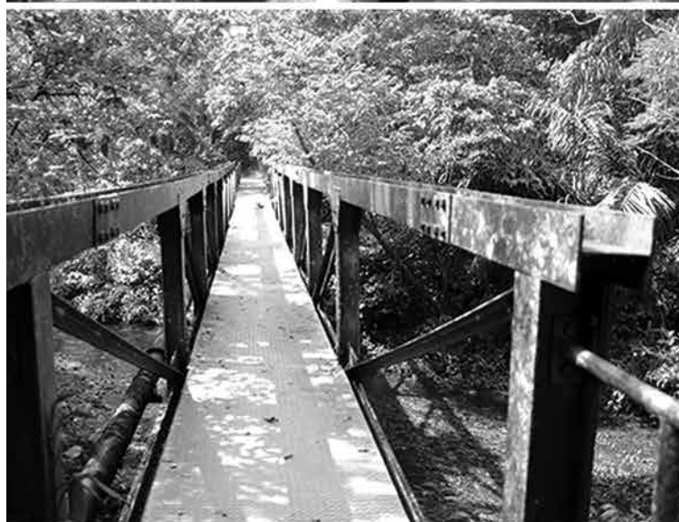
Restinga da EA

A relação das agências está no site: bertioga.sp.gov.br/ecoturismo .