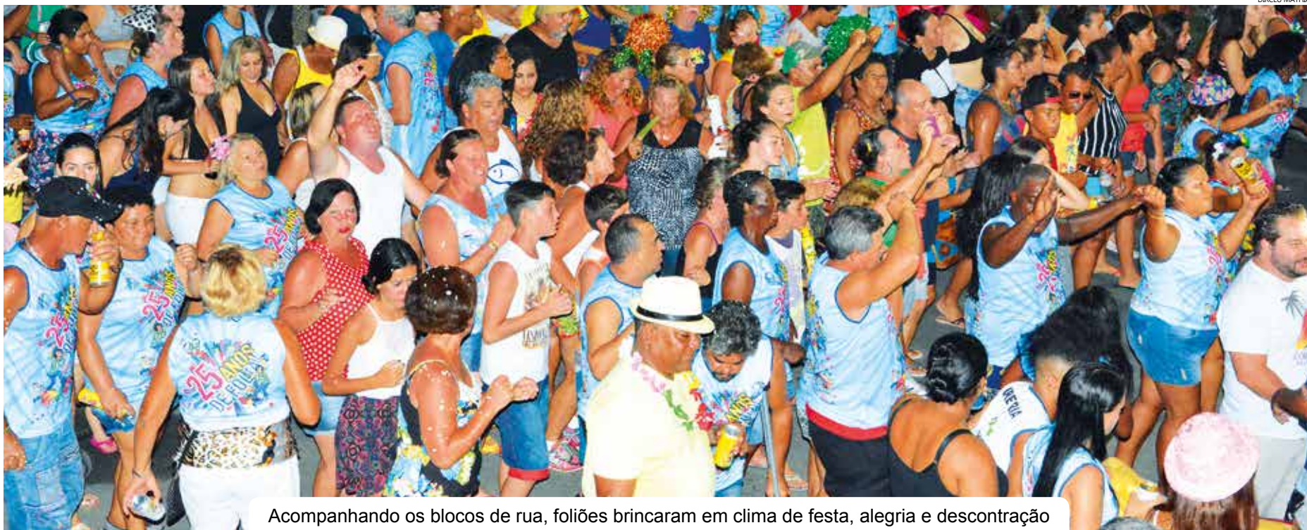
Acompanhando os blocos de rua, foliões brincaram em clima de festa, alegria e descontração

A temporada de verão 2015/2016 foi marcada pela tranquilidade e por diversas atrações culturais e esportivas, e foi encerrada com sucesso pelo Carnaval, que nos cinco dias de folia atraiu cerca de 70 mil foliões para os locais onde aconteceram as atrações. De janeiro até o Carnaval, pelo menos 500 mil pessoas, vindas de vários pontos do país e até do exterior, passaram por Bertioga para prestigiar a temporada e a festa mais popular do mundo.