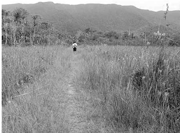
Restinga de Brito