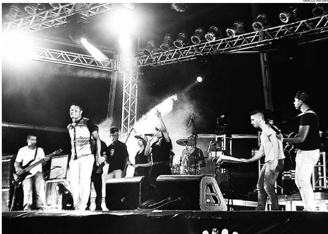
Quinze cantores e 20 bandas participam e disputam o título do festival, cuja final acontece neste sábado

Além das disputas pelo título do festival, também acontece a apresentação da