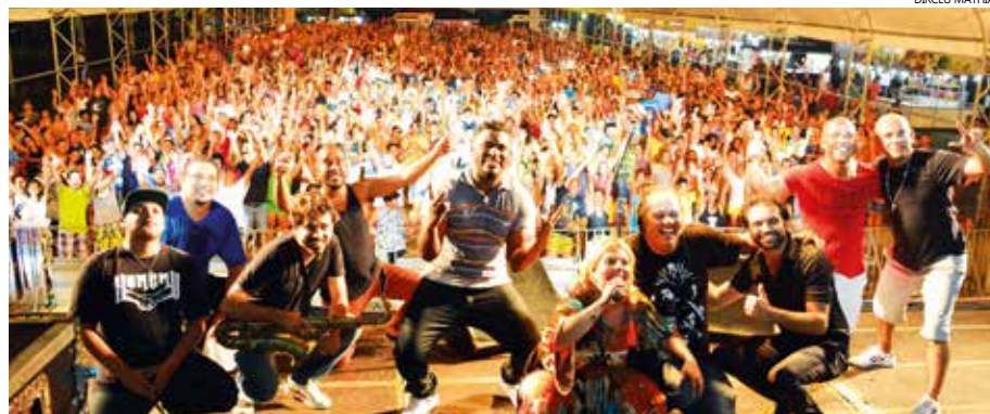
Público lotou a Praça de Eventos nos finais de semana de janeiro para prestigiar as atrações do Verão Azul. Na foto a Banda Black Rio, que fez tributo a Tim Maia