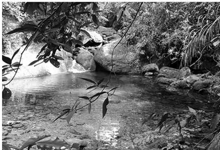
Restinga de Brito