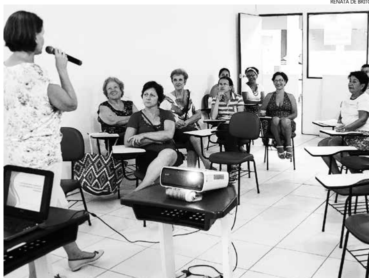
Oficina Participativa em Boracéia – um dos bairros onde foram apresentadas demandas culturais da Cidade para a construção do Plano Municipal

O Plano estabelece metas e ações para o setor de cultura da Cidade, que serão desenvolvidas como políticas de Estado e está em consonância com a Lei Federal nº 12.343/2014, que criou o Plano Nacional de Cultura (PNC), que tem por finalidade o planejamento