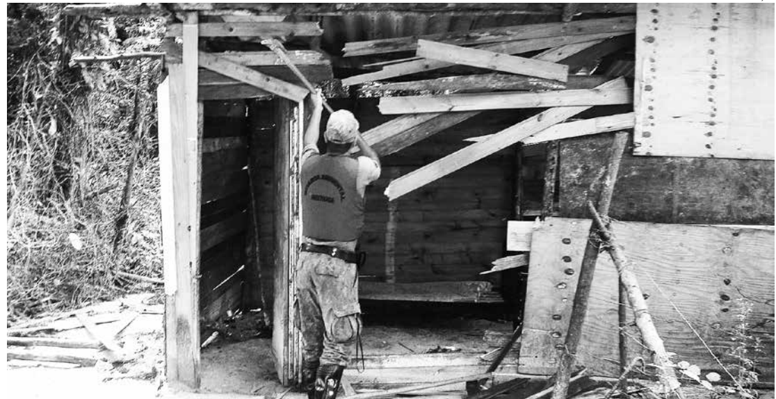
A DOA atua constantemente no combate a ocupações irregulares. Em 2015 foram demolidas 32 subconstruções

A infinidade na natureza das ocorrências impressiona: captura de abelhas (22), retirada de cercas de arame (42), orientações