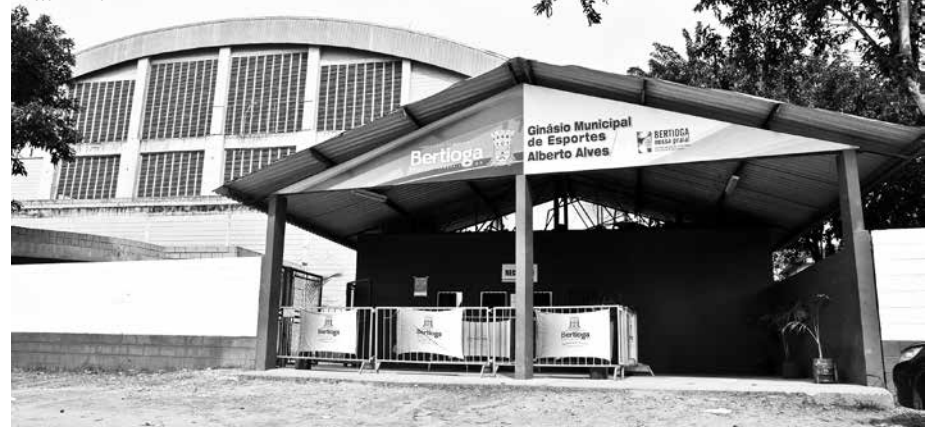
O Ginásio Municipal de Esportes Alberto Alves mantém escolinhas com 16 modalidades esportivas

quatro modalidades esportivas, entre elas, o Surf, Caminhada, Stand up Paddle e Canoagem.