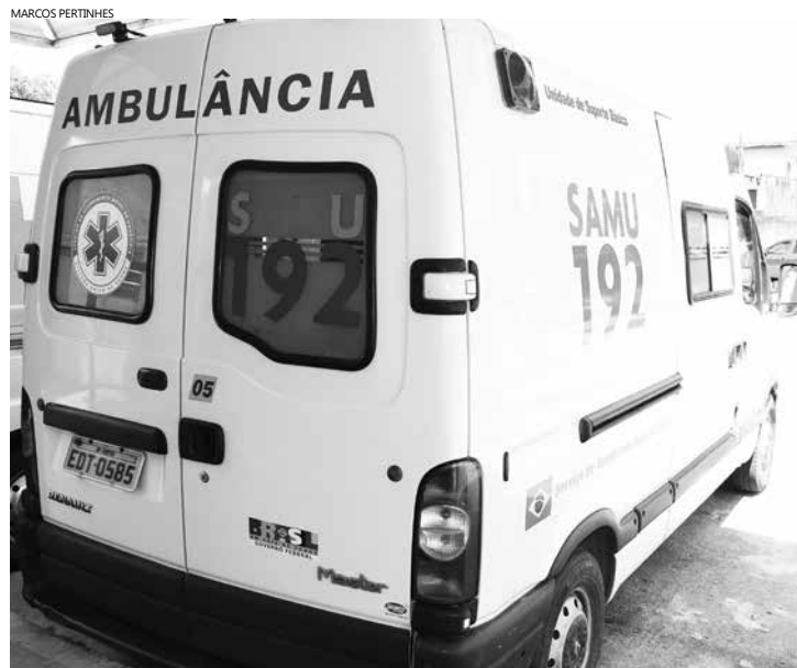
A proposta é desenvolver o projeto Samuzinho a cada seis meses no Município

Outras questões também serão abordadas durante o desenvolvimento do projeto como dicas à prevenção de acidentes, noções básicas de primeiros socorros, combate