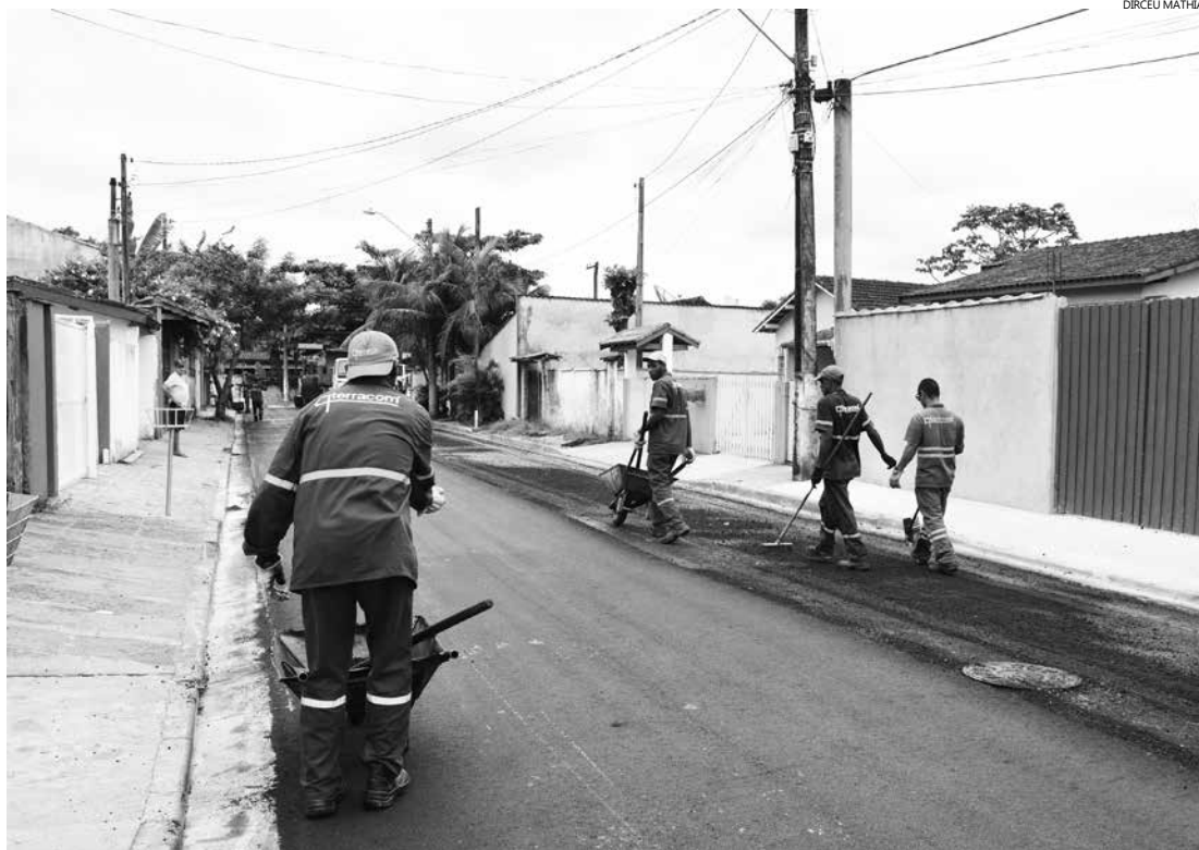
As ruas já foram pavimentadas e abertas para circulação de veículos

A obra é executada em trechos por questões logísticas. Nesse quadrilátero que contempla as sete ruas, o serviço já está concluído. A próxima etapa da obra nessas sete ruas será a execução da sinalização vertical (placas de trânsito) e