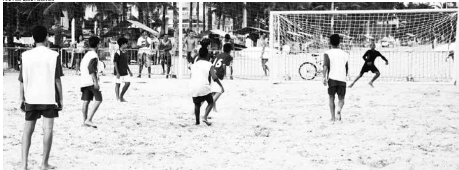
Meninos do 'Futuros', categoria sub-14, deram um chocolate de 08x02 no Cruz Vermelha

Esta semana, a rede balançou na Taça Cidade de Bertioga de Beach Soccer Verão 2016. Quem assiste aos jogos, está presenciando a revelação de grandes atletas no Município. Em quatro dias, foram 130 gols, que movimentaram as areias da Praia da Enseada (Centro).