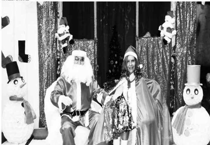
A novidade deste ano é o casal simpático, Papai e Mamãe Noel, que estará recepcionando os visitantes com muita alegria e presentes surpresas

os responsáveis pela Casa. O horário de atendimento é de segunda a sexta-feira, das 10 às 17 horas.