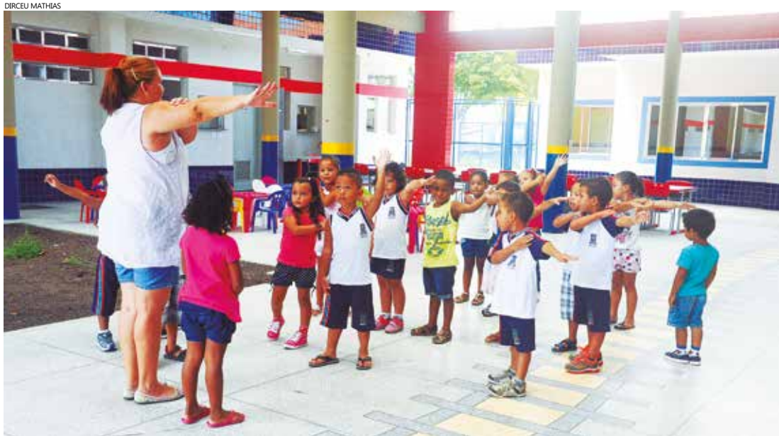
Entre a Educação Infantil e creches, o Município atende, atualmente 3.248 alunos

Bertioga se compromete a abrir mais mil vagas em creches no prazo máximo de três anos. Compromisso foi firmado esta semana, quando o prefeito do Município, o secretário de Educação, e o 1º Promotor de Justiça, Diogo Pacini de Medeiros e Albuquerque assinaram Termo de Ajustamento de Conduta (TAC), proposto pelo Ministério Público e se comprometeram a adotar todas as medidas administrativas necessárias para viabilizar a construção de creches ou a