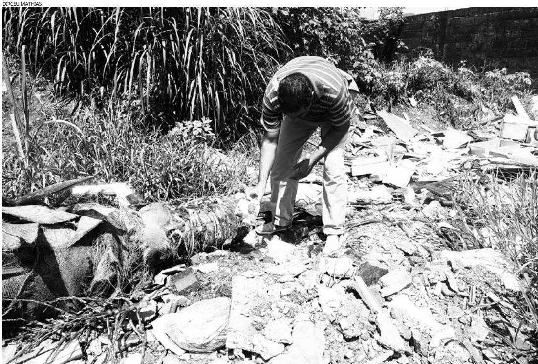
Agentes da dengue atuam nos locais de focos com o propósito de evitar que o mosquito se prolifere

Este ano, as ações preventivas aumentaram por causa da febre chikungunya e do zika vírus, ambos transmitidos pelo Aedes aegypti