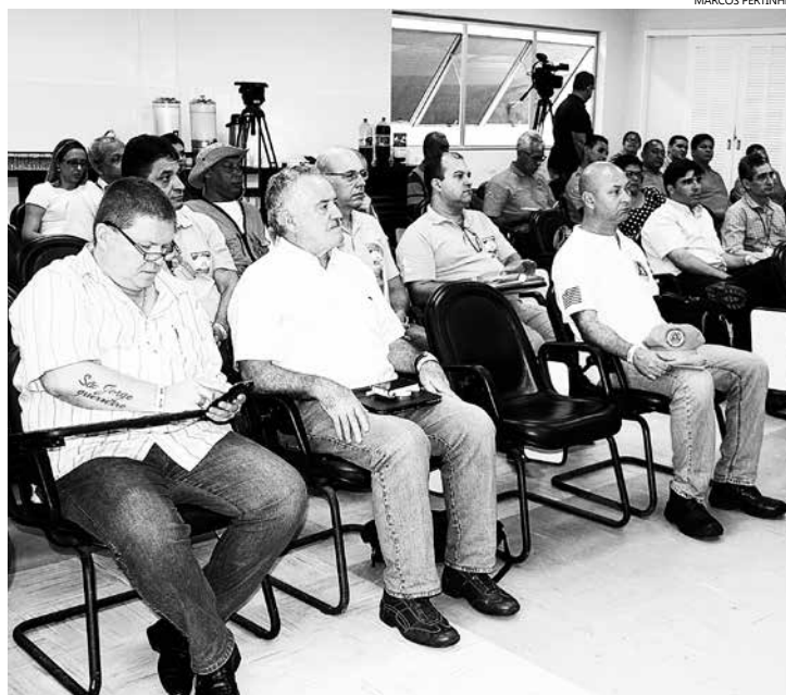
Município sediou, no Sesc Bertioga, o Curso de Operacionalização do PPDC, que reuniu as unidades de Defesa Civil dos municípios da Região Metropolitana da Baixada Santista

“Temos que ficar atentos aos boletins meteorológicos. No início do ano, registramos 12 mortes, no Estado de São Paulo, sendo cinco delas em Praia Grande. De 2014 a 2015, foram 77 mortes por raio. Por isso, algumas dicas, como evitar ficar