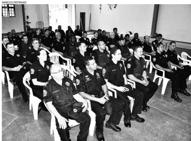
Atualmente, o Município conta com 87 agentes efetivos. Desse total, 66% estão aptos para uso e porte de arma de fogo

A Guarda Civil Municipal (GCM) de Bertioga estará armada a partir de fevereiro de 2016. A Prefeitura do Município homologou a contratação de empresa para prestação de serviços visando ministrar o Curso em Armamento Profissional e Tiro Policial de Calibre Permitido, que começa nesta segunda-feira (07). O curso tem duração de 12 dias. Atualmente, o Município conta com 87 agentes efetivos. Desse total, 66% estão aptos para uso e porte de arma de fogo