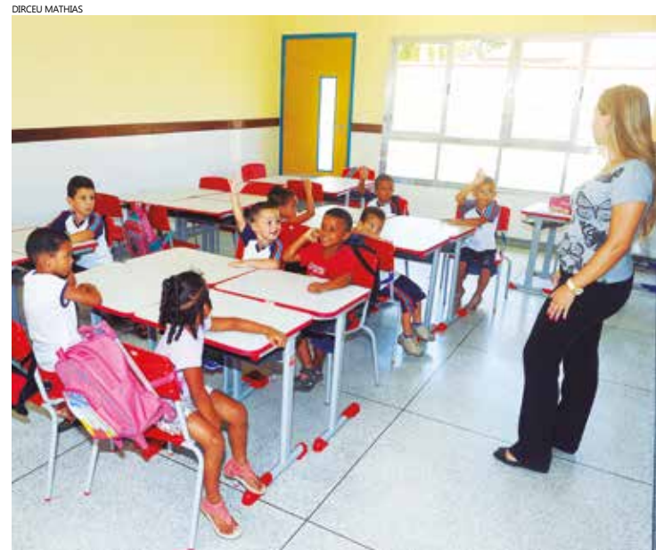
Bertioga conta com 08 Núcleos de Educação Infantil Municipal (Neims). O déficit oficial de vagas no Município é de 979 vagas

“Educação é prioridade em nosso governo”, diz o prefeito, lembrando que do compromisso firmado nesse TAC já estão