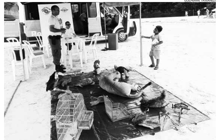
Tanto em Itaguapé (foto), quanto em Guaratuba, será montada uma barraca com exposição de animais taxidermizados (empalhados), existentes na fauna de Bertioga

A Operação Verão da Secretaria de Meio Ambiente conta com apoio da Fundação Florestal (FF), Guarda Civil Ambiental e Diretoria de Trânsito.