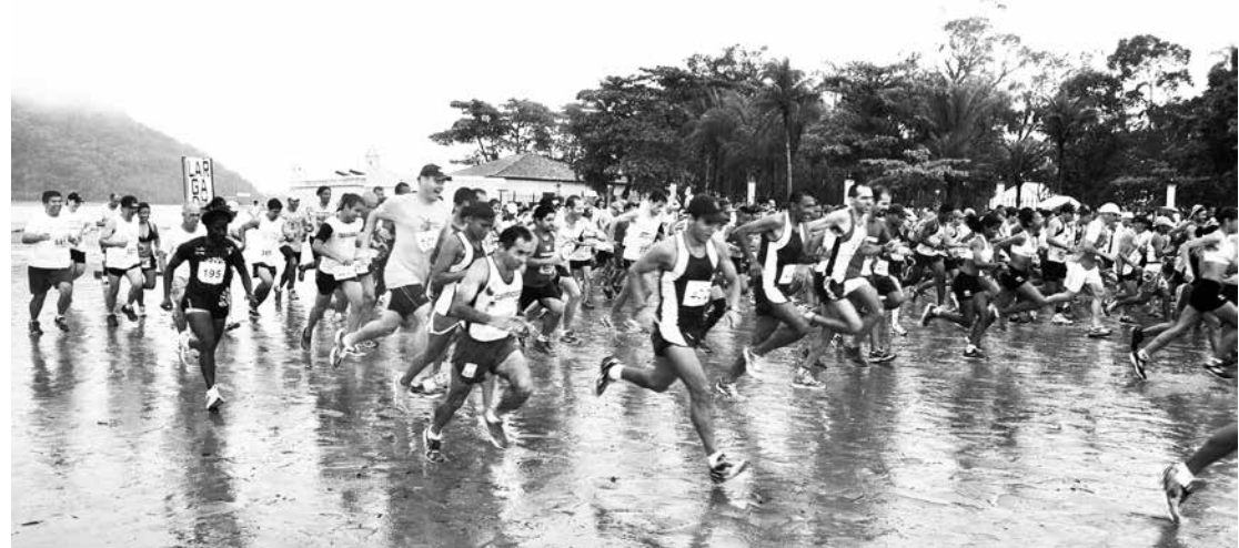
Cerca de 300 atletas devem participar da competição que contará com percursos de 10 e 05 km