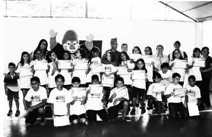
Alunos dos colégios particulares Objetivo (Boracéia) e Saber receberam seus certificados na última segunda-feira (02), em solenidade realizada no Colégio Saber