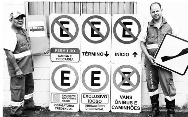
As placas são de advertência e de regulamentação e serão instaladas nas principais vias da Cidade

Com a aquisição dos três veículos 'Saveiro', a Diretoria de Trânsito vai disponibilizar para a Guarda Civil Municipal (GCM) dois veículos Ford Courier para apoio das atividades da GCM. Atualmente a frota da Diretoria é composta de sete automóveis e cinco motocicletas.