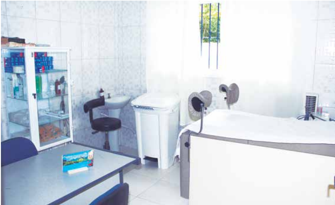
Projetos foram executados conforme preconiza o Ministério da Saúde, por meio do programa Requalifica UBS

As Unidades Básicas de Saúde (UBSs) de Bertioga acabam de passar por reforma e ampliação, dando mais um passo na melhoria do atendimento e na qualidade dos serviços prestados à população. Os equipamentos estão preparados para receber novos serviços, como a implantação de unidades de farmácias e da Estratégia da Saúde da Família (ESF).