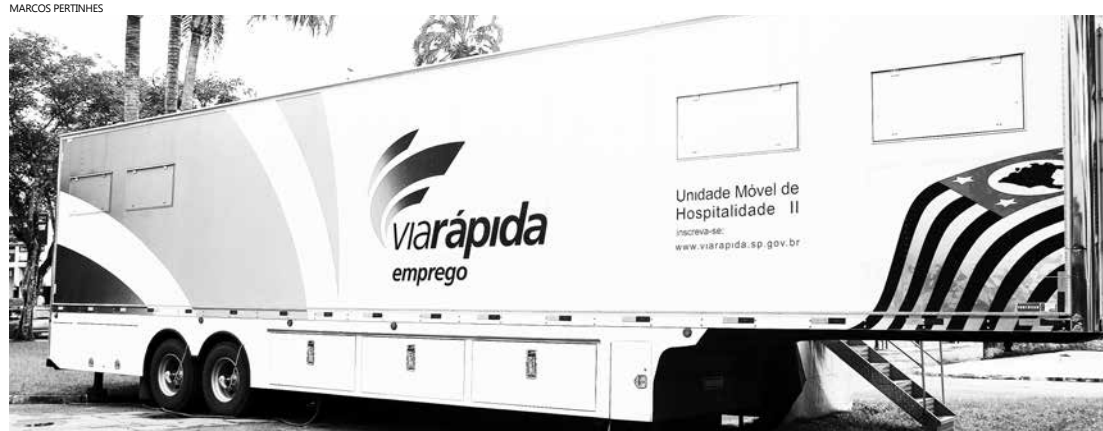
As aulas serão ministradas no interior da carreta, que já está estacionada em frente ao Espaço Cidadão-Centro

São disponibilizados os cursos de barman , garçom e camareira, sendo 20 vagas para cada curso. As inscrições devem ser realizadas somente pela internet ( www.viarapida.sp.gov.br ). Após o preenchimento da ficha de inscrição, o Via Rápida envia um telegrama e em seguida o interessado deve ir até o Espaço Cidadão-Centro para efetivar a inscrição.