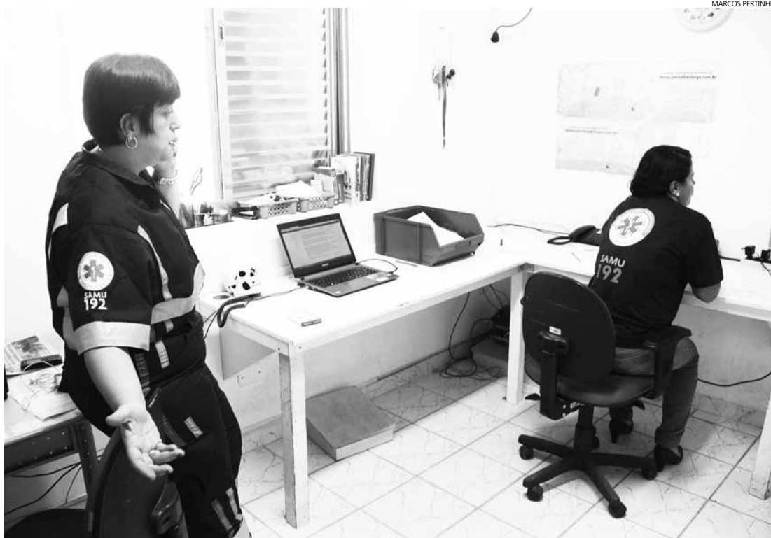
Samu vai ensinar as crianças sobre os procedimentos corretos em situações de emergência