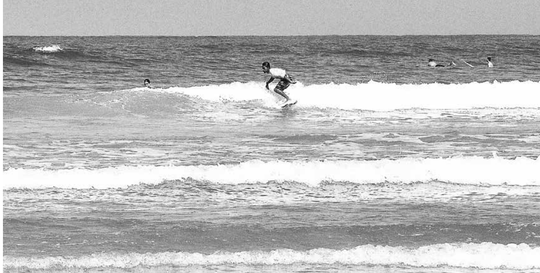
Primeira etapa do circuito aconteceu em abril deste ano, na Praia da Enseada, no Centro

A Praia de Boracéia, em Bertioga, recebe neste sábado (21) e domingo (22), a 3ª e última etapa do Circuito Bertioga 2015 de Surf – uma realização da Oficina de Atletas,