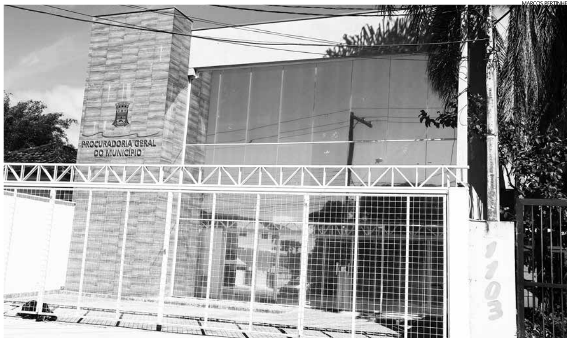
Novo espaço tem papel fundamental na estruturação jurídica do Município

Espaço, que está localizado na Avenida Anchieta, 1091- Centro vai garantir mais qualidade e agilidade nos serviços da PGM