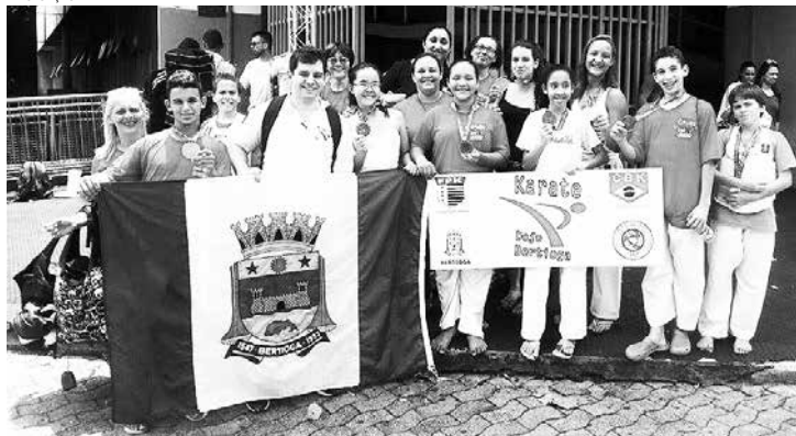
Alunos da Escolinha Dojo Bertioga de Karatê, no último sábado (14), no Ginásio do Ibirapuera, em São Paulo

O esporte de Bertioga está em festa. Isso porque, alunos da Escolinha Dojo Bertioga de Karatê, conquistaram expressivas colocações na Copa dos Campeões do Estado de São Paulo, que aconteceu no último sábado (14), no Ginásio do Ibirapuera, em São Paulo. No total, foram oito medalhas, sendo quatro de ouro, duas de prata e duas de bronze.