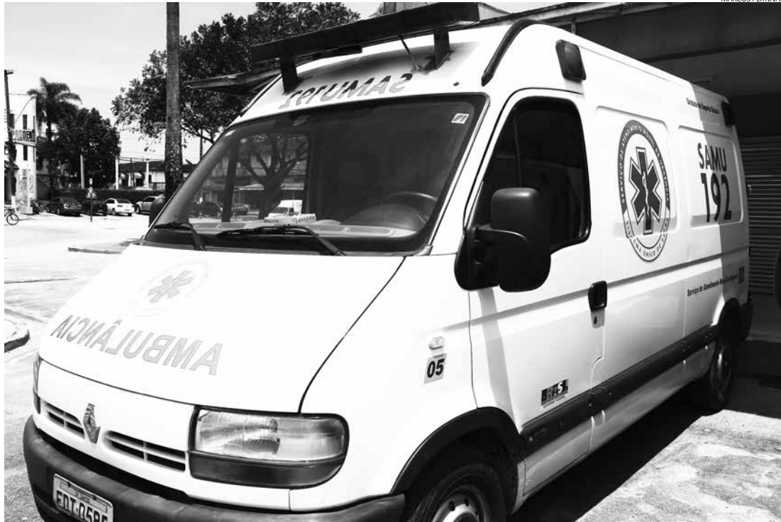
Projeto Samuzinho vai explicar o que é e para que serve o Samu, para 150 crianças da rede municipal de ensino

Outras questões também serão abordadas durante o desenvolvimento do projeto como dicas à prevenção de acidentes, noções básicas de primeiros socorros, combate à dengue e prejuízos do trote. Isso, após um estudo do governo federal verificar que um número maior de trotes acontecia no intervalo das escolas