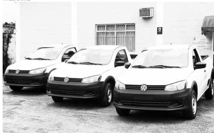
Veículos serão usados nos serviços de fiscalização, sinalização e campanhas de educação no trânsito. Atualmente a frota da Diretoria conta com sete automóveis e cinco motos

As primeiras 1.300 placas que já chegaram, começam a ser implantadas nas vias da Cidade nos próximos dias. Algumas irão substituir aquelas que estão danificadas.