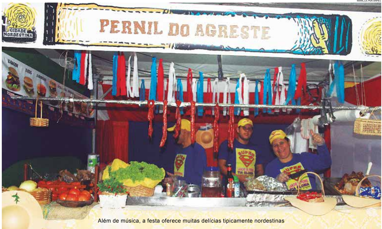
Além de música, a festa oferece muitas delícias tipicamente nordestinas