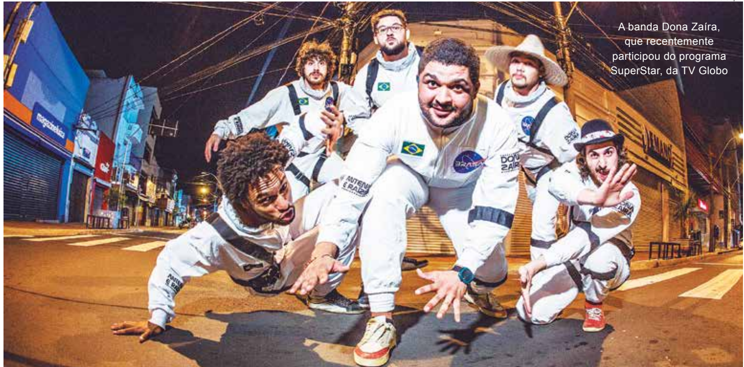
A banda Dona Zaira, que recentemente participou do programa SuperStar, da TV Globo

A Praça de Eventos está localizada na Avenida Thomé de Souza – Praia da Enseada, ao lado do Forte São João (Centro). O acesso ao local é livre.