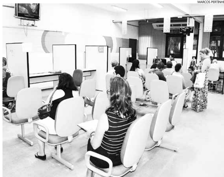
O atendimento ao contribuinte é de segunda a sexta-feira, das 9 às 16 horas, e com plantão aos sábados, no mesmo horário

A falta de pagamento de qualquer das parcelas do Refis nos respectivos vencimentos sujeitará o contribuinte à multa moratória de 0,1667% por dia de atraso, a partir do primeiro dia seguinte ao vencimento, limitada a 10%. Será considerado rescindido o acordo de pagamento parcelado no caso de atraso de qualquer parcela por mais de 90 dias e atraso de três parcelas, consecutivas ou não. A rescisão independe de qualquer aviso ou notificação.