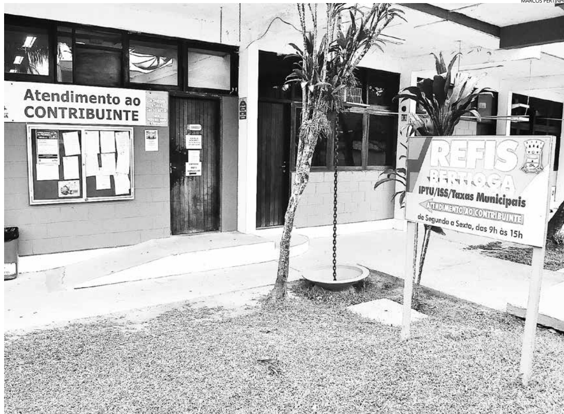
Interessados deverão requerer a adesão, diretamente no Setor de Atendimento ao Contribuinte, no Paço Municipal, localizado na Rua Luiz Pereira de Campos, 901, Centro

Quem optar por pagar a dívida à vista contará com 85% de desconto nos juros e multa. Para quem preferir parcelar, as opções são seis parcelas, com 75% de desconto; de sete a 18 parcelas, com 60% de desconto; de 19 a 30 parcelas, com 50% de