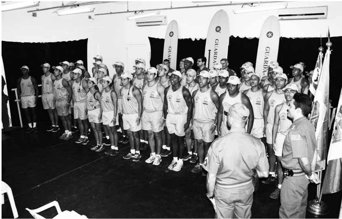
Guarda-vidas temporários ajudarão a atender a demanda da temporada de verão, junto com os 40 bombeiros efetivos do GBMar, no período de 01 de dezembro a 10 de fevereiro