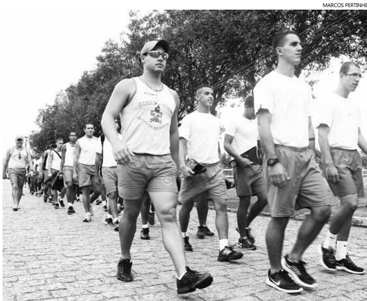
Curso recebeu a inscrição de 65 candidatos, que participaram de treinamentos, envolvendo técnicas de natação, primeiros socorros, salvamento e resgate no mar

O curso recebeu a inscrição de 65 candidatos, que participaram de treinamentos, envolvendo técnicas de natação, primeiros socorros, salvamento e resgate no mar. Os testes aconteceram neste mês de