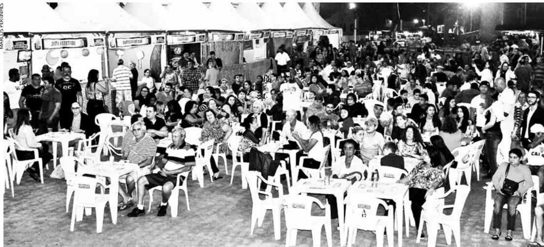
No primeiro fim de semana de festa, cerca de três mil pessoas prestigiaram o evento que segue até o próximo dia 15, na Praça de Eventos

Além do fim de semana, evento acontece também nesta segunda-feira (02) - feriado de Finados, na tenda montada na Praça de Eventos, ao lado do Forte São João