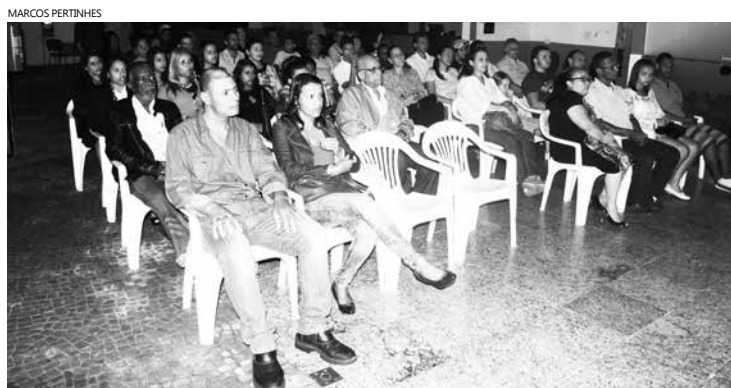
Alunos foram acompanhados de familiares e amigos, que prestigiaram com muito orgulho o evento

Formatura dos alunos dos cursos de Atendimento e Recepção e de Eletricista de Autos aconteceu na terça-feira (27)