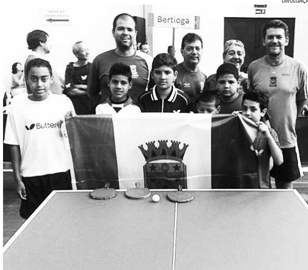
Equipe voltou de duas competições trazendo mais medalhas para o Município

Na 5ª etapa do Ranking da Baixada Santista, que aconteceu no feriado do