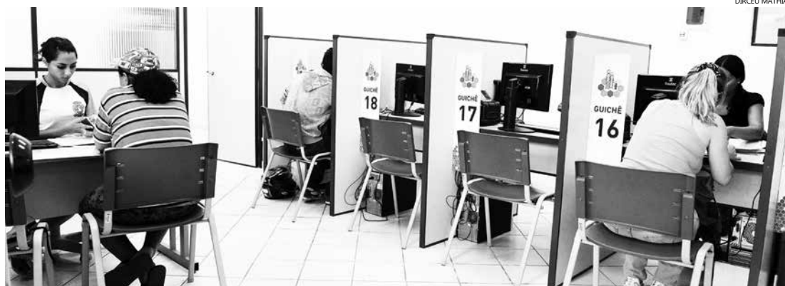
o PAT também faz o cadastramento de pessoas que procuram por uma vaga de emprego

Para isso, basta o comerciante se cadastrar no sistema do programa Mais Emprego, da Secretaria Estadual do Emprego e Relações do Trabalho, disponibilizando a vaga e o interesse na contratação. O cadastro não tem custo nenhum e pode ser realizado por telefone