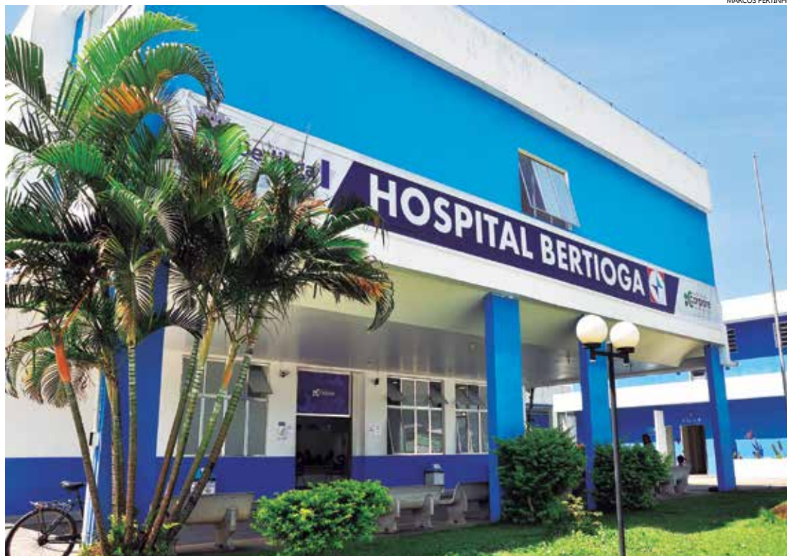
Novo prédio abrigará 31 leitos femininos e 31 masculinos, 18 para ginecologia e obstetrícia, 12 para pediatria, 10 para hospital dia, e 10 leitos de UTI

Comemorando mais essa conquista, o prefeito de Bertioga ressalta que a ampliação do hospital se traduz em um importante investimento na saúde. “Vamos, com isso, melhorar ainda mais a qualidade de atendimento, que é o pilar da nossa Administração. Além disso, estamos investindo em novos equipamentos, a exemplo