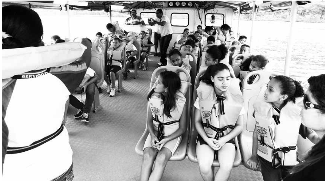
Atividade visou conscientizar e ensinar os alunos sobre a importância e a preservação do manguezal. Ação atendeu à diretiva de Educação Ambiental (EA7) do Município Verde Azul

A ação aconteceu nas áreas de manguezais entre os dois municípios. Intitulada 'Conhecer para preservar', a iniciativa foi coordenada pela equipe do Barco Escola – Arca do Saber e contou com a participação dos alunos do 5º ano da Escola Municipal Giusfredo Santini (Bertioga), que deram aula para os jovens da Unidade Municipal Judoca Ricardo Sampaio, localizada em