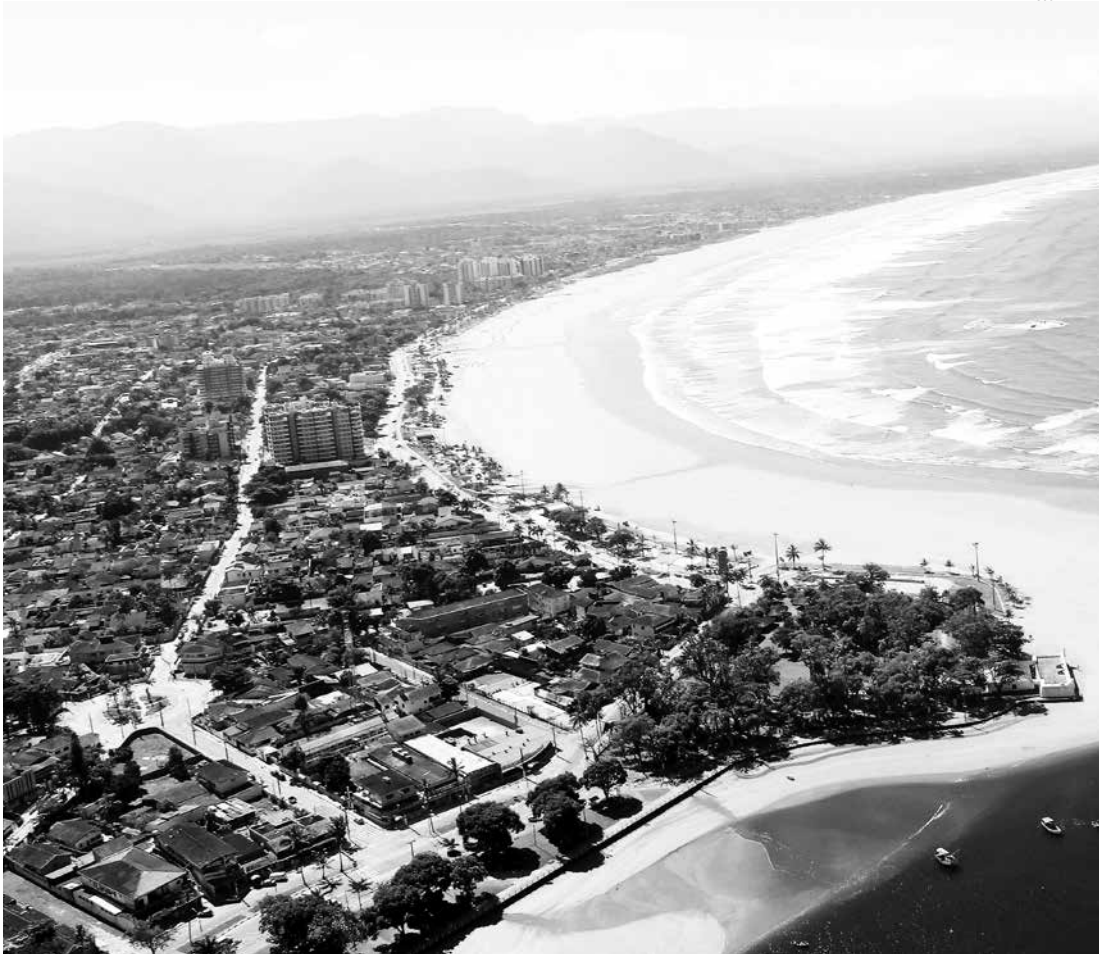
Em Bertioga, são 50 mil habitantes, que, no entendimento dos técnicos, três audiências seriam suficientes

O Município de Bertioga obteve liminar junto ao Tribunal de Justiça do Estado de São Paulo (TJ-SP) que garante a continuidade do Processo de Revisão do Plano Diretor de Desenvolvimento Sustentado (PDDS), iniciado pela Prefeitura de Bertioga em 2013.