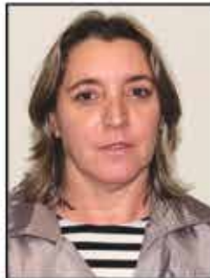
17 Rose de Boracéia