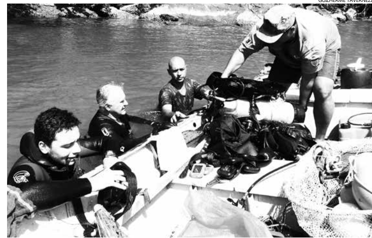
Vários resíduos marinhos foram retirados do fundo do mar pela equipe de mergulho, coordenada pela Diretoria de Operações Ambientais do Município

A ação às margens do Rio Itapanhaú, coordenada pelo diretor da DOA, foi realizada no domingo (20). Nessa ação, duas embarcações