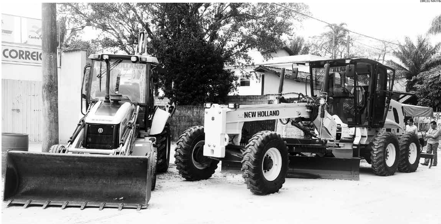
Equipamentos ficarão de forma definitiva no bairro, agilizando a realização dos serviços

Contrato de prestação de serviços contempla máquinas e operadores, desta forma, os equipamentos que estavam no bairro serão transferidos para o Indaiá, ampliando o atendimento