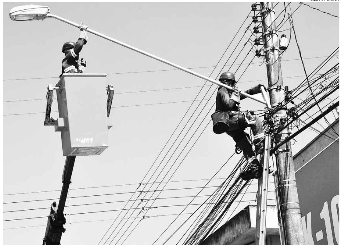
Na via foram substituídas 150 luminárias, nos dois lados da avenida

A Prefeitura de Bertioga também está substituindo as luminárias e as lâmpadas da Praça do Jardim Veleiros, no Centro. Estão sendo instaladas 18 luminárias, com lâmpadas de vapor metálico, mais modernas e resistentes, que vão proporcionar mais eficiência na iluminação.