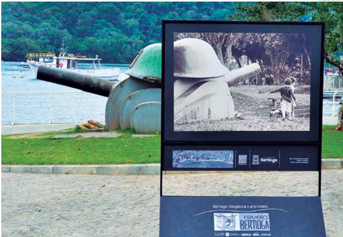
Monumentos, paisagens urbanas e natureza são algumas imagens que farão parte da exposição coletiva do Revela Bertioga, em outubro

Interessados devem enviar suas fotos, para apreciação da curadoria, a partir deste sábado (22). Na edição deste ano, o Revela Bertioga será realizado de 09 a 11 de outubro