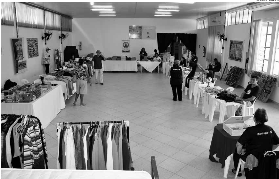
Alguns itens expostos eram fruto de trabalhos realizados durante os cursos promovidos pelo Fundo Social, enquanto outros são resultado de doações

Arrecadação, com a venda dos produtos, será revertida para aquisição de materiais utilizados em curso gratuitos