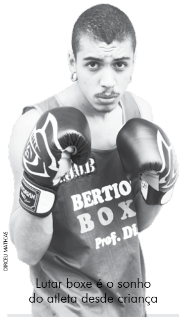
Lutar boxe é o sonho do atleta desde criança

As próximas competições acontecem em setembro com a Copa São Paulo de Karatê, e a Copa União dos Estilos que será realizada em Bertioga. Já em outubro cinco alunos da Escolinha irão a Joinville (SC) disputar as finais do Campeonato Brasileiro de Karate.