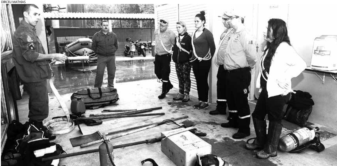
Com carga horária de 24 horas, o curso foi ministrado pela Base de Bombeiros de Bertioga - 6º GB, e dividido em aulas teóricas e práticas

Iniciativa aconteceu nos dias 21 e 22 e é válida como requisito para a certificação 'Município Verde Azul', da Secretaria Estadual do Meio Ambiente