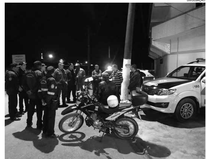
As operações resultaram em 23 veículos multados e um apreendido

“O resultado da operação foi bastante positiva. Temos recebido reclamações de moradores, que são incomodados com veículos que apresentam o volume de som muito acima do permitido durante os finais de semana. Assim, foi realizado um planejamento em conjunto com a Polícia Militar para que a fiscalização fosse executada”, comentou o secretário municipal de Segurança, lembrando que outras operações serão realizadas.