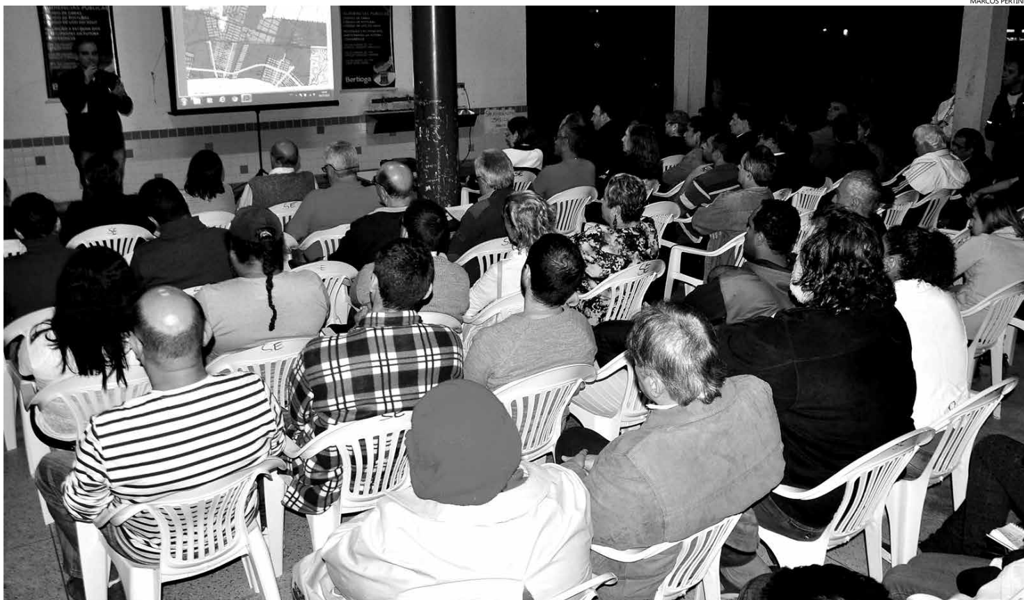
Ampla participação popular, que reuniu cerca de 1.400 pessoas, marcou as seis últimas audiências públicas realizadas na Cidade

Depois das seis audiências públicas realizadas com ampla participação popular, processo tem continuidade com a Conferência Pública, que será realizada no dia 10 de setembro