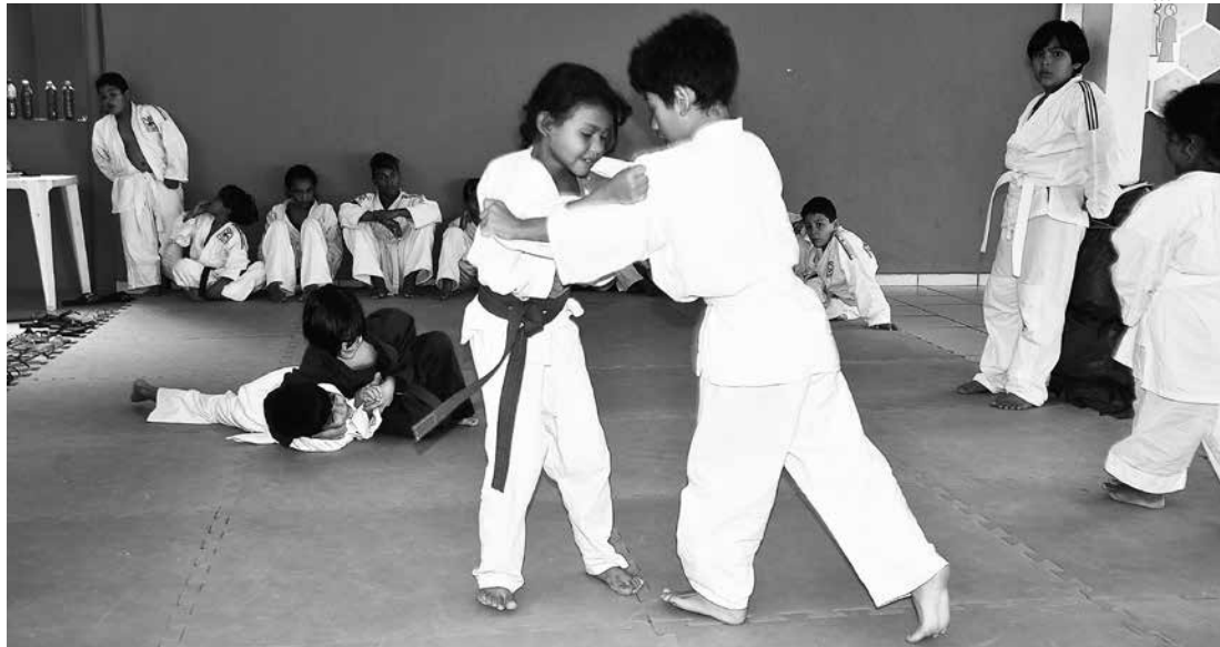
Uma das modalidades oferecidas no Polo Boracéia é o judô, para crianças com idade a partir de 06 anos

Em Bertioga, não tem desculpa para não praticar atividade física. De Boracéia ao Centro, a palavra de ordem é qualidade de vida e disposição. Só no Polo Cultural e Esportivo de Boracéia, que fica localizado no Espaço Cidadão, são oferecidas 10 modalidades esportivas gratuitas para a população. As atividades são destinadas para jovens com idade a partir dos 04 anos.