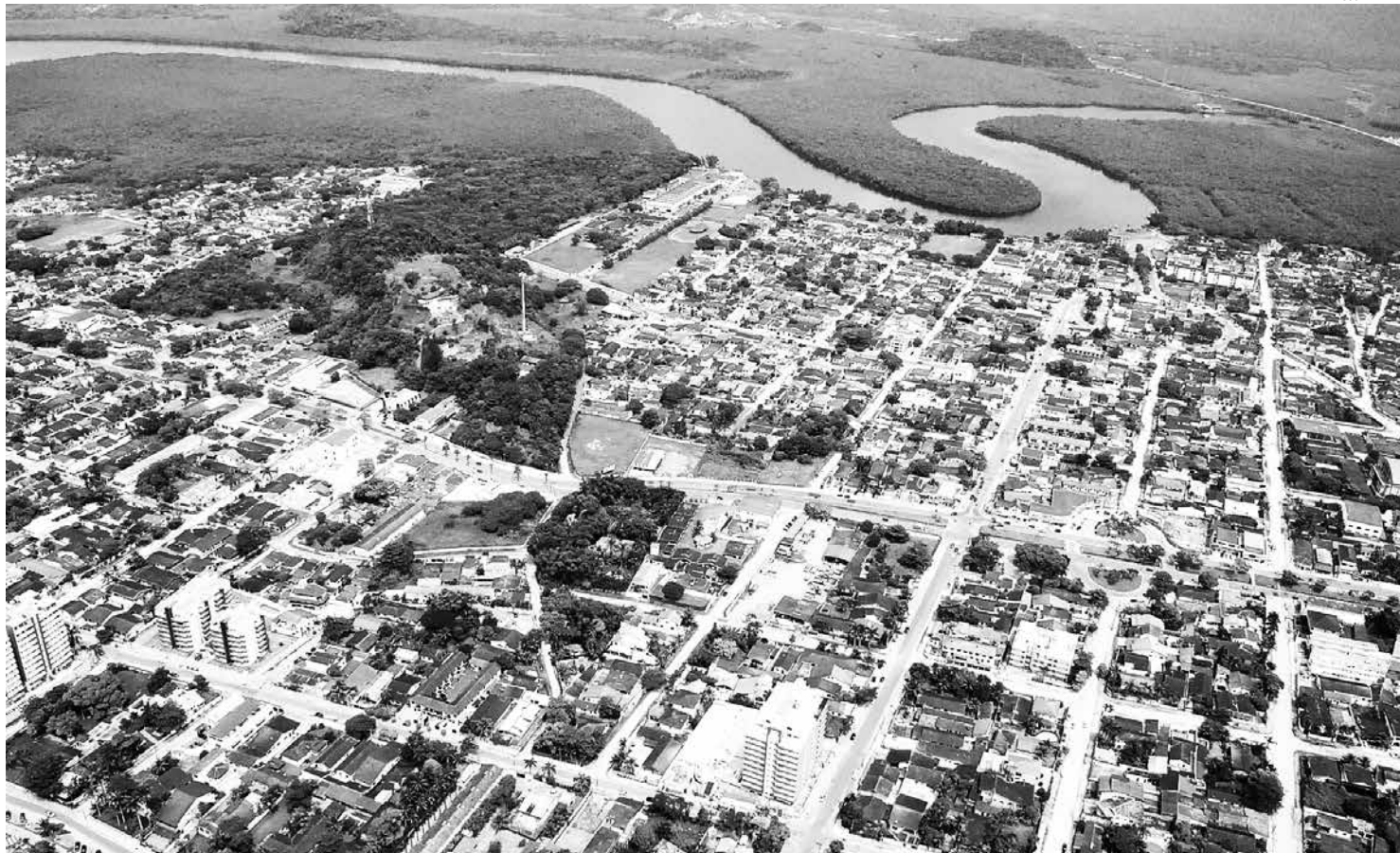
Há mais de dois anos, a Prefeitura de Bertioga vem conduzindo o processo para a revisão do PDDS, nos moldes do que determina o Estatuto da Cidade

O processo para revisão da legislação que vai atualizar o Plano Diretor de Desenvolvimento Sustentado (PDDS) de Bertioga chega a mais uma etapa de discussões na próxima semana. Na segunda, terça e quarta-feira (6, 7 e 8) acontecem as audiências públicas, a partir das 19 horas, momento importante de participação da comunidade para definição da nova legislação.