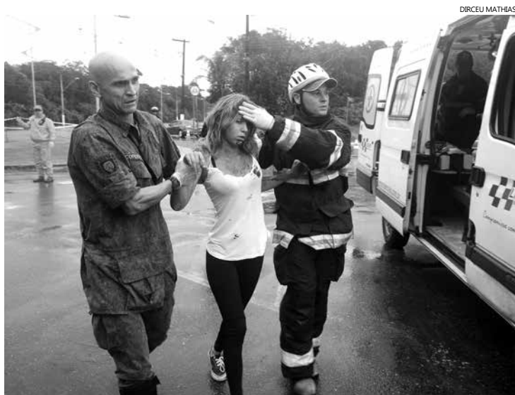
O acidente abrangeu 18 vítimas, sendo que três delas vieram a óbito, nove ficaram em estado grave e seis tiveram escoriações leves

A simulação de resgate de 18 vítimas envolvidas em um acidente automobilístico, entre um carro e um ônibus, chamou a atenção de quem passava pela Avenida Anchieta, próximo ao Colégio Caiçara, na manhã desta sexta-feira (04). A ação foi realizada pela Defesa Civil, Corpo de Bombeiros e Samu, e contou com a