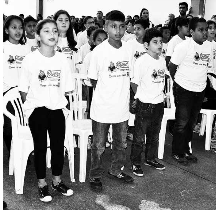
Programa envolveu alunos de cinco unidades municipais: Mário Covas Júnior, José Inácio Hora, Rio da Granja, Giusfredo Santini, Vista Linda e a escola particular Viver Aprendendo

com a educação em Bertioga. “Deve preparar nossas crianças para o futuro. Vocês que estão se