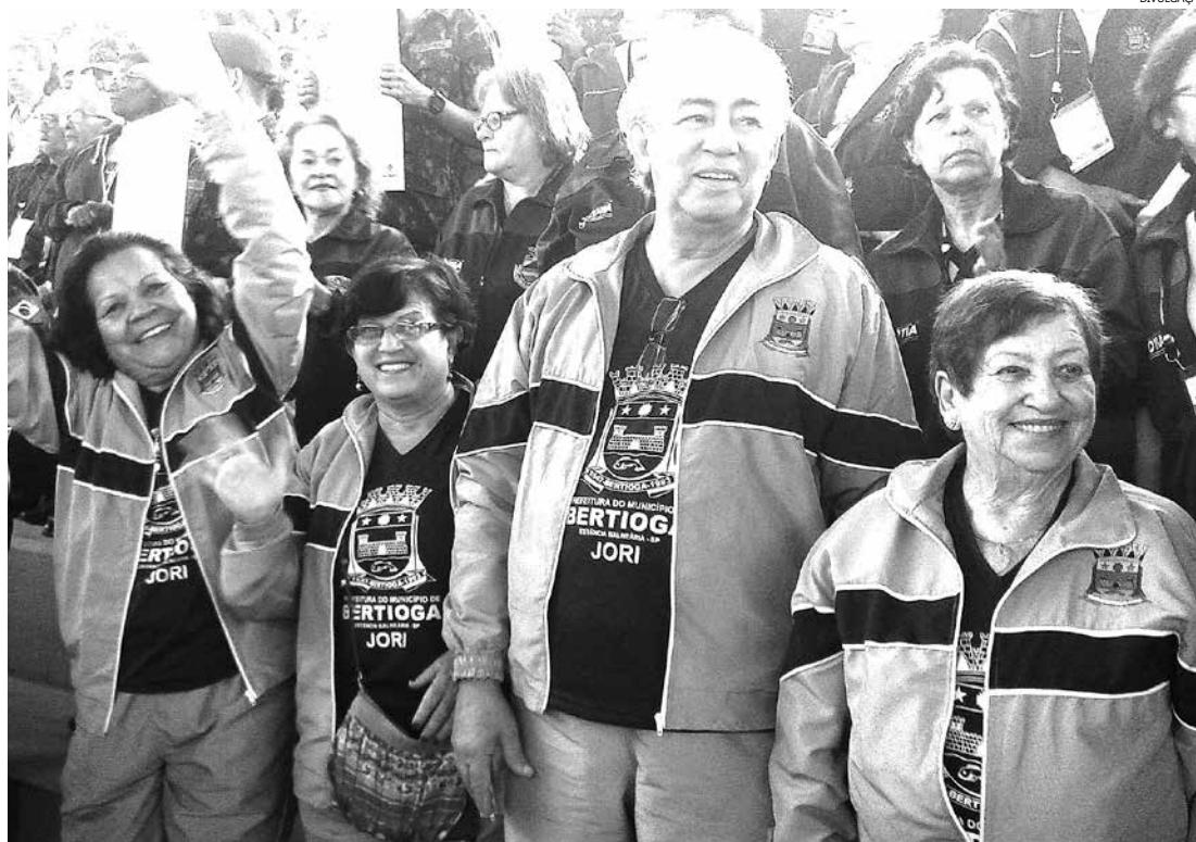
Bertioga competiu no vôlei (masc.), bocha misto, dominó (masc. e fem.), atletismo, natação, truco, dança de salão, buraco (fem.), tênis de mesa (masc. e fem.) e dama (fem.)

Competição aconteceu entre os dias 24 e 28 de junho, quando o Município também conquistou o quarto lugar no vôlei e na dama