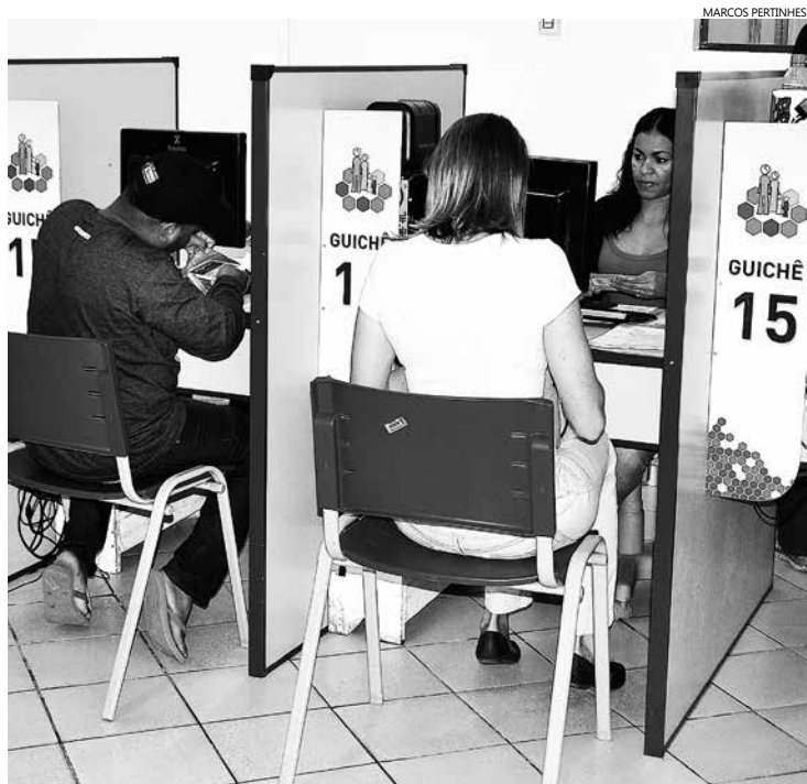
Para obter a Carteira de Trabalho, basta ter mais de 14 anos de idade e apresentar foto e documentos pessoais

As duas unidades do Espaço Cidadão, localizadas no Centro e em Boracéia, oferecem o documento, que pode ser retirado na hora