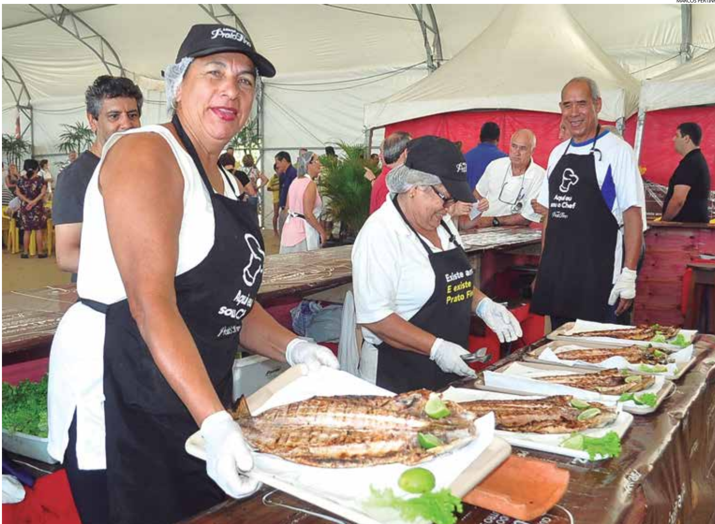
O prato é um dos principais da culinária caiçara e nele a tainha é servida assada na brasa - inteira ou espalmada

A Praça de Eventos está localizada na Avenida Thomé de Souza, ao lado do Parque dos Tupiniquins e Forte São João – Praia da Enseada (Centro).