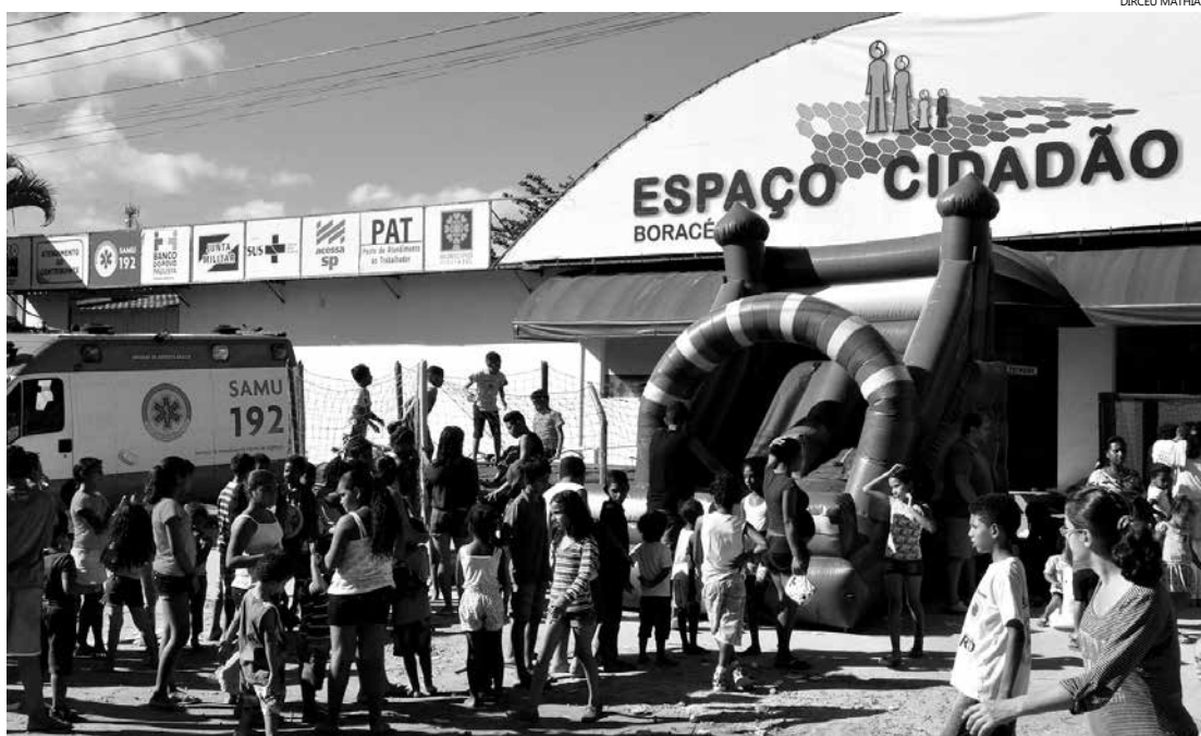
Centenas de crianças participaram das brincadeiras e atividades que aconteceram durante todo o dia no Espaço Cidadão - Boracéia

Programa 'Nosso Bairro, Nossa Paixão' é realizado com doações e trabalho de voluntários com o objetivo de integração e socialização