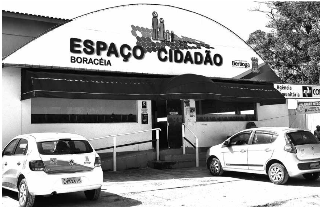
Intitulado 'Boracéia Ativa', o evento será realizado no Espaço Cidadão-Boracéia (Rua José Costa, 138)

Atividades acontecem das 9 às 16 horas, no Espaço Cidadão-Boracéia