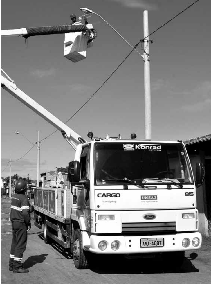
Boracéia recebeu o plano de expansão da iluminação pública, com mais 52 pontos em todo o bairro