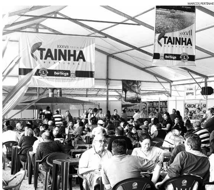
A expectativa dos organizadores é de que cerca de 20 mil pessoas participem da Festa

O prato é um dos principais da culinária caiçara e nele a tainha é servida assada na brasa (inteira ou espalmada), com acompanhamento de arroz quentinho, farofa bem temperada, vinagrete e pão. O evento acontece em uma estrutura montada na Praça