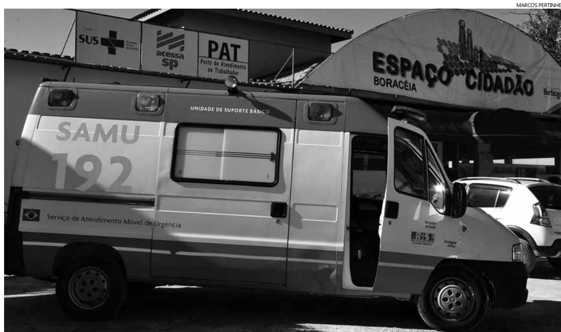
A Prefeitura implantou uma base do SAMU em Boracéia, agilizando o atendimento à comunidade

Objetivo é facilitar o acesso da comunidade a diversas ações na Região Norte, que fica distante da sede administrativa, no Centro de Bertioga