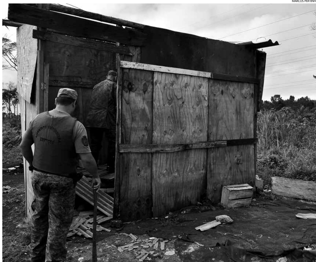
Submoradias estavam em fase de construção e não ocupadas

As denúncias de invasão devem ser informadas à DOA pelo telefone 3317-7073 ou à Guarda Civil Municipal (GCM) pelo número 153.