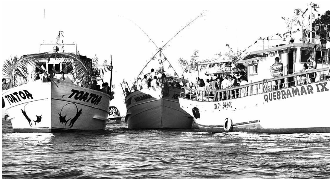
Ano passado, a procissão, contou com a participação de 13 barcos e mais de 200 pessoas, que lotaram o píer de onde saíram as embarcações

O Dia de São Pedro Pescador (celebrado oficialmente no dia 29) será comemorado com uma grande festa em Bertioga neste domingo (28). A Paróquia São João Batista e a Colônia dos Pescadores