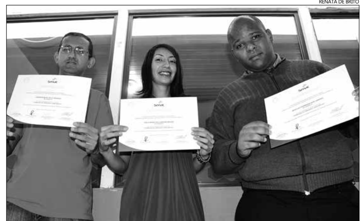
No ano passado, mais de 20 pessoas se formaram no curso de garçom e garçonete, realizado em Boracéia

A proposta deu certo e este mês teve início três cursos: Assistente Administrativo, Soldador e Operador de Caixa, desenvolvidos em parceria com o Governo do Estado, por meio do Programa Estadual de Qualificação (PEQ). Os cursos são gratuitos e são oferecidas 32 vagas, além de bolsa-auxílio.