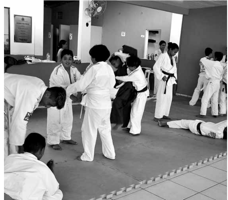
No Espaço Cidadão estão disponíveis diversas modalidades esportivas, inclusive o judô

Desenvolvimento Social, Trabalho e Renda também vem procurando descentralizar os serviços oferecidos à comunidade da Região Norte e a novidade são os cursos de qualificação disponibilizados no Espaço Cidadão-Boracéia.