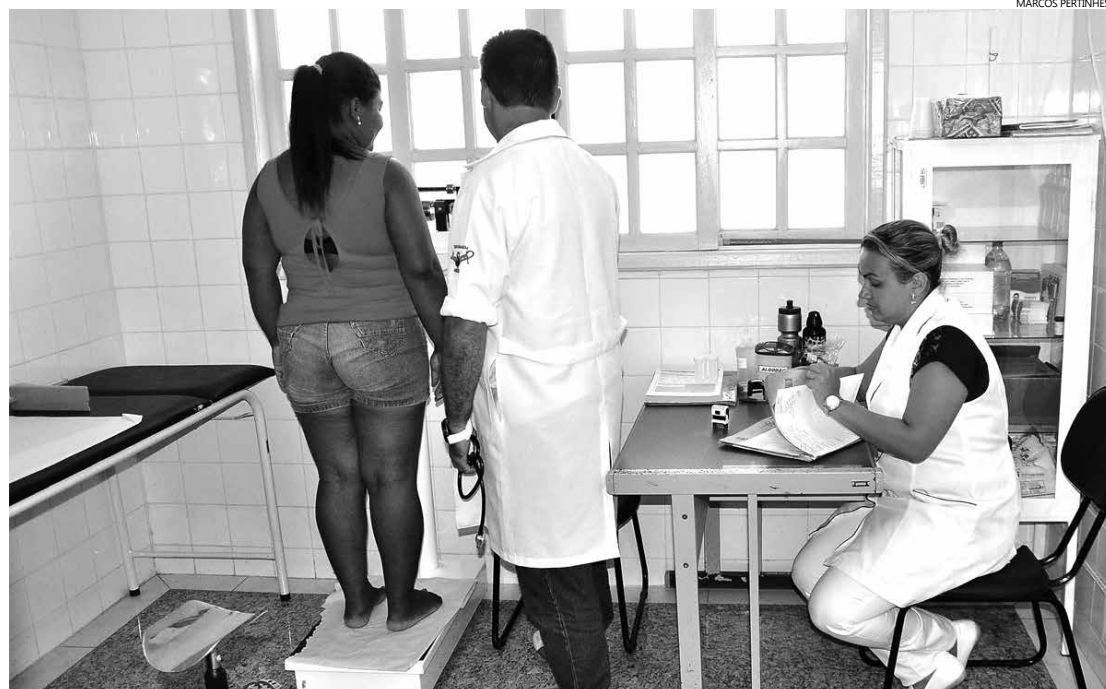
Os agentes comunitários do ESF já trabalham no atendimento básico e prevenção à saúde

Com a base do SAMU na Região Norte, o tempo de resposta aos chamados é menor, o que resulta em melhor qualidade do serviço e valorização da vida humana.