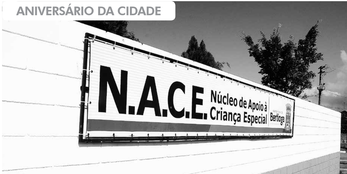
O Nace, localizado no bairro Vista Linda, recebeu melhorias em sua estrutura