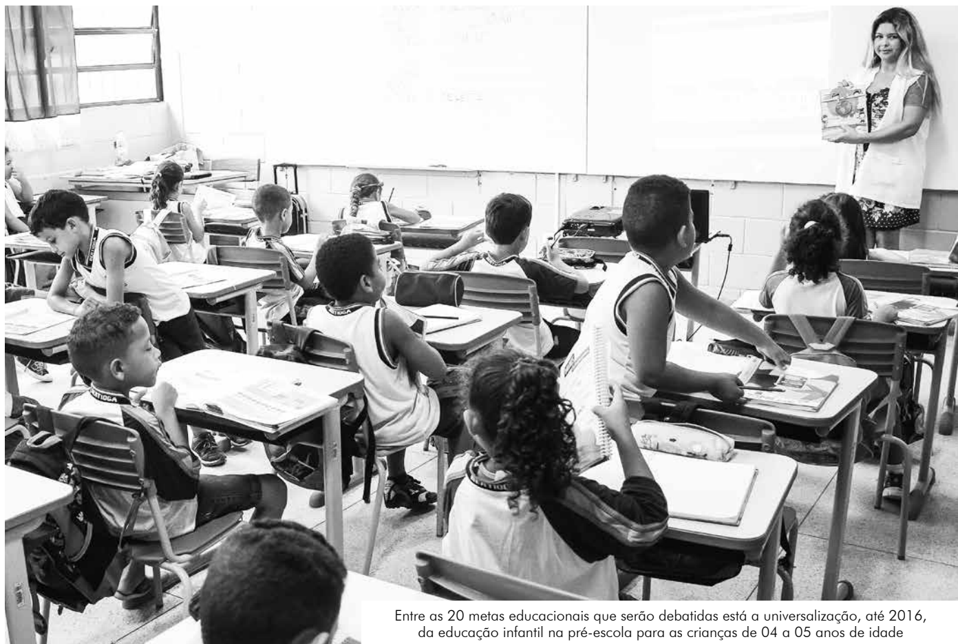
Entre as 20 metas educacionais que serão debatidas está a universalização, até 2016, da educação infantil na pré-escola para as crianças de 04 a 05 anos de idade

discutindo a elaboração do PME desde abril deste ano, quando foram escolhidos representantes de todas as unidades escolares para acompanhamento das discussões. O grupo ainda é formado por membros da Secretaria de Educação, dos conselhos municipais de Educação e Alimentação Escolar e do Fundeb.