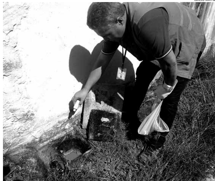
O método está sendo utilizado em locais que não contam com rede de esgoto e são utilizadas fossas sanitárias

Para denunciar casos de esgoto irregular os telefones são 3317-7073 (Diretoria de Operações Ambientais) e 3319-8034 (Secretaria de Meio Ambiente).