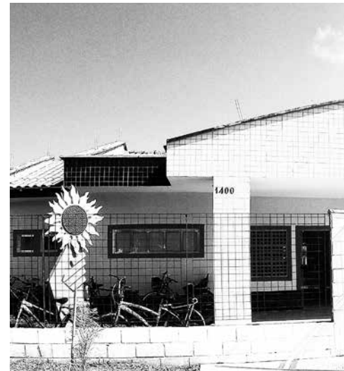
Nova unidade escolar tem capacidade para atender 200 alunos

e tem como objetivo garantir segurança e facilidade de acesso para banhistas que se utilizam da Praia de Boracéia. O posto vai permitir aos guarda vidas o monitoramento da praia, com alcance até a Praia de Itagaré. A Associação dispõe de seis guarda vidas habilitados, além de um triciclo e um barco inflável a motor, que auxiliam na segurança na praia.