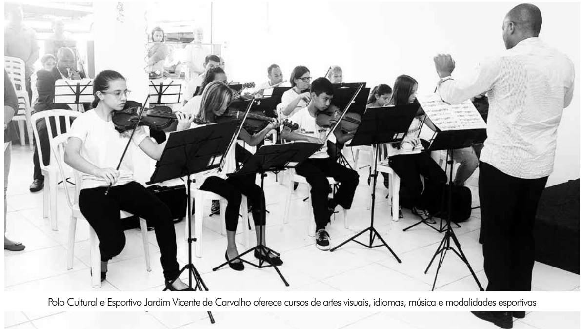
Polo Cultural e Esportivo Jardim Vicente de Carvalho oferece cursos de artes visuais, idiomas, música e modalidades esportivas