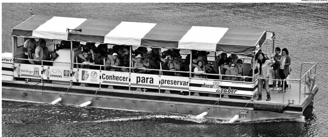
O grupo navegou pelo Rio Itapanhaú conhecendo um pouco da flora e fauna da região

Grupo tomou conhecimento do passeio pelo site da Prefeitura de Bertioga e se encantou com as belezas naturais do Município