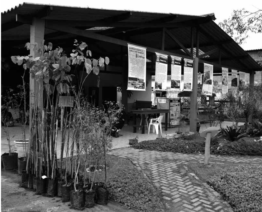
O Viveiro de Plantas 'Seo' Leo, que comemora três anos de funcionamento, vai abrigar diversas atividades, como as Oficinas de Educação Ambiental, para alunos da rede de ensino

Uma programação diversificada vai fazer parte das comemorações da Semana do Meio Ambiente em Bertioga. Do próximo dia 01 ao dia 05, a Prefeitura de Bertioga, por meio da Secretaria de Meio Ambiente, em parceria com as demais pastas, realiza atividades que incluem oficinas de educação ambiental, palestras, mutirão de plantio de jundu, oficina de cultivo de orquídeas e passeio com o Barco Escola Arca do Saber.