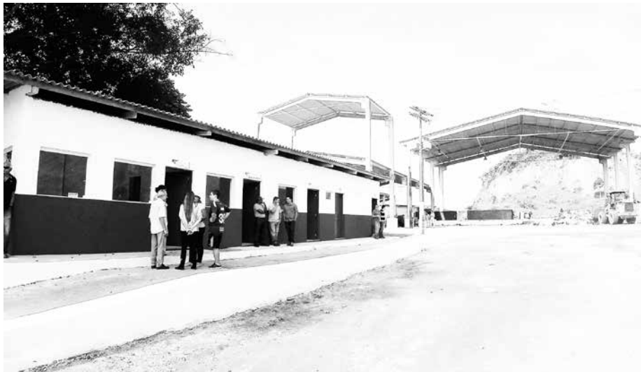
Unidade está localizada no km. 227 da Rodovia Rio-Santos

O aniversário de 24 anos de emancipação político-administrativa de Bertioga, comemorado no último dia 19, foi marcado por entrega de obras à população. A Cidade ganhou uma Base da Guarda Civil Municipal, a iluminação desportiva da orla do Rio da Praia; um Terminal de Transbordo de Passageiros, dois Polos Culturais e Esportivos no Jardim Vicente de Carvalho e no Bairro Chácaras, um Centro de Gerenciamento e Beneficiamento de Resíduos, a reforma do Núcleo de Apoio à Criança Especial