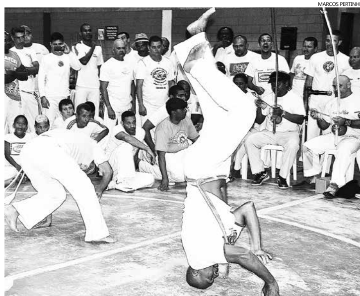
Mais de 100 crianças que fazem aula de capoeira no Projeto Educando para a Cidadania, promovido pela Prefeitura de Bertioga deverão receber a primeira graduação

A abertura oficial do evento será neste sábado (23), às 9 horas, nas dependências da antiga colônia de férias da Prodesan, e seguirá até domingo (24), com a