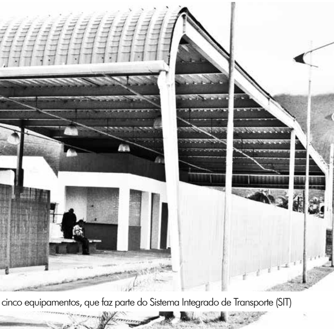
cinco equipamentos, que faz parte do Sistema Integrado de Transporte (SIT)