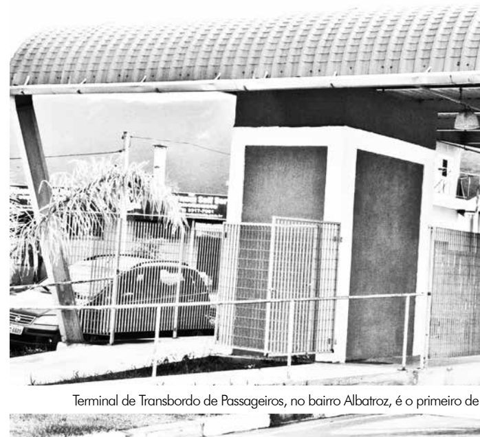
Terminal de Transbordo de Passageiros, no bairro Albatroz, é o primeiro de