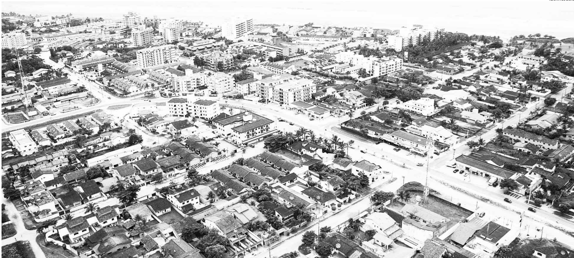
Bertioga é destaque como uma das praias com maior valorização imobiliária

A valorização imobiliária de Bertioga é destaque na revista Exame, da Editora Abril, deste mês de maio. Esta é a segunda vez consecutiva que a publicação menciona a Cidade como uma das praias com maior valorização, entre as 100 principais cidades pesquisadas em todo o Brasil.