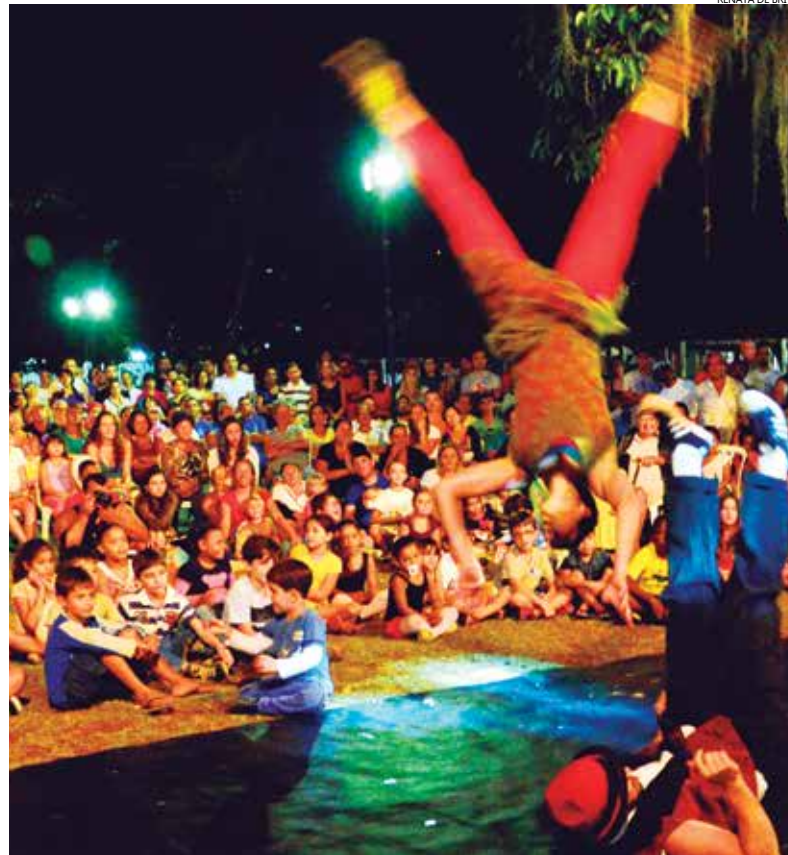
Atividades incluem música, dança, circo, artes visuais, literatura e cultura digital

Com intensa programação cultural, gratuita, para todas as idades, o Parque dos Tupiniquins, em Bertioga receberá, no próximo dia 24, o Circuito Sesc de Artes 2015 - Conectando Lugares, realizado pelo Sesc São Paulo, com o apoio da Prefeitura do Município. A partir das 17 horas, o espaço se tornará palco para apresentações de música, dança, circo, artes visuais, literatura e cultura digital. A programação, que segue até às 22 horas, é gratuita e aberta a toda comunidade.