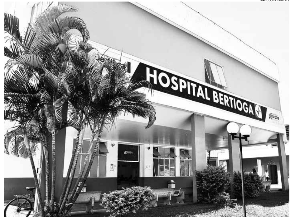
O Hospital Bertioga está localizado na Praça Vicente Molinari, no Centro

Para o prefeito, esses recursos se traduzem em um importante investimento na saúde. “Vamos, com isso, melhorar ainda mais a qualidade de atendimento na saúde, pilar da nossa Administração, adquirir medicamentos e equipamentos, além de podermos realizar investimentos em pessoal e na melhoria da qualidade dos serviços. Essas verbas sairiam do tesouro municipal, com este aporte do Estado, economizamos recursos próprios para aplicarmos em outras áreas da saúde”, comentou o prefeito.