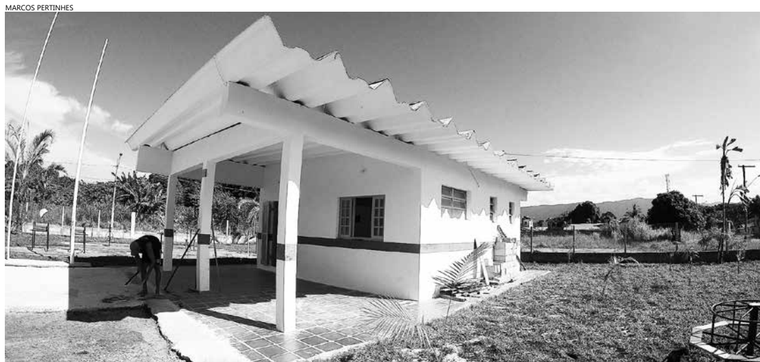
Novo equipamento, que será inaugurado durante as comemorações do 24º aniversário de emancipação político-administrativa de Bertioga, em 19 de maio

Local vai funcionar 24 horas por dia e servirá de apoio para as viaturas da Ronda Escolar, como reforço para a segurança pública da Cidade