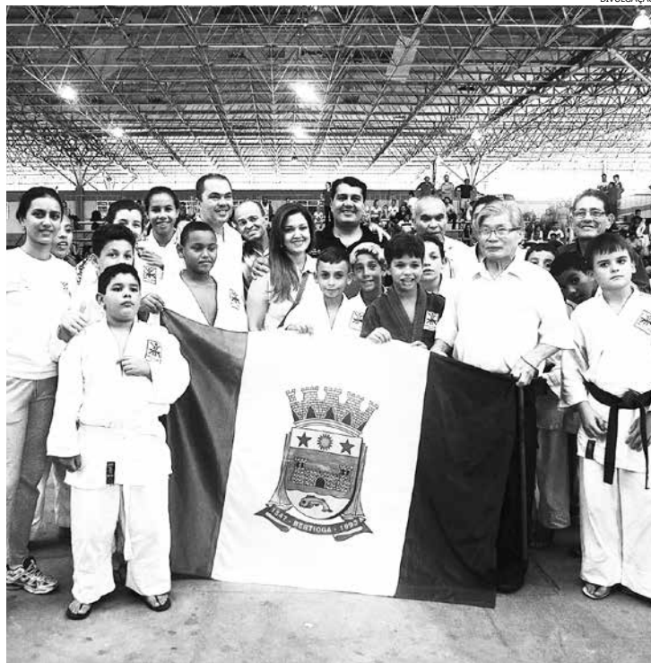
Das 10 medalhas, judocas conquistaram duas de ouro, três de prata e cinco de bronze

Etapa regional aconteceu no sábado (11), em São Vicente, com a participação de 18 bertiogueses