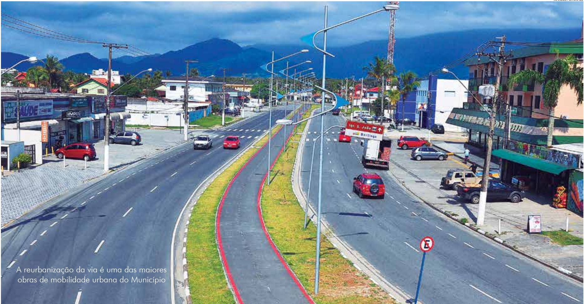
A reurbanização da via é uma das maiores obras de mobilidade urbana do Município

Uma das maiores obras de mobilidade urbana de Bertioga, a reurbanização da Avenida Anchieta, se transformou em um marco para o desenvolvimento da Cidade. Embora a comunidade já esteja sentindo os benefícios da obra – utilizando a via que foi duplicada em seis quilômetros de extensão –, a previsão é de que a inauguração oficial aconteça no dia 19 de maio, durante as comemorações pelo 24º aniversário de emancipação político-administrativa de Bertioga.