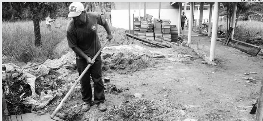
Os serviços na Emeif Caiubura teve início em agosto do ano passado, com a implantação do novo sistema de manutenção predial preventiva das escolas

Os serviços de manutenção corretiva que estão sendo realizados na Emeif Caiubura prosseguem em ritmo acelerado, com um reforço da equipe responsável pelo trabalho. A previsão é de que a escola seja entregue no final do mês de abril.