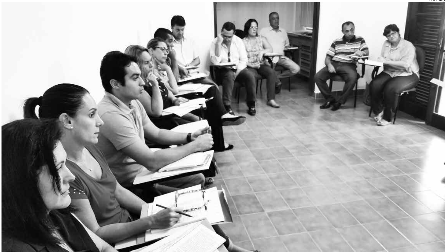
Servidores municipais capacitados para acompanhar a execução dos contratos celebrados pela Administração

Uma das medidas adotadas pela Prefeitura, sob a coordenação da Procuradoria Geral, foi à nomeação do gestor e do fiscal para acompanhar a execução dos contratos celebrados pela Administração