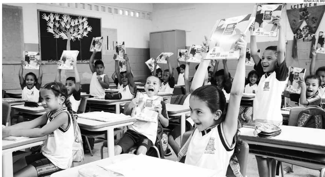
Os alunos da Emeif Giusfredo Santini receberam as apostilas na segunda-feira (23)

Desde 2010, Bertioga adotou o sistema apostilado para garantir um planejamento único em toda a rede. Além disso, em caso de transferência de escola, o conteúdo do aluno não fica prejudicado. Os professores também recebem um calendário que ensina valores, como a importância da paz, a preservação da água e do meio ambiente, entre outros, que podem ser trabalhados a cada