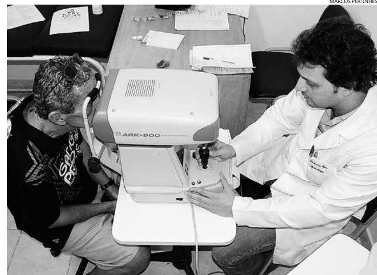
Após consulta, o paciente pode realizar exames como biometria ótica, mapeamento de retina, topografia de córnea, campo visual, foto coagulação a laser e cirurgias

Serviço conta com 16 profissionais especializados e são realizados exames e cirurgias, quando recomendado