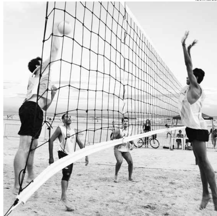
O voleibol é uma das praticas esportivas que vem atraindo muitos praticantes

As aulas são gratuitas e têm início na próxima terça-feira (31), nas areias da Praia da Enseada, no Centro, e vão