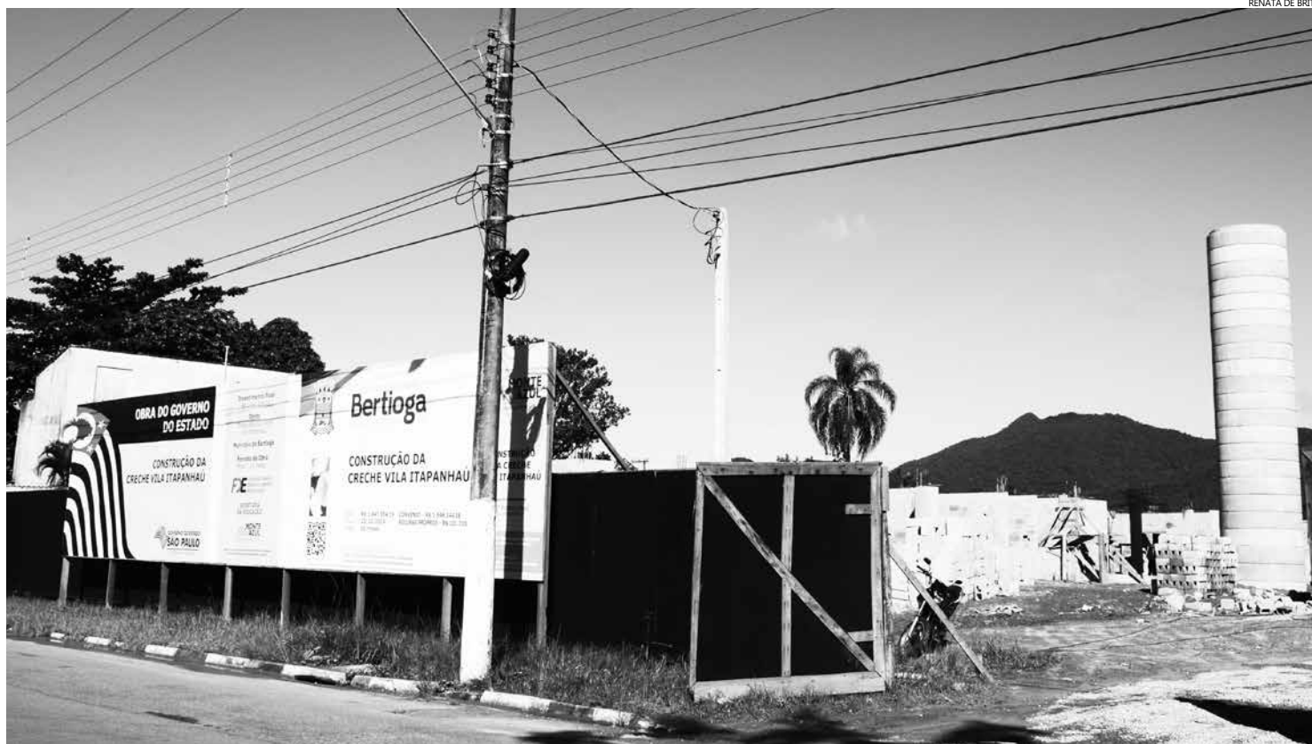
Aproximadamente 25% dos serviços estão prontos, com a finalização da fase de alvenaria, e prosseguem em ritmo acelerado

Equipamento vai atender 150 crianças de 0 a 4 anos e a previsão de conclusão é de 12 meses