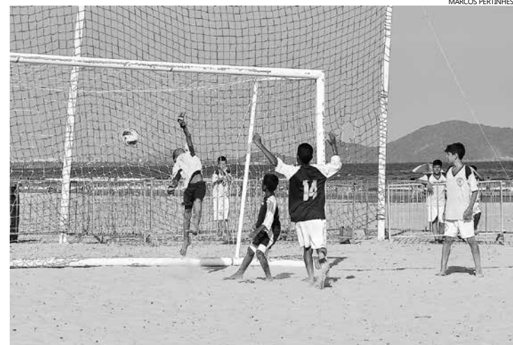
Bertioga se firmou como celeiro de grandes atletas na modalidade defendendo, inclusive, a Seleção Paulista, conquistando títulos em 2009, 2010 e 2011

As inscrições para participar das aulas devem ser feitas no Ginásio Municipal de Esportes Alberto Alves (Rua Henrique Montez, s/nº - Centro). No ato, interessados devem estar munidos da cópia do documento de identidade ou certidão de nascimento; e de duas fotos 3x4. Mais informações pelo telefone 3317-6699.