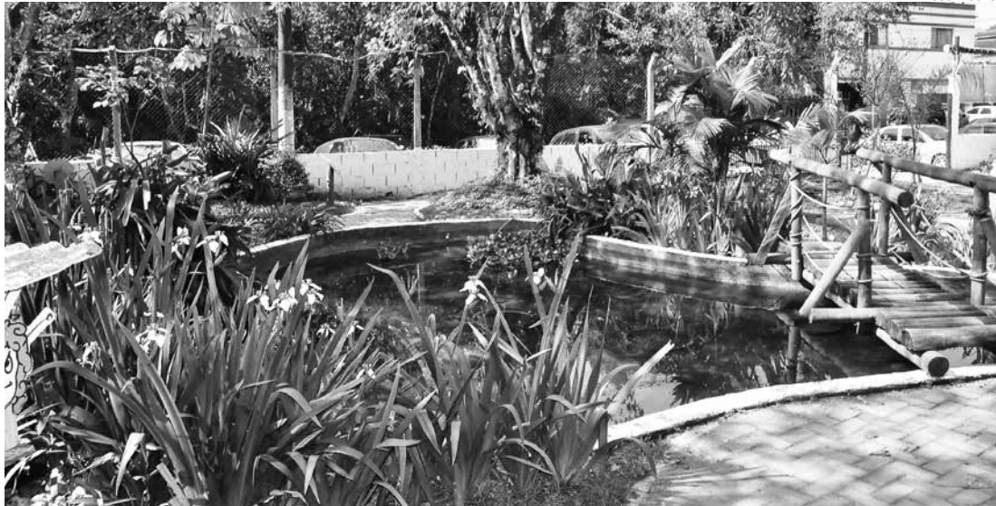
Valores são geridos pelo Conselho Municipal de Meio Ambiente e utilizados para fomentar a fiscalização e a educação ambiental

De acordo com a secretária de Meio Ambiente de Bertioga, os recursos são geridos pelo Conselho Comunitário de Defesa do Meio Ambiente (Condema), criado pela lei 289/98. No início de