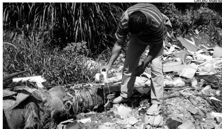
A população deve colaborar com a limpeza urbana, dispondo o lixo nas lixeiras nos dias e horários determinados pela empresa que presta o serviço no Município

A legislação prevê como ato lesivo à manutenção da limpeza