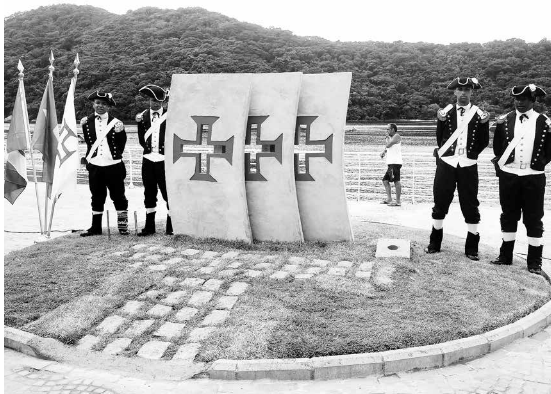
Monumento marcou a saída da flotilha, de Bertioga rumo ao Rio de Janeiro

O marco zero, que retrata três velas de barco estilizadas, foi desenhado pelo prefeito do Município e instalado na manhã de sexta-feira, em um local estratégico, ou seja, virado na direção do Rio de Janeiro, no canteiro central da Avenida Vicente de Carvalho, bem em frente ao histórico Canal de