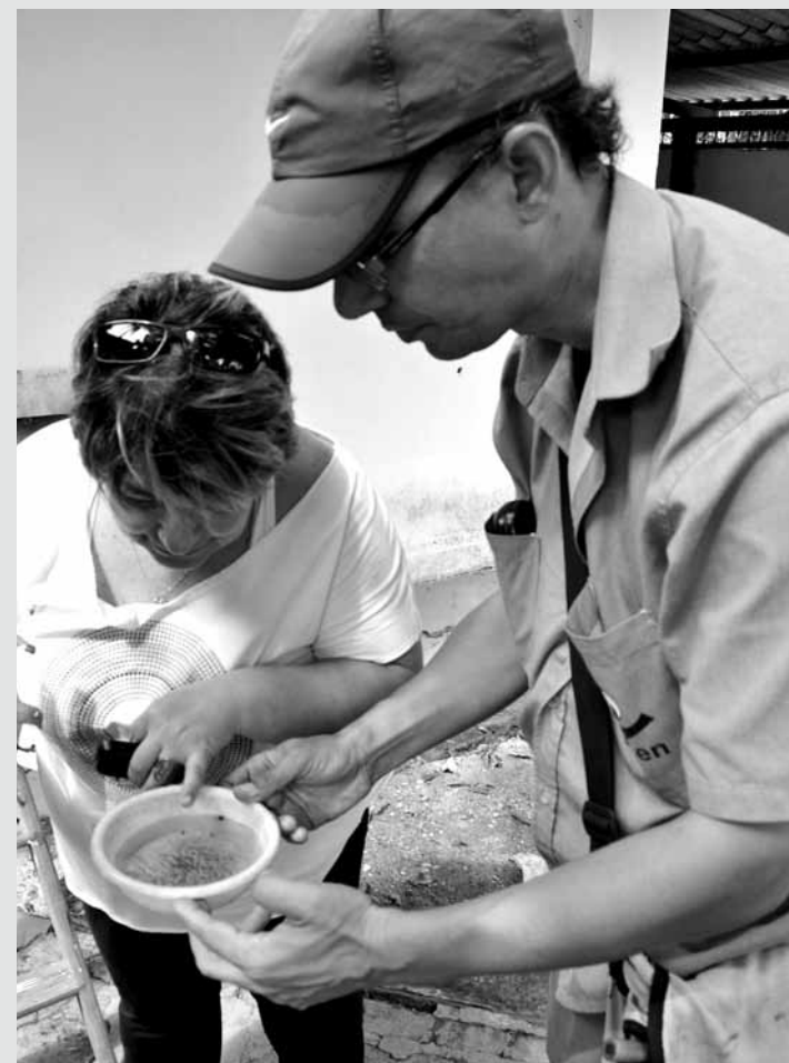
De junho a dezembro do ano passado, a Coordenadoria de Vetores e Dengue realizou mais de 16 mil ações