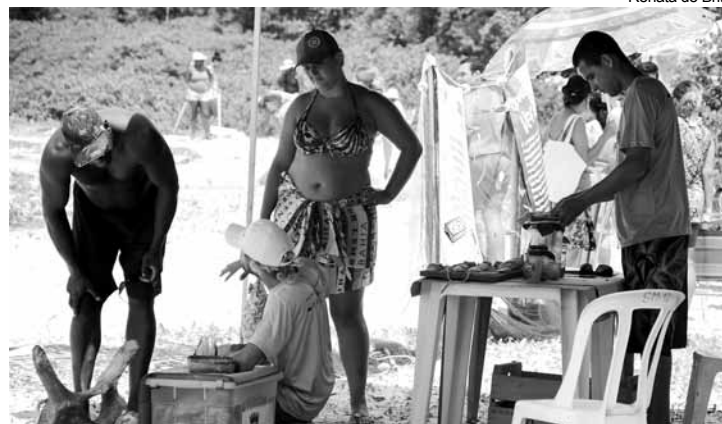
A operação acontece até 1º de fevereiro sempre aos sábados e domingos

Segue até o Carnaval, o plantão de atendimento ao contribuinte, na Prefeitura de Bertioga, que tem à disposição serviços de alteração