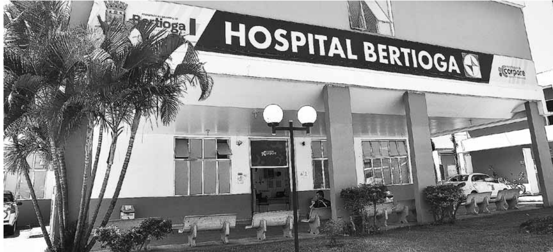
A Prefeitura, apresentou projeto junto ao Ministério da Saúde, para a implantação de 10 leitos de UTI adulto no Hospital de Bertioga

Além dos 10 leitos novos de UTI, o processo ainda contempla a qualificação para UTI de outros sete totalizando 17 leitos. Também está prevista a qualificação da Unidade de Pronto Atendimento (UPA), que significa um repasse mensal para custeio da unidade que está sendo construída na Vista Linda; a implantação de uma sala de estabilização na Unidade Básica de Saúde (UBS) de Boracéia, com atendimento de urgência e emergência 24 horas; e a implantação de 40 leitos de