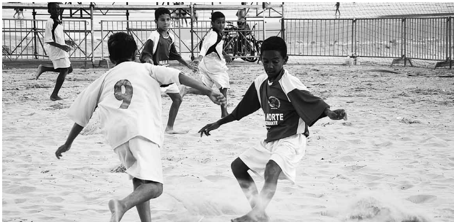
Antes do início das disputas, a partir do dia 07, a Prefeitura vai disponibilizar atividades de futebol, vôlei e beach tênis para os interessados

A Prefeitura de Bertioga, por meio da Diretoria de Esportes, vinculada à Secretaria de Turismo, Esporte e Cultura, iniciou a montagem da arena,