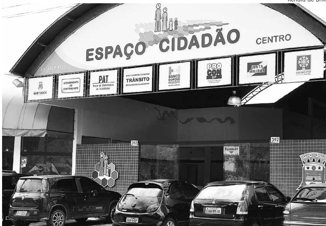
Banco do Povo está localizado no Espaço Cidadão-Centro (Avenida Anchieta, nº 392). O telefone é 3319-9712

O Banco do Povo de Bertioga conta com cerca de R$ 240 mil para conceder empréstimos para microempreendedores da Cidade. Desse valor, cerca de R$ 40 mil são de capital de giro proveniente das parcelas dos empréstimos já concedidos.