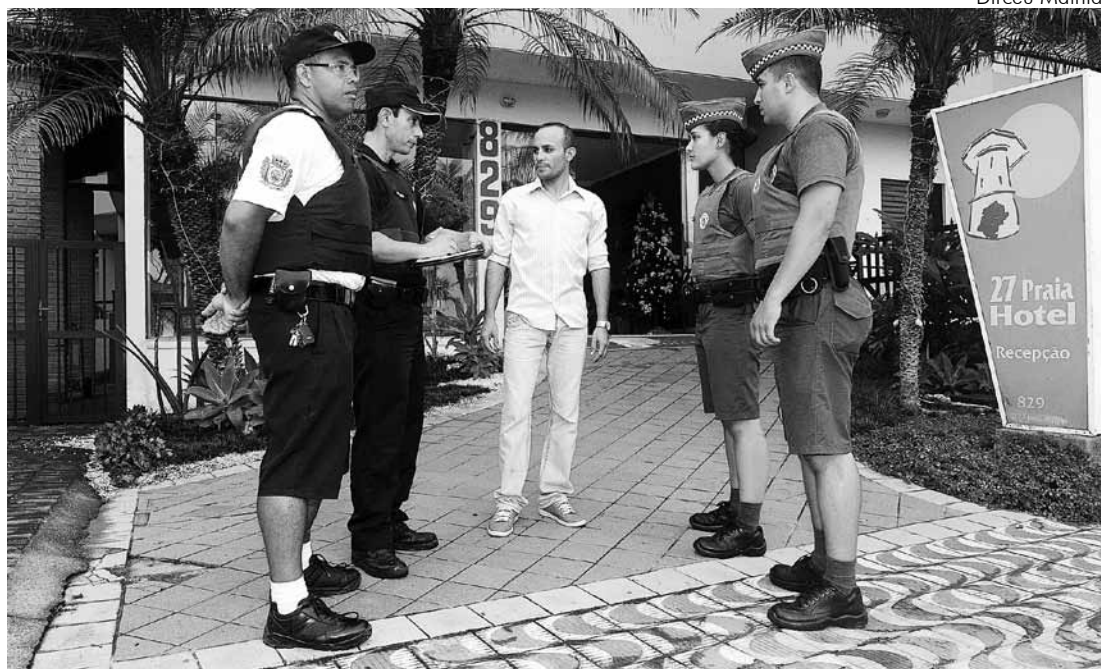
'Ronda Turística' vai garantir segurança e bem estar 24 horas aos usuários de hotéis, pousadas, restaurantes e demais receptivos turísticos

O secretário ainda lembra que a 'Ronda Turística' não vai prejudicar a segurança nos demais segmentos da comunidade. "Todos os anos,