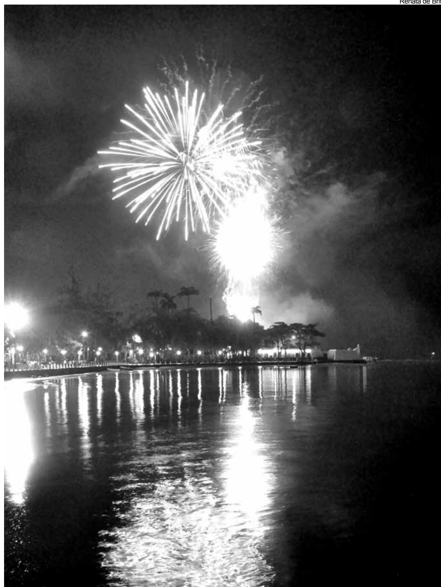
Renata de Brito

A programação continua em janeiro com shows musicais, intervenções culturais e esportivas que fazem parte da programação do Verão