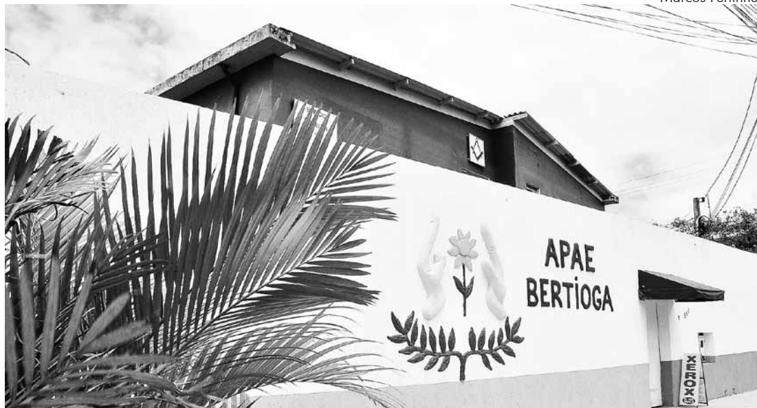
Apae é uma entidade sem fins lucrativos e pode receber doações diretas

Para garantir mais segurança para a entidade, o prefeito sugeriu um repasse acima da