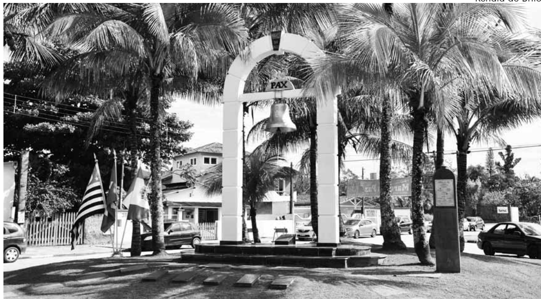
Renata de Brito