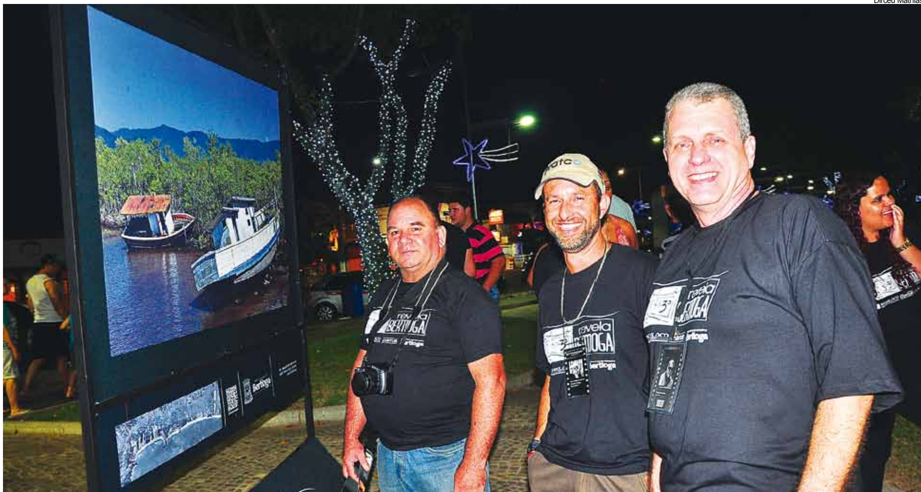
A novidade deste ano foram os painéis com as imagens escolhidas pela curadoria

Um sucesso de público, de profissionais e de imagens. Este é o balanço da terceira edição do Revela Bertioga, que aconteceu de 19 a 21 deste mês, com intervenções na Casa da Cultura, Parque dos Tupiniquins, Forte São João e no jardim do Canal de Bertioga.