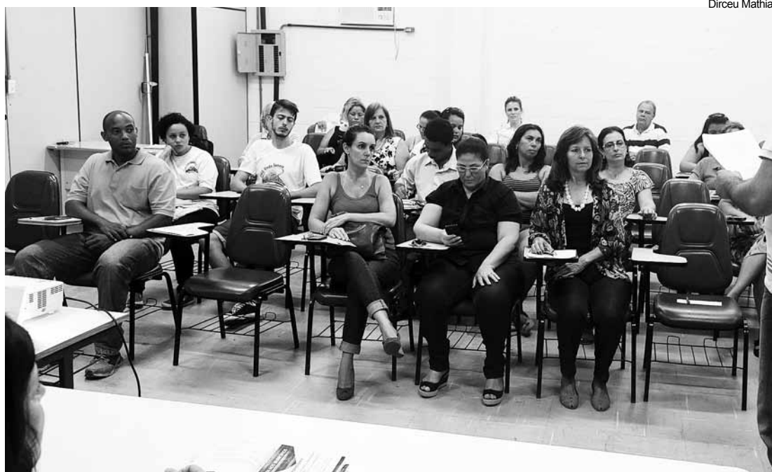
Membros do CMDCA se reuniram para definir as próximas ações

O encontro dos nove municípios tem como objetivo sensibilizar pessoas física e jurídica para destinar recursos aos Fundos Municipais de Direitos da Criança e do Adolescente (FMDCA), que serão revertidos em