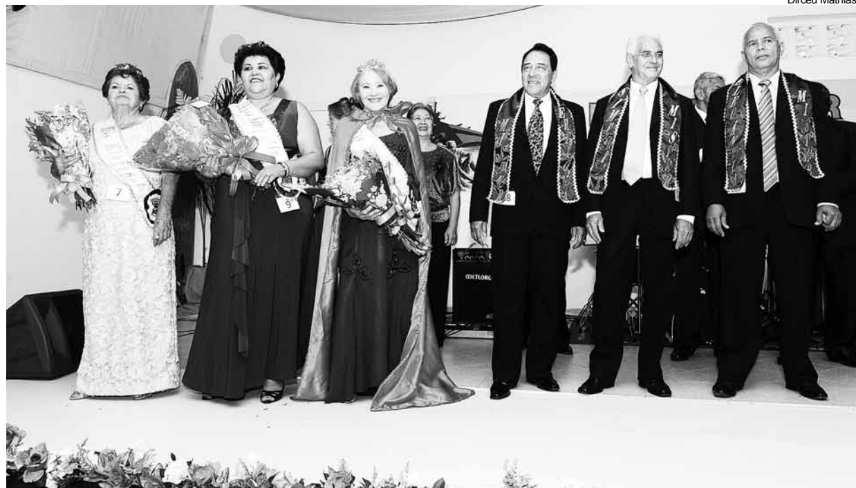
O concurso, que já é tradicional na Cidade, ainda promove a integração

Vamos conhecer os mais belos rostos da 3ª Idade de Bertioga. Isso porque a Prefeitura, por meio do Fundo Social de Solidariedade (FSS) do Município, vai eleger no próximo dia 27, o Miss e Mister da Terceira Idade. A iniciativa acontece às 19 horas, no Salão do FSS.