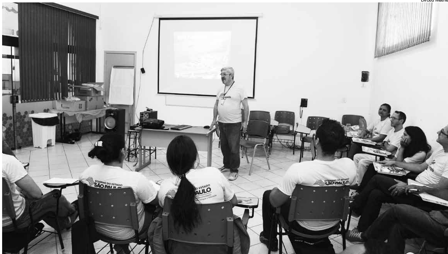
Neste ano, em sete meses, Bertioga capacitou 292 pessoas em cursos desenvolvidos nas unidades do Espaço Cidadão-Centro e Boracéia

Mão de obra qualificada com conhecimento técnico é uma das mais escassas no mercado de trabalho. Por isso, investir em educação é a melhor escolha a curto e longo prazo para quem quer garantir um bom emprego. Pensando assim, é que a Prefeitura de Bertioga, por meio da Diretoria de Trabalho e Renda, vinculada à Secretaria de Desenvolvimento Social, está se empenhando em trazer novos cursos para Bertioga, a partir de 2015.