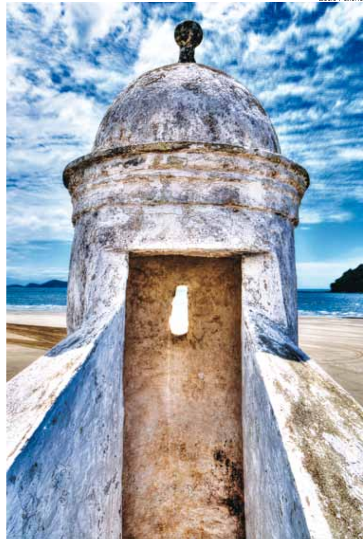
Guarita do Forte São João - o mais antigo do Brasil

O projeto, elaborado pela professora Susana Felix, em parceria com a fotógrafa Renata de Brito, da Diretoria de Comunicação da Prefeitura de Bertioga, despertou um