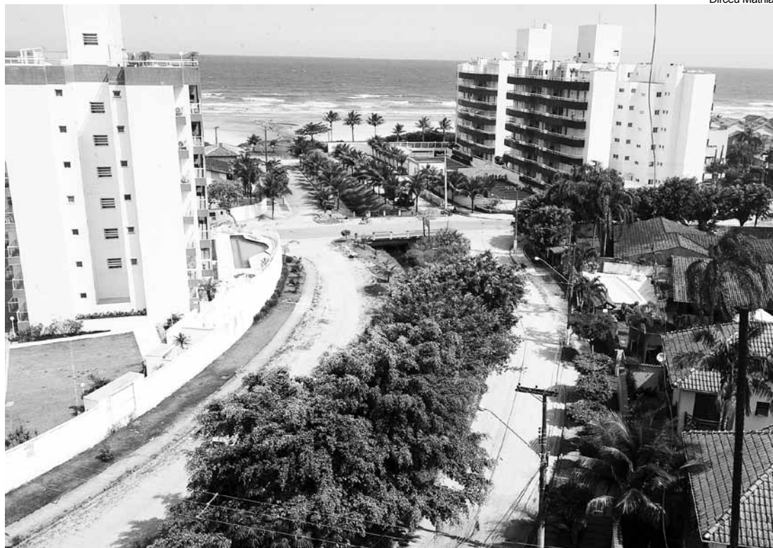
Avenida será pavimentada nas duas pistas entre as ruas João Ramalho e 16

Uma importante via de acesso a dois bairros, Maitinga e Rio da Praia, a avenida vai receber 11.391 m 2 de pavimentação, além de guia, sarjeta, calçada, acessibilidade e sinalização. No trecho entre a Rua João Ramalho e a Rua