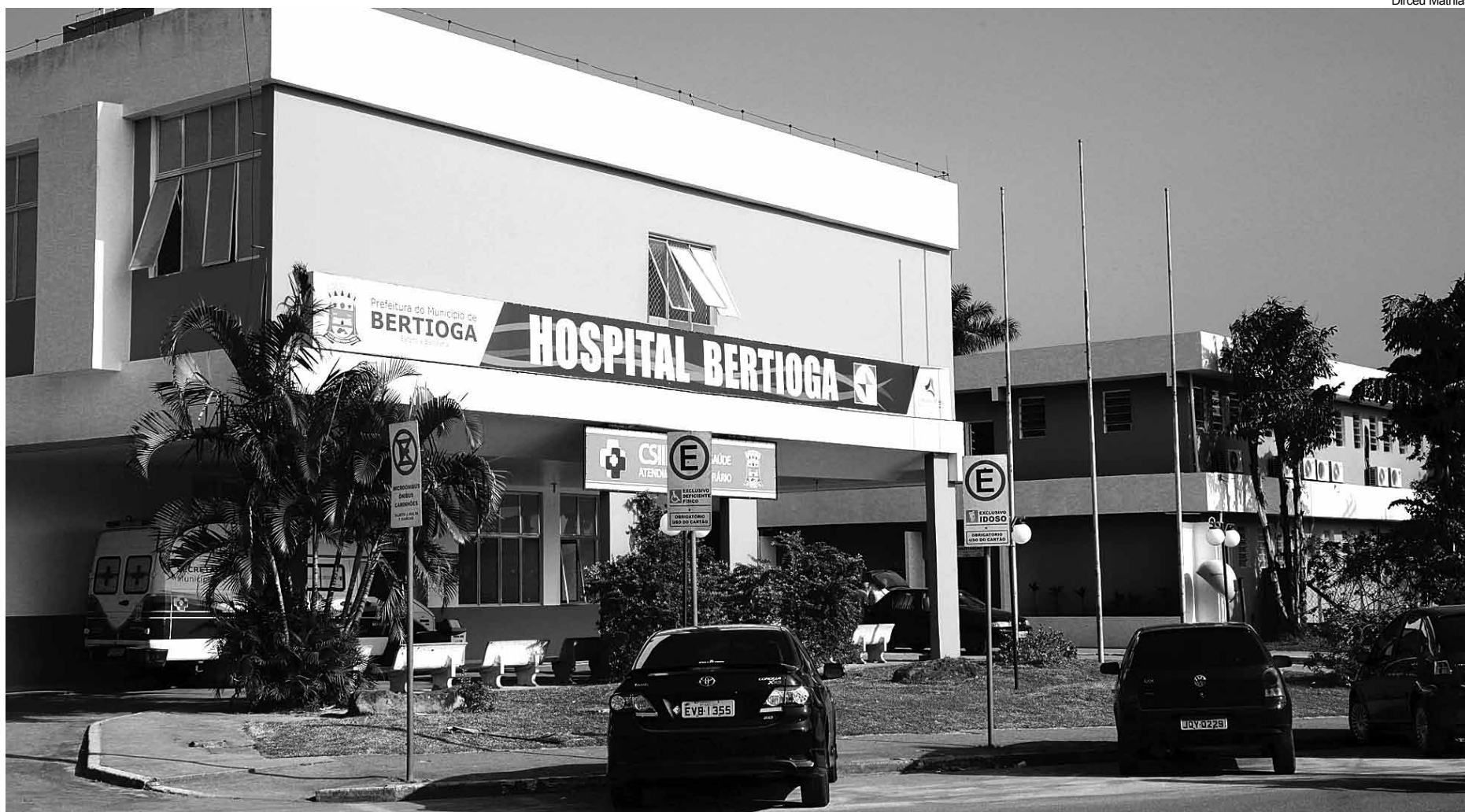
Novo serviço ocupará espaço deixado pelo Centro de Saúde III, no hospital