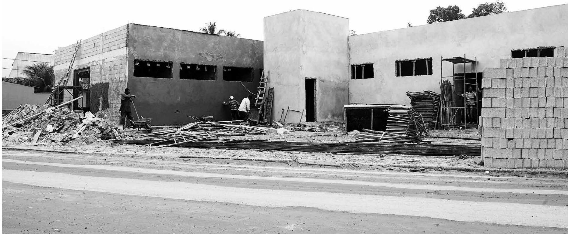
A UPA, construída na Vista Linda, está com 40% da obra concluída terá capacidade para até 150 atendimentos e médicos durante 24 horas

A Unidade de Pronto Atendimento (UPA), que está em construção no bairro Vista Linda, já concluiu 40% das obras em nove meses. O compromisso era inaugurar o equipamento em setembro deste ano, porém, em função do período eleitoral, os repasses de recursos foram suspensos e por conta disso houve atraso nos serviços. Passado esse período, os trabalhos seguem acelerados e a previsão da Prefeitura de Bertioga é entregar a unidade em maio do ano que vem.