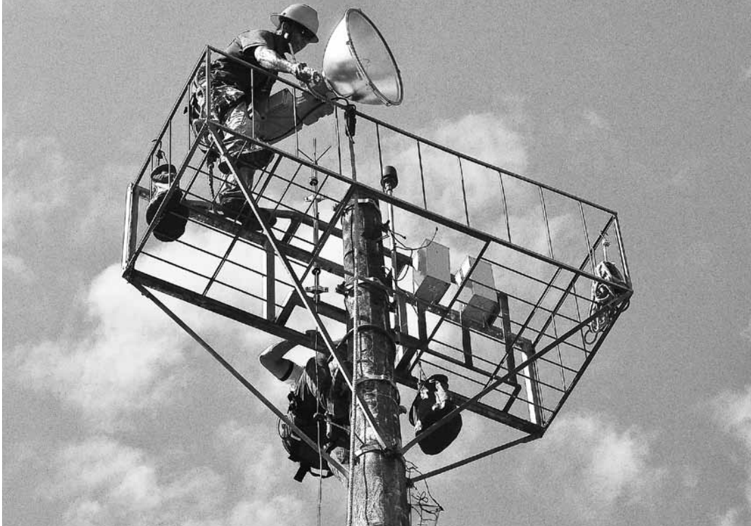
Serão instalados projetores de iluminação com 1.500 watts, como os que já foram colocados no trecho entre o Forte São João e a Pista de Skate

A orla da praia de Bertioga receberá 112 projetores de iluminação desportiva, entre o Centro e Boracéia. Ordem de serviço nesse sentido foi assinada na quarta-feira (12), pelo prefeito de Bertioga para início imediato do serviço que tem prazo de conclusão de 120 dias.