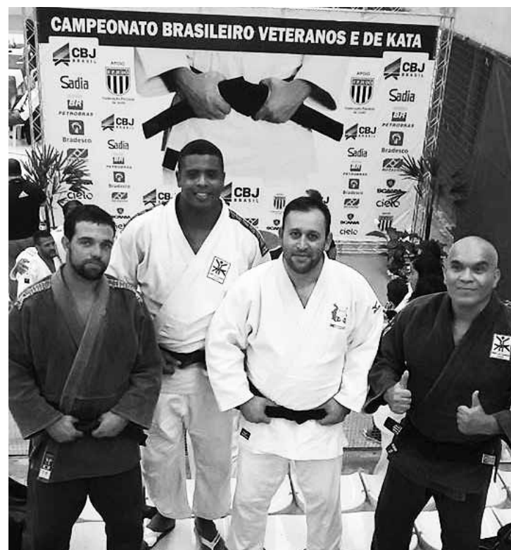
Bertioguenses conquistaram boas colocações na competição