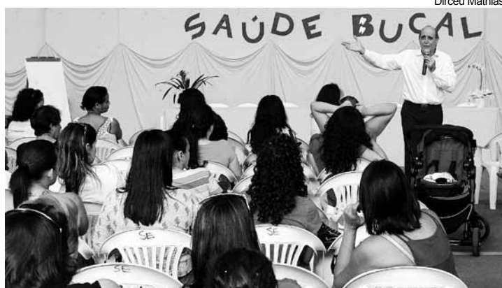
Os professores reforçaram seus conhecimentos com relação à escovação e fio dental

A proposta é que em uma segunda etapa, em 2015, todas as escolas da rede municipal