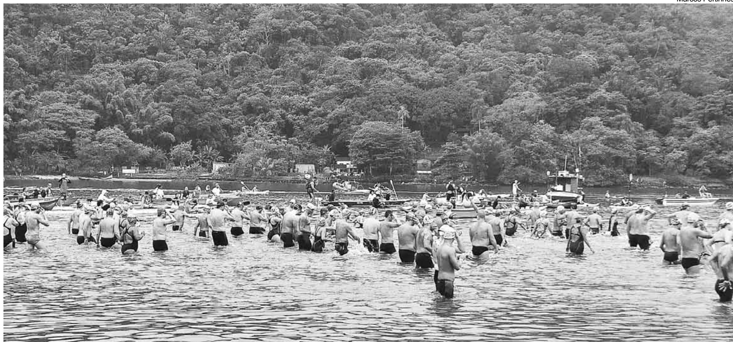
A largada da prova, que já é tradicional na Cidade, acontece ao lado do Forte São João