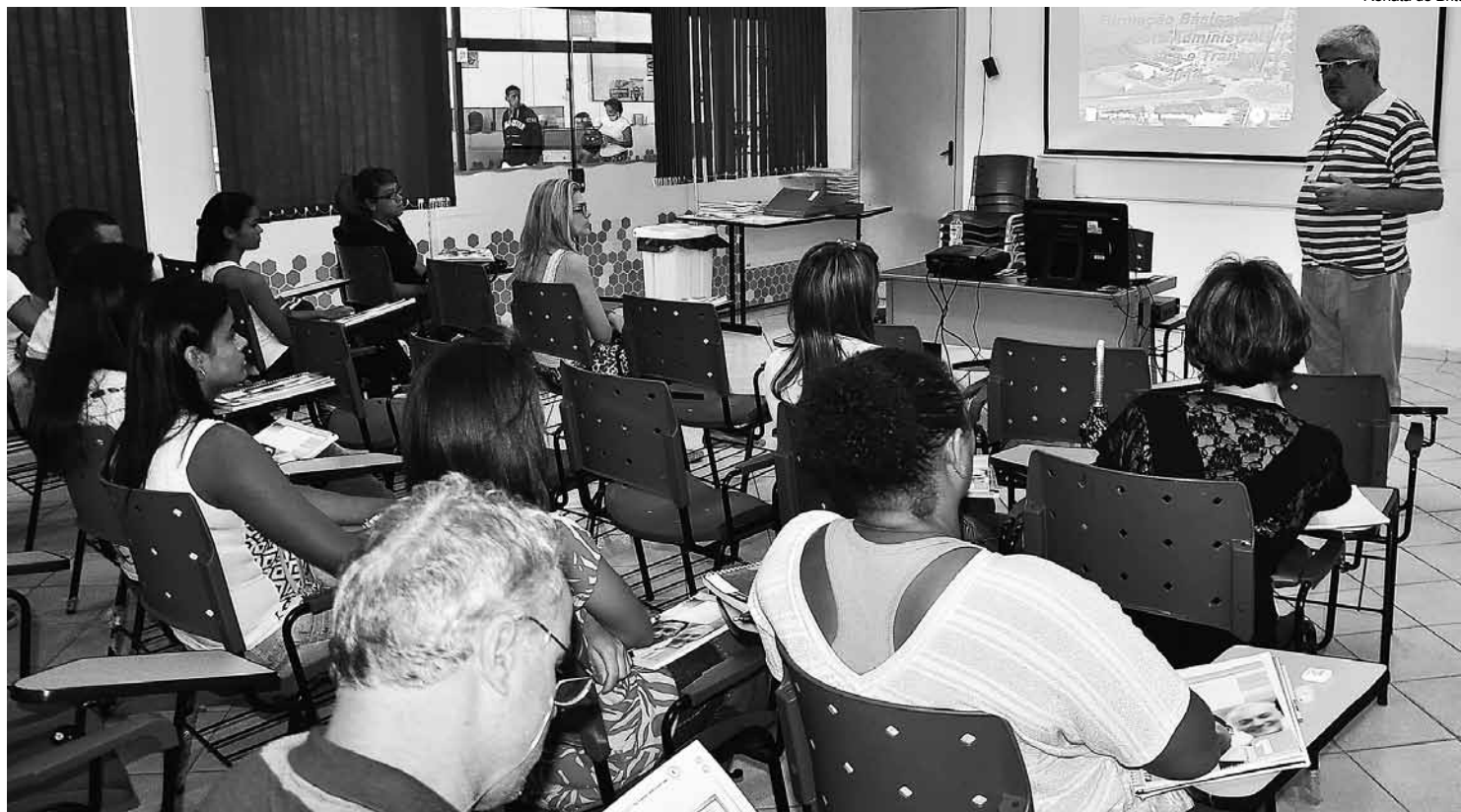
As turmas contaram com cerca de 35 alunos cada uma

Os cursos de capacitação e qualificação do programa Via Rápida Emprego, do governo estadual, desenvolvido em Bertioga, em parceria com a Prefeitura, por meio da Secretaria de Desenvolvimento Social, Trabalho e Renda, formaram mais 70 pessoas, agora aptas para disputar vagas no mercado de trabalho. Em seis meses, o Município já qualificou 280 pessoas.