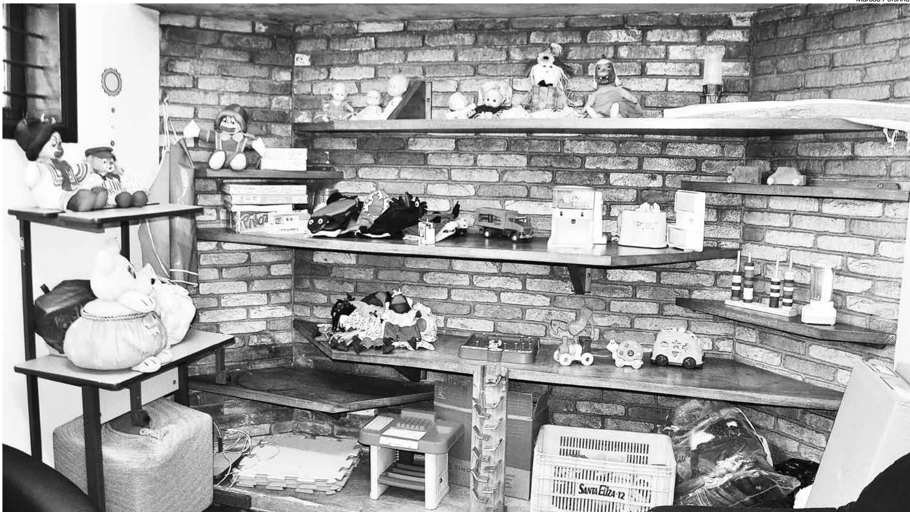
Projeto ainda utiliza brincadeiras e outras atividades lúdicas

Você já pensou em ajudar uma criança, estimulando a leitura de livros e a criar um álbum de figuras contando sua história? Isso é possível através do Projeto 'Fazendo Minha História', ligado à Secretaria Municipal de Desenvolvimento Social, Trabalho e Renda, que está precisando de voluntários para atender as crianças e adolescentes que fazem parte do serviço de acolhimento da Casa de Apoio I e II.