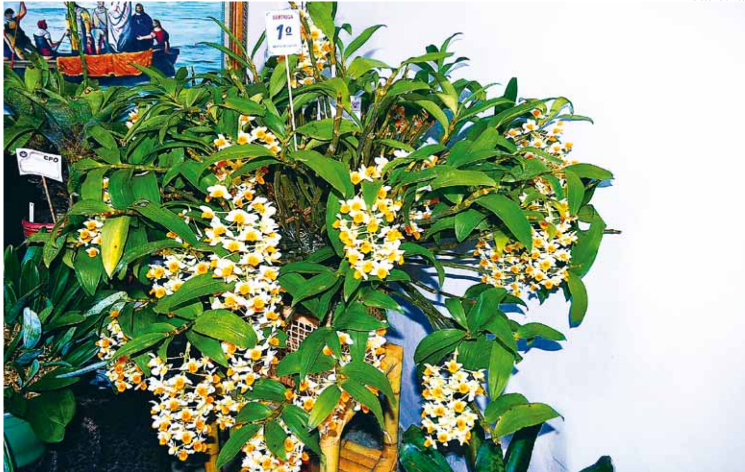
O evento vai contar com exposição e venda de espécies naturais brasileiras, estrangeiras e híbridas

a realização de palestras técnicas e oficinas ecológicas sobre preservação, manejo sustentável e cultivo de orquídeas e bromélias, abertas à comunidade em geral. Interessados podem se inscrever no local. No sábado (01), a programação do projeto Música é Cultura, realizado em parceria com o Sesc, será transferida para o Forte São João, a partir das 20 horas. No domingo (02), a exposição prossegue das 9 às 16 horas, quando acontece o encerramento.