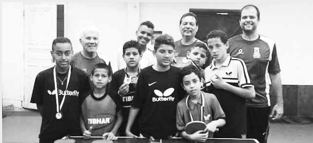
Equipe se reafirmou como uma das melhores da região