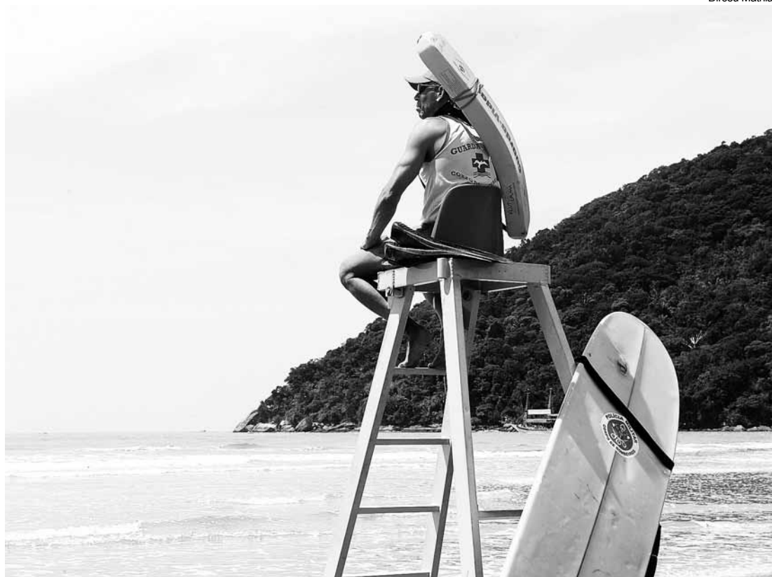
Quarenta e nove pessoas se candidataram para as vagas de salva-vidas

O processo seletivo destina-se ao preenchimento de 20 vagas para salva-vidas e 30 para GCMs, que serão contratados por prazo determinado, a partir de 1º de dezembro deste ano até 18 de fevereiro de 2015. A carga horária para salva-vidas é de 40 horas semanais, e o salário é de R$1.391,85. Já para GCM, a carga horária é de 40 horas semanais e o salário é de R$ 1.587,23.