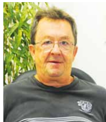
Reis está pensando em ampliar seu comércio

Já prevendo a expansão do centro da Cidade, o prefeito