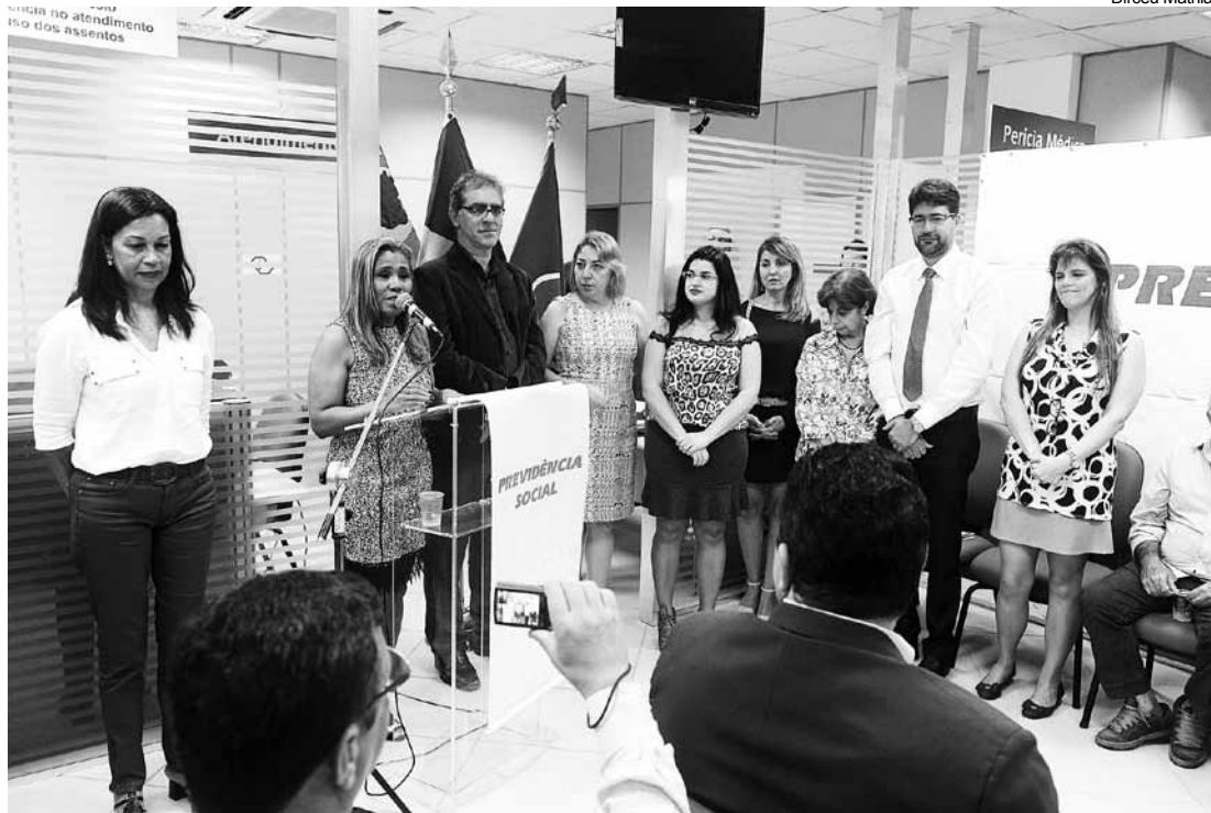
Equipe de profissionais da Previdência vão atender a comunidade de Bertioga

A secretária-executiva informou que a agência implantada na Cidade segue o mesmo modelo em todo o Brasil, e as dimensões do edifício dependem do número de habitantes. “O mais importante é que investimos em gente, porque somos gente atendendo gente”. Ela ainda fez questão de reforçar que o Ministério da Previdência Social vem adotando novos critérios de atendimento considerando que cada benefício concedido na verdade é o reconhecimento do direito do cidadão. “Espero que em Bertioga possamos reconhecer