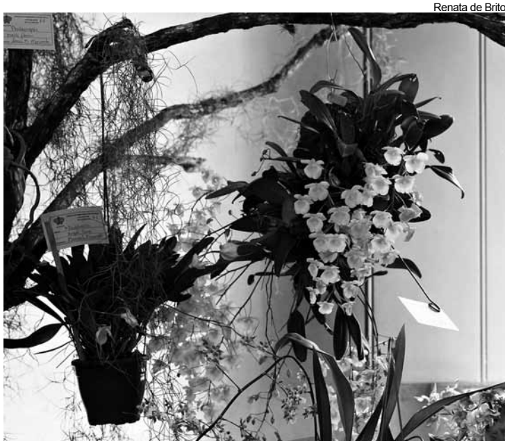
Diversas espécies estarão em exposição e o público poderá adquirir orquídeas e bromélias

Evento acontece entre dia 31 deste mês a 02 de novembro e a expectativa é de que cerca de duas mil pessoas visitem a exposição