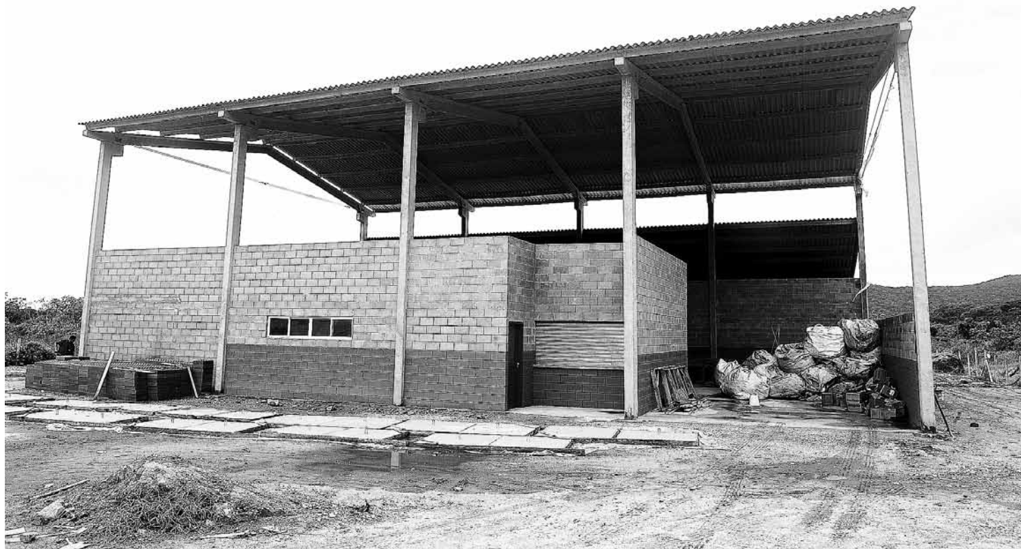
A Usina de Reciclagem de Lixo está sendo implantada no quilômetro 227 da Rodovia Rio-Santos

No local foram implantados dois galpões para separação do lixo reciclável e serão instaladas usinas de beneficiamento do óleo de cozinha e para o processamento de pneus velhos e coco. O contrato também prevê a coleta seletiva que já vem ocorrendo, com a distribuição de Postos de Entrega Voluntária (PVs) em diversos pontos da Cidade e a coleta de material