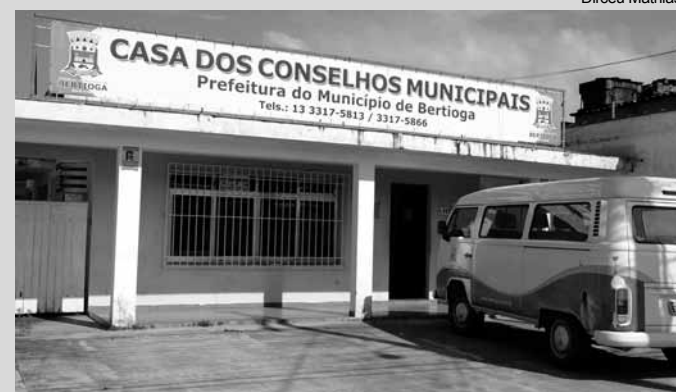
As inscrições podem ser feitas na Casa dos Conselhos, que fica na Rua Luiz Pereira de Campos, 1.117, no Centro

A Prefeitura de Bertioga, por meio da Casa dos Conselhos Municipais, realizará no dia 30 de outubro, das 9 às 18 horas, na Casa da Cultura, o "Seminário Intersectorial de Políticas Públicas". A meta é conscientizar gestores públicos, entidades e sociedade organizada sobre a importância do desenvolvimento das políticas integradas, focando temas transversais. As inscrições para participar do evento, podem ser feitas na Casa dos Conselhos, até 17 de outubro.