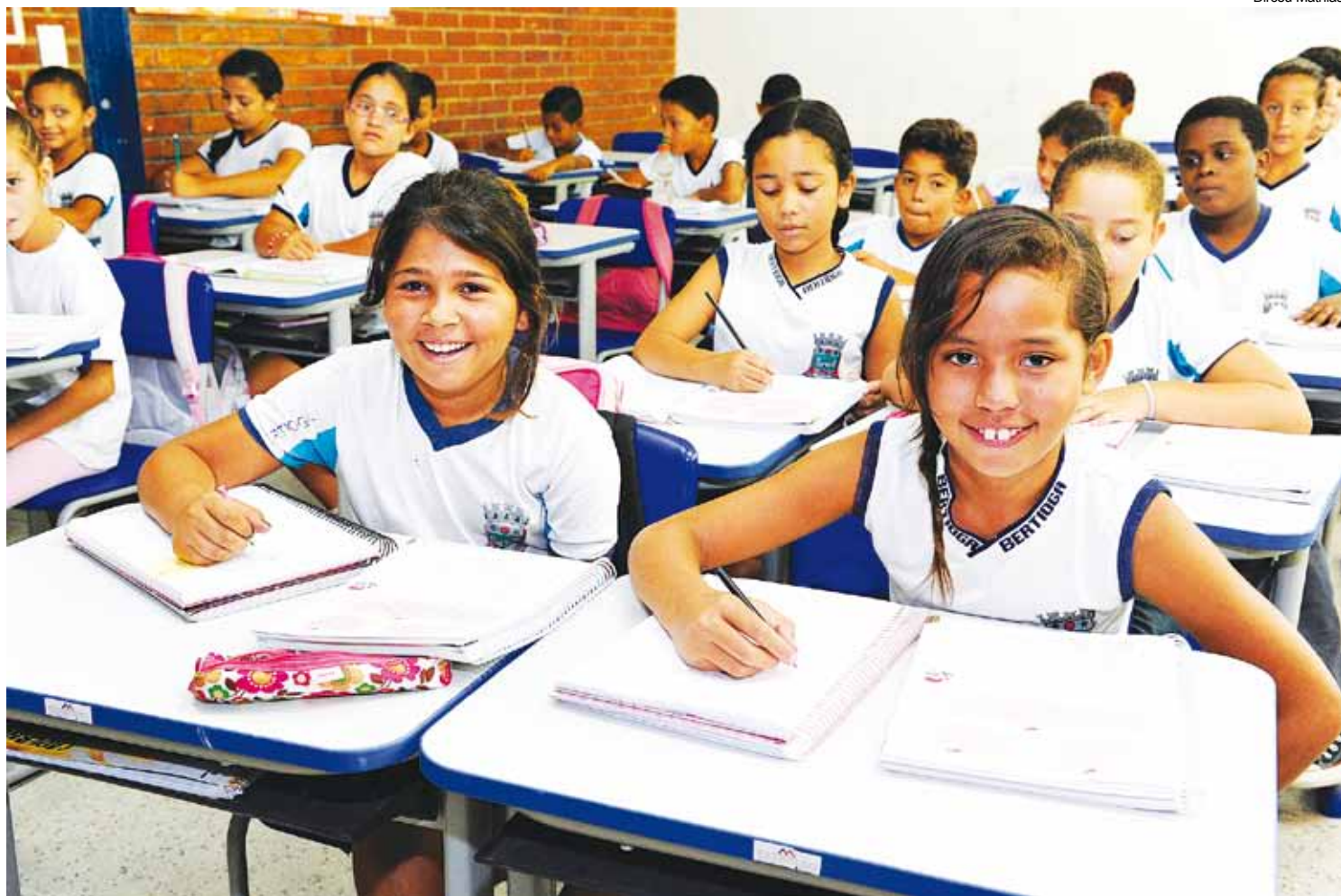
O resultado apontou que Bertioga apresentou maior evolução geral no Ideb, entre as redes municipais de ensino

Na avaliação do secretário municipal de Educação, esse resultado cumulativo