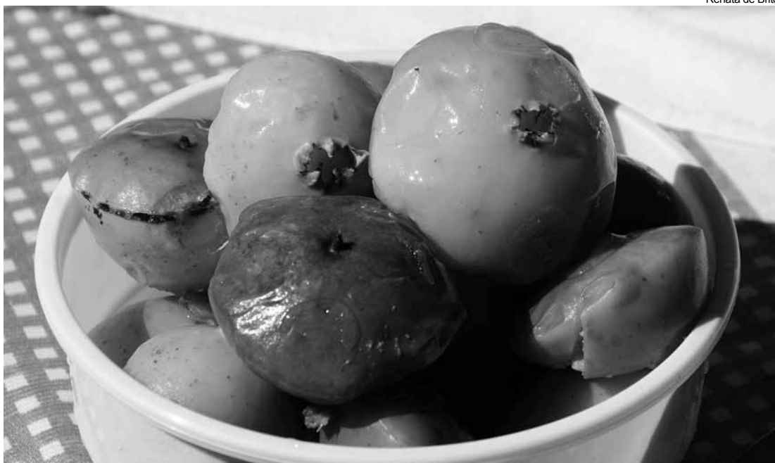
Com o fruto é possível preparar pratos doces e salgados, além de cachaça

A Prefeitura de Bertioga, por meio das secretarias de Meio Ambiente e de Turismo, Esporte e Cultura, divulga a programação do 1º Festival da Mata Atlântica, que faz parte da Rota Oficial do Cambuci, criada pelo Instituto Auá de Empreendedorismo Social. O evento acontece nos próximos dias 26 e 27, no Parque dos Tupiniquins, com uma programação que envolve oficinas de manejo e cultivo do cambuci, gastronomia e degustação de pratos com o fruto, além de exposições de artesanato e de fotografias.