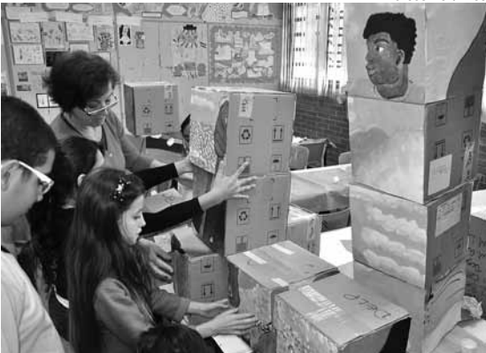
Técnica reaproveita papelão formando 25 cubos e suas faces