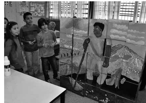
Os cubos são quebra-cabeças que se transformam em releituras de obras famosas