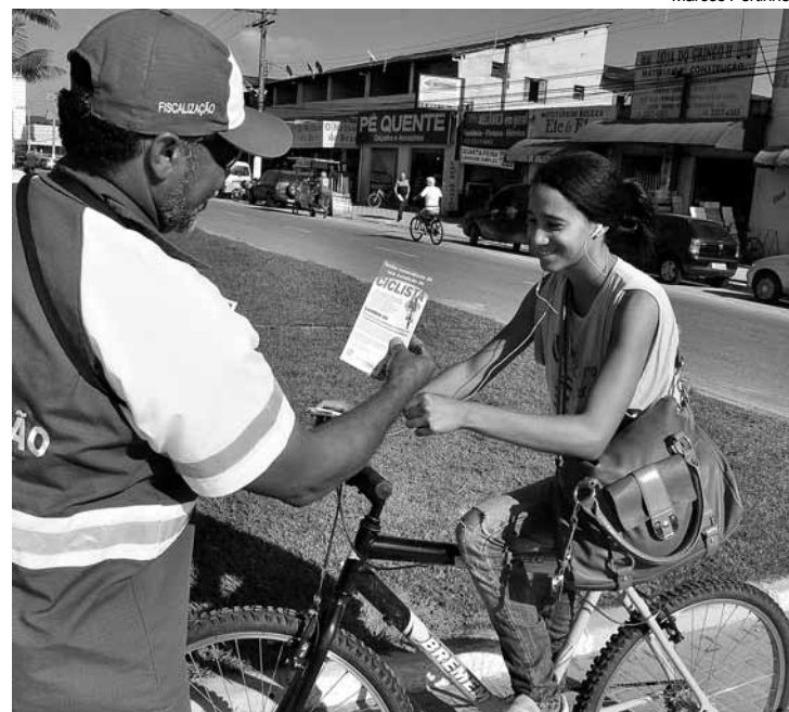
A Prefeitura vem realizando campanhas para prevenção de acidentes

em parceria com a Secretaria de Obras, por meio da Diretoria de Trânsito iniciará nos próximos dias a sinalização viária, com a pintura de solo da Avenida Anchieta, no trecho recém-pavimentado, em toda sua extensão, do bairro Albatroz ao bairro Indaiá. O objetivo é recuperar a segurança viária dos usuários do sistema. Essa sinalização inclui a ciclovia.