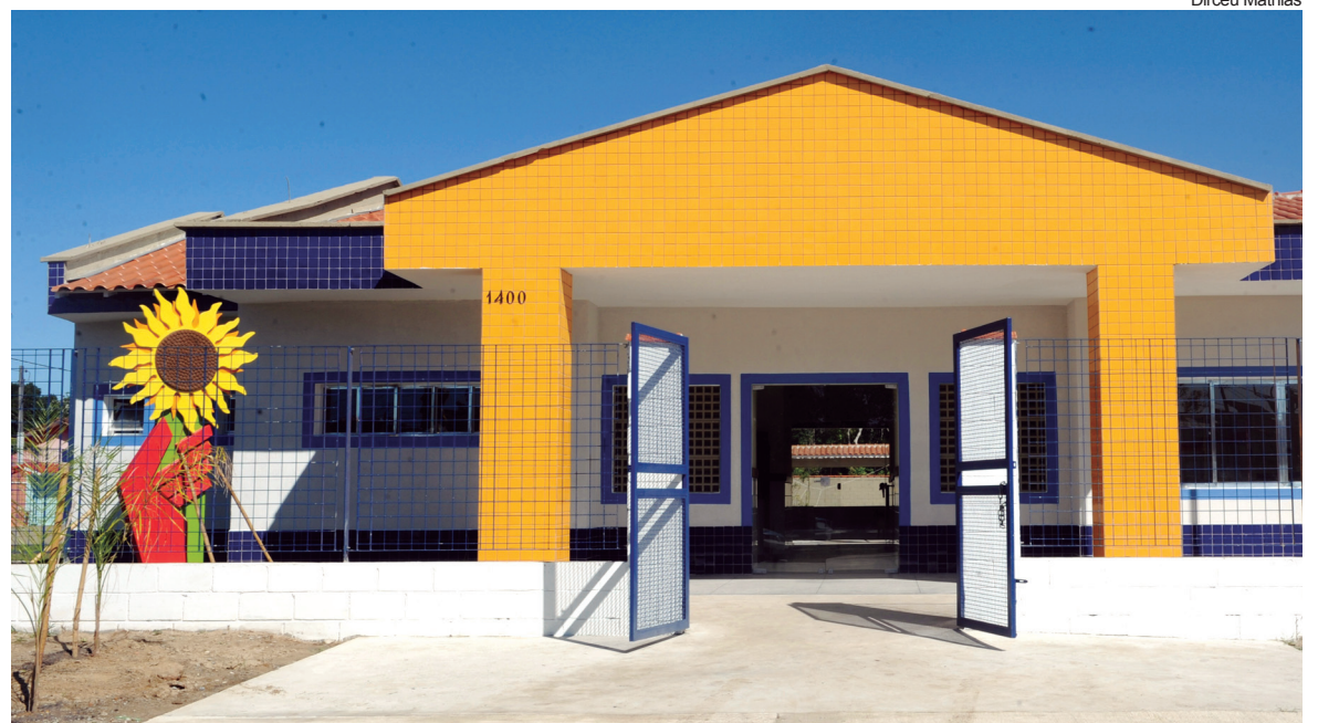
A unidade terá capacidade para atender 224 crianças entre 1 e 4 anos de idade

A unidade terá capacidade para atender 224 crianças entre 1 e 4 anos de idade. O projeto conta com oito salas de aula, sala de informática, sala de múltiplo uso, espaço para amamentação, fraldário, anfiteatro e playground.