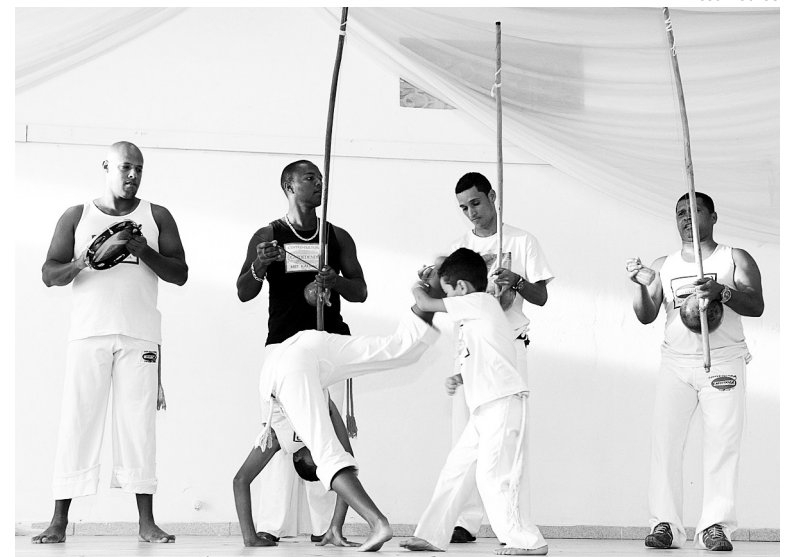
Além da tradicional capoeira, os apreciadores poderão participar do 'aulão' aberto