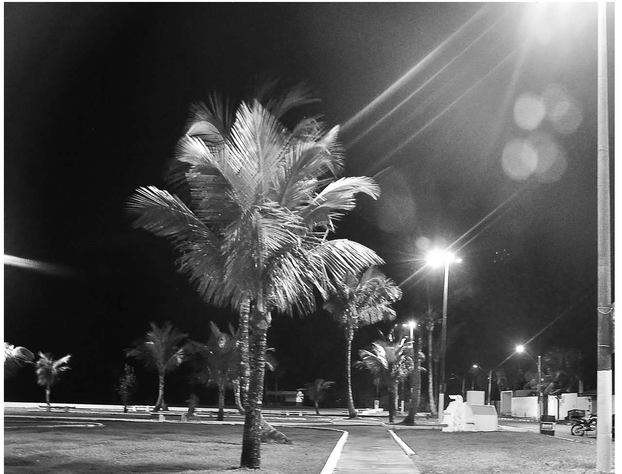
Na Avenida Anchieta foi realizado teste de acionamento das luminárias e a Praça José Ermírio de Moraes recebeu nova iluminação

Mais um bairro foi beneficiado com nova iluminação que está sendo implantada pela Prefeitura de Bertioga, por meio da Diretoria de Gestão de Energia. Desta vez foi o Indaiá, com a instalação de novas luminárias na Praça José Ermírio de Moraes. O acionamento das luzes aconteceu na noite de terça-feira (29) e o canteiro central, que fica em frente à Praça também foi beneficiado com novas luminárias.