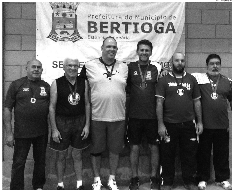
Equipe vai participar de mais quatro rodadas este ano