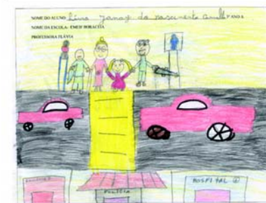
Livia Janay do Nascimento Carvalho - 7 anos