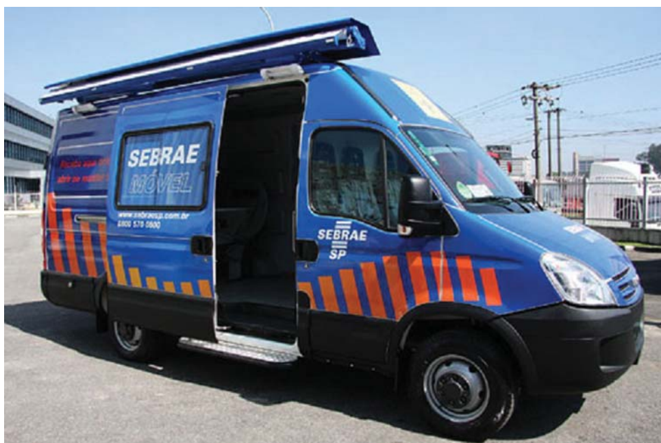
Serviço estará em Bertioga nos próximos dias 16 e 19

No dia 19, das 10h30 ao meio-dia a palestra será sobre Administração Competitiva. Das 14h às 15 horas o tema será Empreendedor Individual. E, fechando a programação, das 15h às 16 horas, será ministrada palestra sobre ‘Qualidade no relacionamento com o Cliente’.