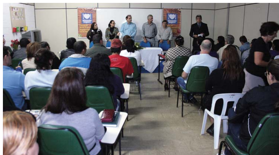
Cerca de 150 pessoas estiveram presentes na aula inaugural