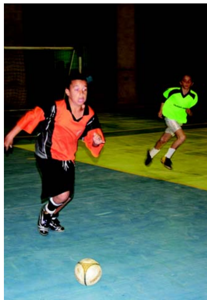
Competição envolve mais de 1,6 mil atletas

A Prefeitura de Bertiooga vem investindo no esporte como uma forma de melhorar a qualidade de vida da população. Na opinião do prefeito, o esporte é uma ferramenta de extrema importância para o desenvolvimento cultural e