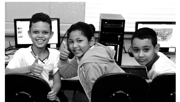
Educação de Bertioga também recebeu boa classificação pelo estudo da Firjan