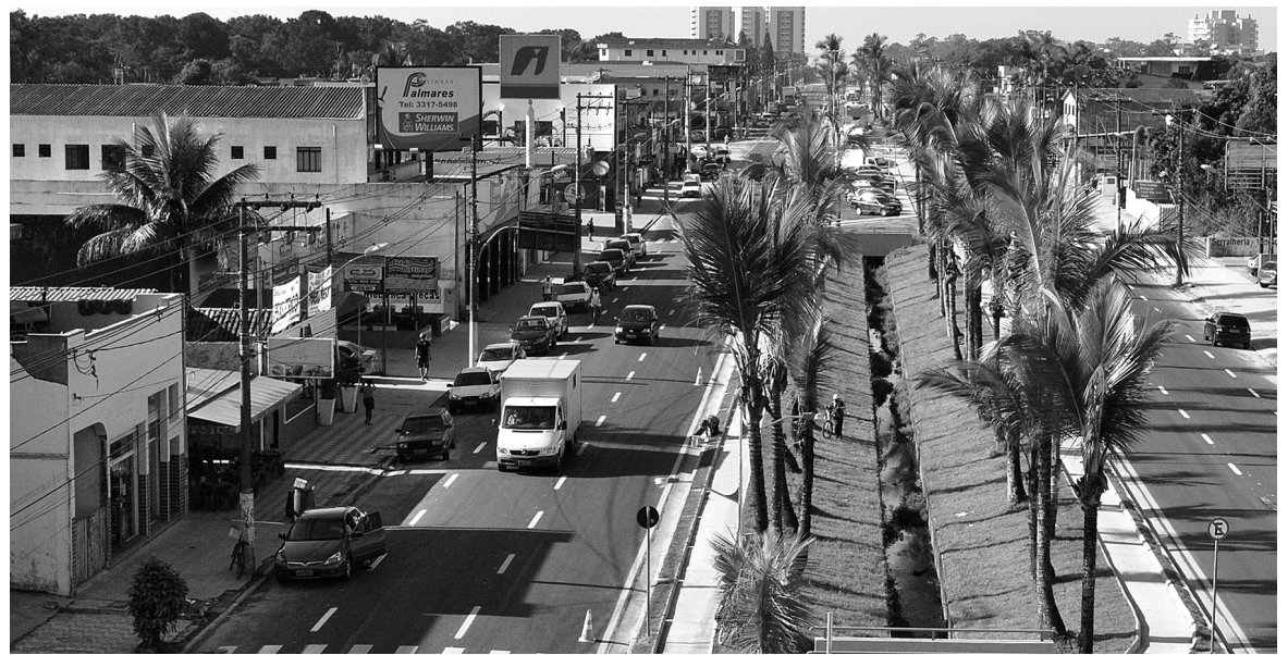
Cidade alcançou o nível 0,8059 de desenvolvimento social, índice considerado alto

Bertioga é a segunda cidade da Região Metropolitana da Baixada Santista, em desenvolvimento socioeconômico, conforme aponta estudo realizado pela Federação das Indústrias do Rio de Janeiro (Firjan). O Município aparece na 283ª posição em nível nacional e 137ª no estadual. Seu índice de desenvolvimento também foi considerado alto com 0,8059.