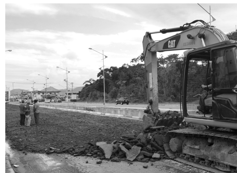
Serviços de recapeamento fazem parte da obra de duplicação da Avenida Anchieta

Com custo total de R$ 31,8 milhões, provenientes do Programa Saneamento para Todos, do Governo Federal, com contrapartida da Prefeitura de Bertioga no valor de R$ 9,5 milhões, os serviços estão sendo executados pela Terracom Engenharia Ltda.