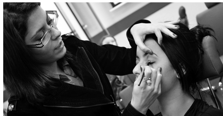
Todos os cursos, como de maquiador, contam com materiais gratuitos