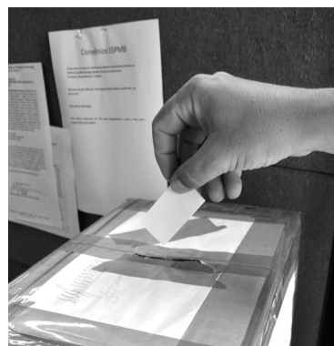
Renata de Brito Nononon on onno nonon onon noonnon nonono noon nonononon

Cipa - A diretoria do Sindicato dos Servidores Públicos Municipais de Bertioga (SSPMB) vai começar a percorrer as repartições públicas com a urna destinada a recolher votos para a eleição da Comissão Interna de Acidentes (Cipa), da Prefeitura de Bertioga. O objetivo é garantir o maior número possível de votantes, uma vez que a legislação determina que o pleito seja legítimo com a participação de 50% mais um de votos dos servidores concursados. A urna está disponível na sede do Sindicato, que fica na Rua Ivo Henrique, 50, Vila Itapanhaú. A CIPA é composta por 10 membros efetivos e 10 suplentes. O presidente é indicado pelo prefeito de Bertioga, após a finalização do pleito. Os membros da CIPA não são remunerados para realizar o trabalho e o mandato é de dois anos. A votação pode ser feita das 9 às 15 horas. Mais informações podem ser obtidas pelo telefone 3317-2223.