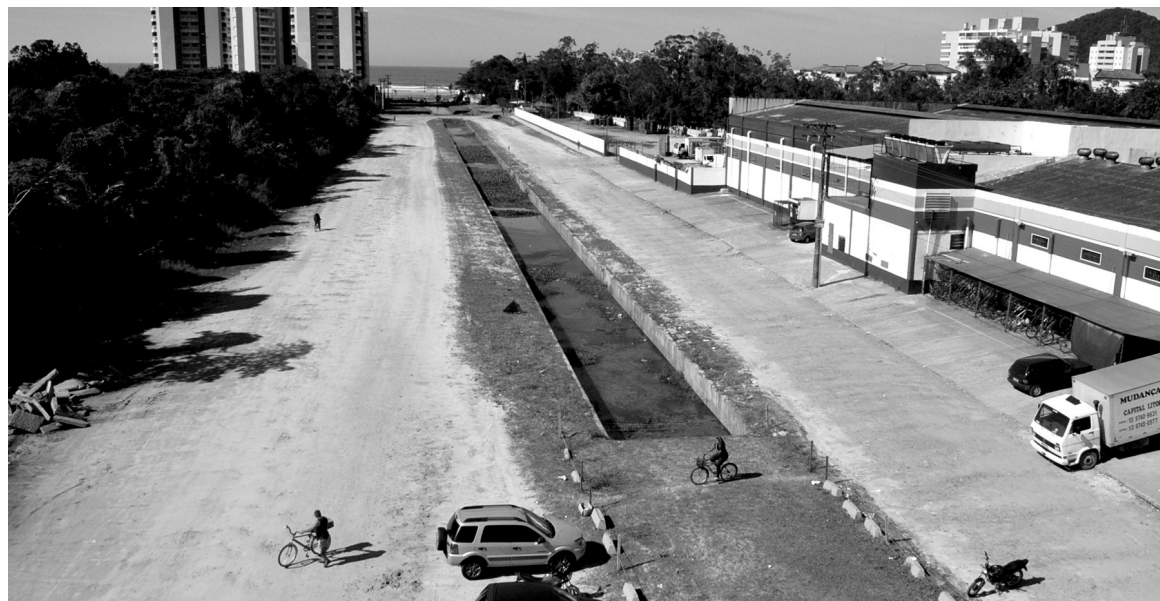
Trecho entre a Praça dos Emancipadores até a Rua João Ramalho terá as duas pistas pavimentadas

“São duas ordens de serviço que muito beneficiam Bertioga. Essas e outras obras que estamos realizando representam um novo momento de desenvolvimento para a Cidade. Tudo isso é fruto de um trabalho incessante. Nos últimos anos, ampliamos o investimento em infraestrutura, fazendo grandes obras