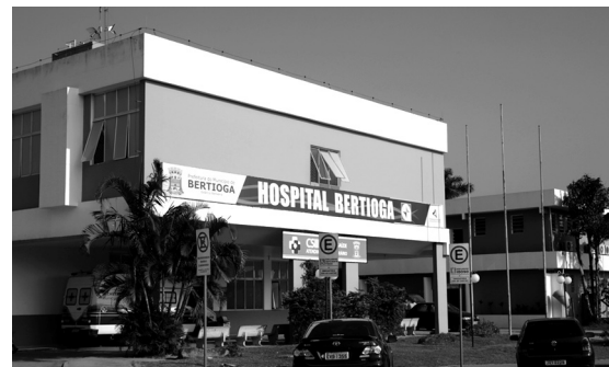
Saúde vem recebendo investimentos que refletem na qualidade de vida do cidadão