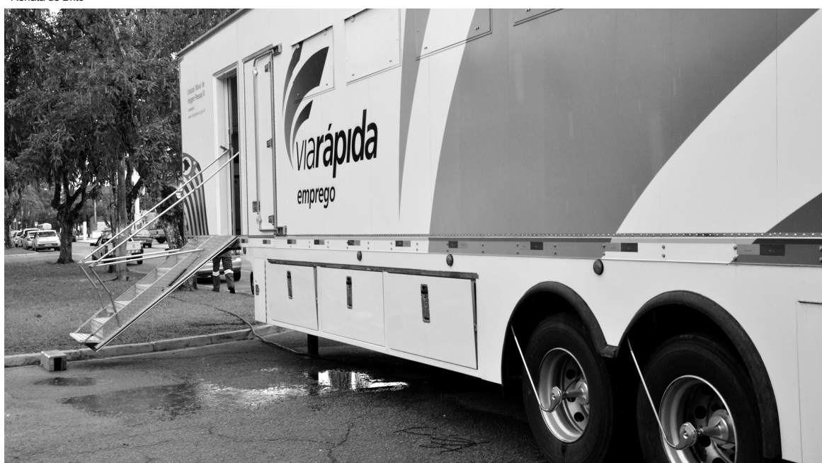
Carreta simula um salão de beleza com todos os equipamentos como secadores, cadeiras e espelhos

Um grupo de 60 pessoas já está se qualificando no curso de imagem pessoal, disponibilizado pela Prefeitura de Bertioga, por meio do programa Via Rápida Emprego, do Governo Estadual. São cursos de 'Assistente de Cabeleireiro', 'Maquiador' e 'Manicure/Pedicure', com 20 pessoas cada um, e que também poderão garantir um ganho extra para os participantes, a maioria mulheres.