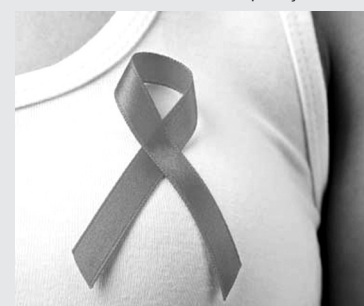
Organização pede que todos compareçam ao evento vestidos com uma peça cor de rosa