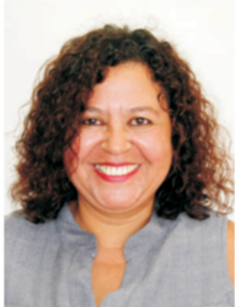
07 - BRANCA