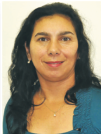
03 - LAU