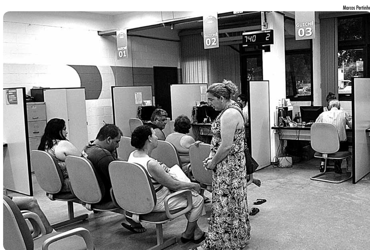
901 – Vila Itapanhaú.

Contribuintes começaram a receber os carnês em suas residências. Desde o dia 09, a segunda via do tributo já está disponibilizada online