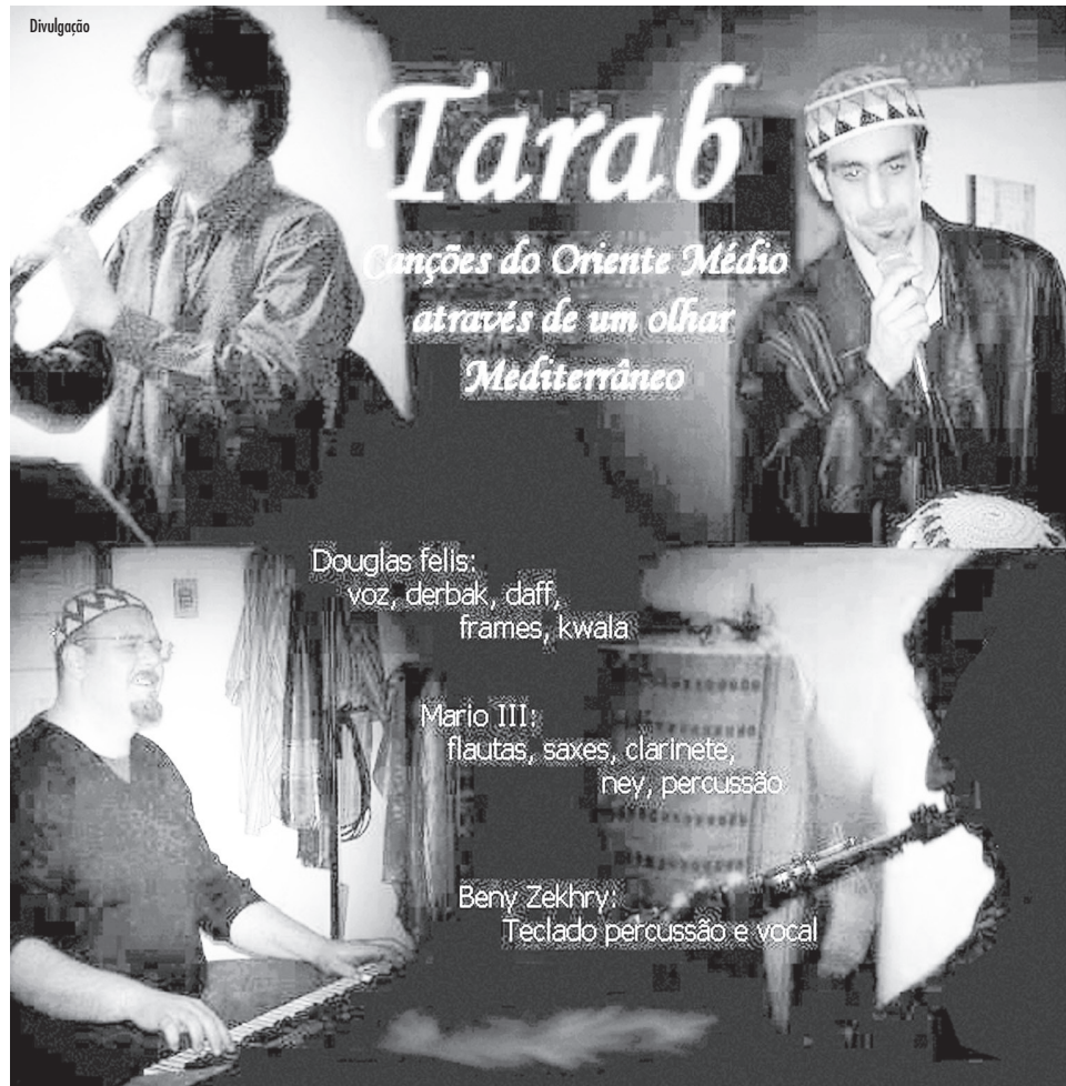
Grupo Tarab, apresentando um passeio musical pelo Mediterrâneo, com canções populares e clássicas de todas as regiões onde os sons nascem.