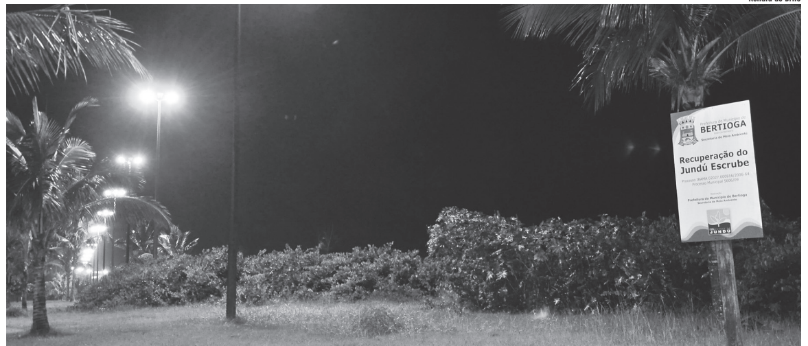
Renata de Brito

O diretor ressalta que esse trecho da orla da Enseada ainda será contemplado com mais 40 luminárias, totalizando 84 equipamentos destinados para a localidade, que devem ser disponibilizados até o fim deste mês de março. Após a conclusão, cada poste, no total de 21, contará com quatro luminárias, ampliando o raio de abrangência da luminosidade.